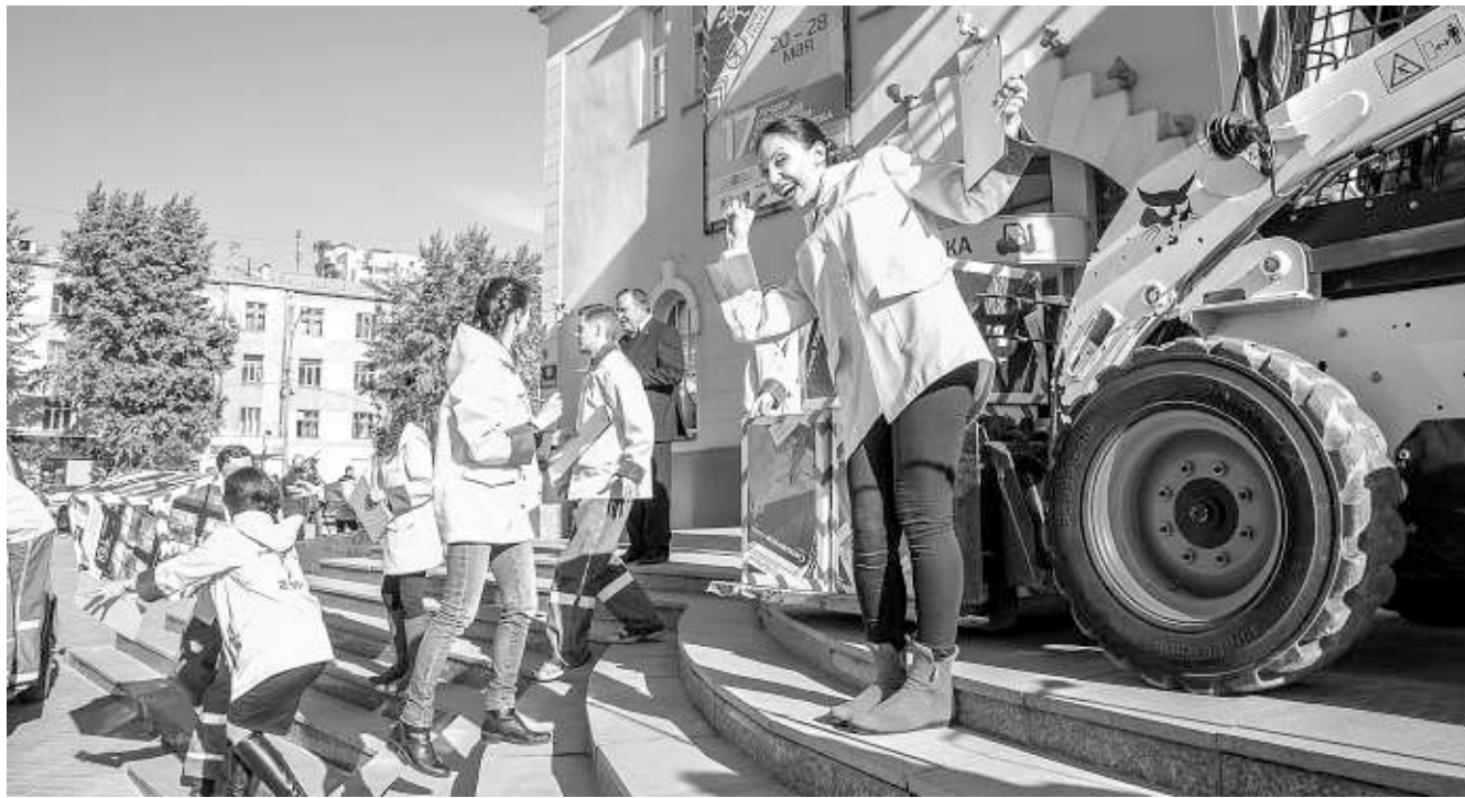
«Ново-Сибирский транзит» открылся «автодорожным» перформансом на ступенях театра «Красный факел».

Как известно, символ «Ново-Сибирского транзита» — колесо, приводящее жизнь в движение. Два года назад организаторы обыграли открытие фестиваля в аэрометафорах: аэропорт, табло прилёта, стюардессы. На этот раз межрегиональный фестиваль, к слову, самый крупный в России после «Золотой маски», взялся за тему автодорог.