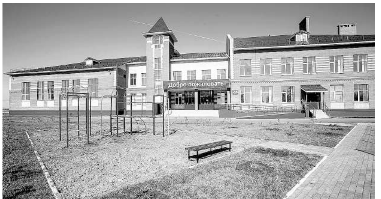
Школа в селе Тебисское построена на перспективу — на 260 мест. Сейчас здесь учатся 170 ребят.

вом море), уникальная целебная минеральная вода «Карачинская», йодобромная вода, а также благоприятные ландшафтно-климатические условия. Эти дары природы позволяют излечить многие заболевания.