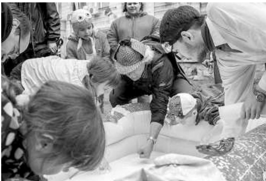
«Городок Архимеда» наглядно демонстрировал, что жидкость бывает твёрдой и что не всякий огонь обжигает.

«Через 20 лет вы будете вести науку за собой. И если вам действительно интересна какая-то научная область, то несмотря ни на что вы должны следовать вашему увлечению и вносить свой вклад в развитие науки».