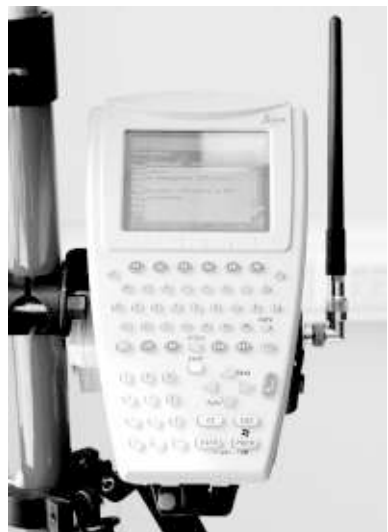
Ровер — прибор, с помощью которого измеряются координаты точки.

Сейчас к серверу департамента информатизации подключено около 200 пользователей, активно используют сеть станций половина из них. Это компании, занимающиеся геодезическими работами. Полезен этот сервис будет не только специалистам геодезии, но и многим жителям области. Сейчас небогатые люди зачастую не оформляют право собственности на свои дачные участки из-за дороговизны услуги. Наземная сеть