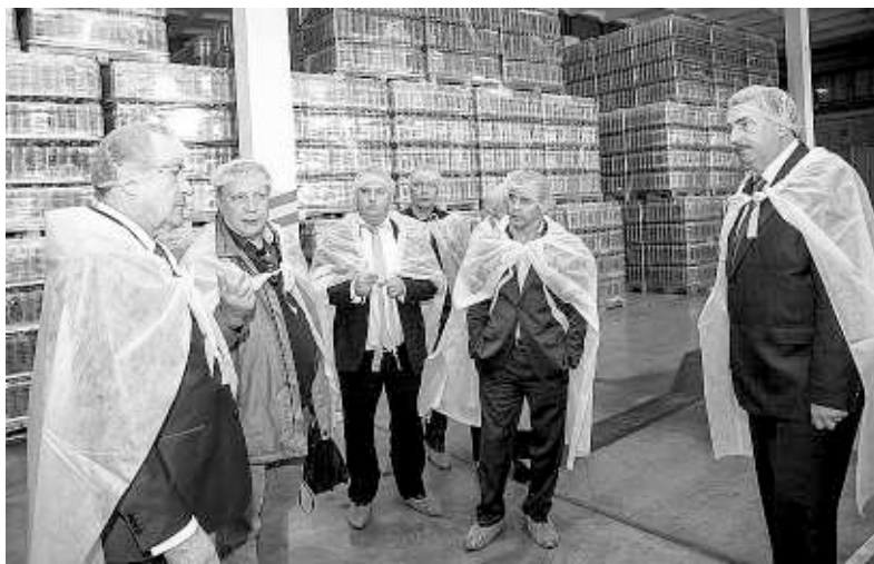
Завод по розливу лечебно-столовой минеральной воды «Карачинская» — один из крупнейших налогоплательщиков района.