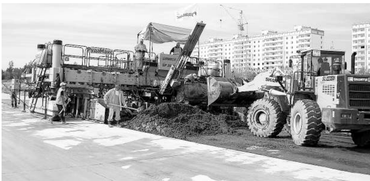
Бетоноукладчик Gomaoko с шириной укладки 9,75 метра — единственный в Западной Сибири.

полтора километра, которая огибает территорию сектора «В» с запада. До этого в 2012—2013 годах уже были построены сквозные опорные трассы № 1 и № 3.