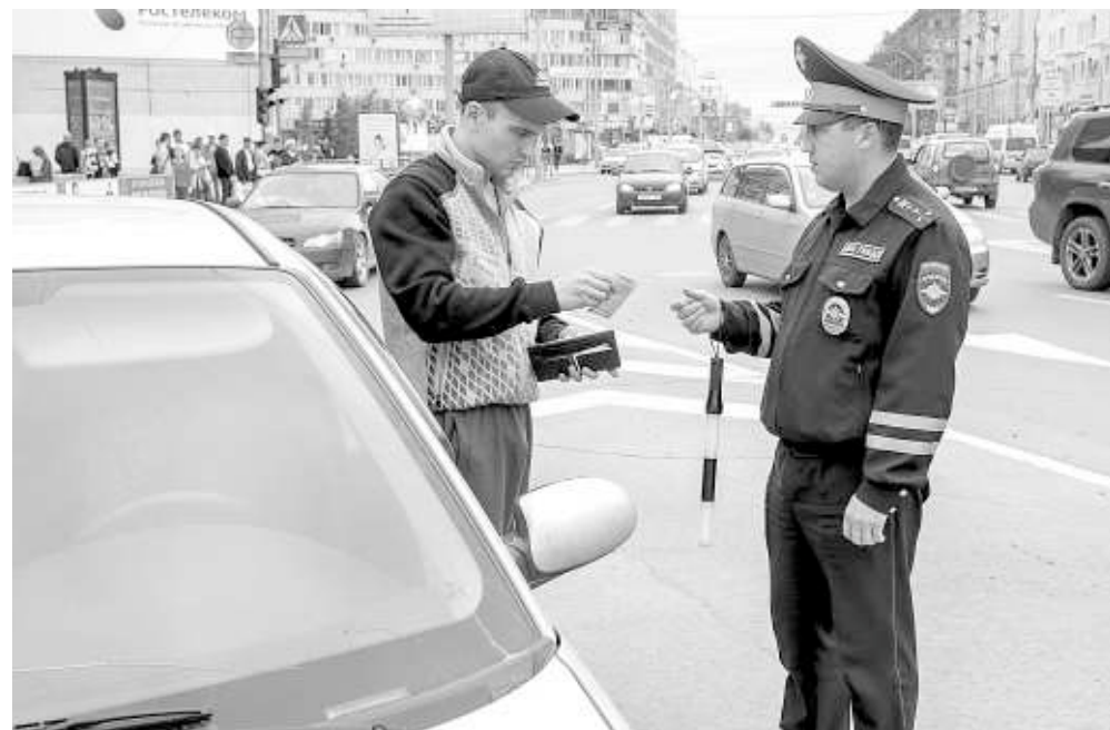
В помощь сотрудникам ГИБДД на территории Новосибирска установили 33 комплекса фото- и видеofиксации.

В 2012 году нарушители ПДД заплатили штрафы на сумму свыше 273 млн рублей, в 2013-м — 425,4 млн. За первый квартал нынешнего года оплачено штрафов почти на 145 млн рублей — прирост к аналогичному периоду прошлого года 207 процентов.