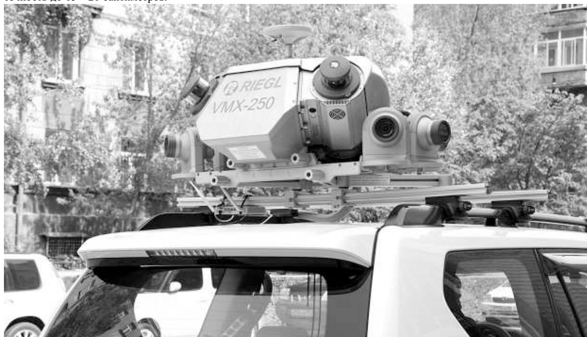
Мобильная лазерная 3D-лаборатория установлена на крыше автомобиля.

Это позволяет решать ряд задач, которые раньше были недоступны. Если автомобилю будут оснащены таким прибором, то с помощью космических спутников и сети наземных станций можно будет не только измерять скоростной режим, но и фиксировать такие нарушения, как поворот не из своего ряда или пересечение двойной сплошной — и это на территории всей области, без камер фото- и видеофиксации!