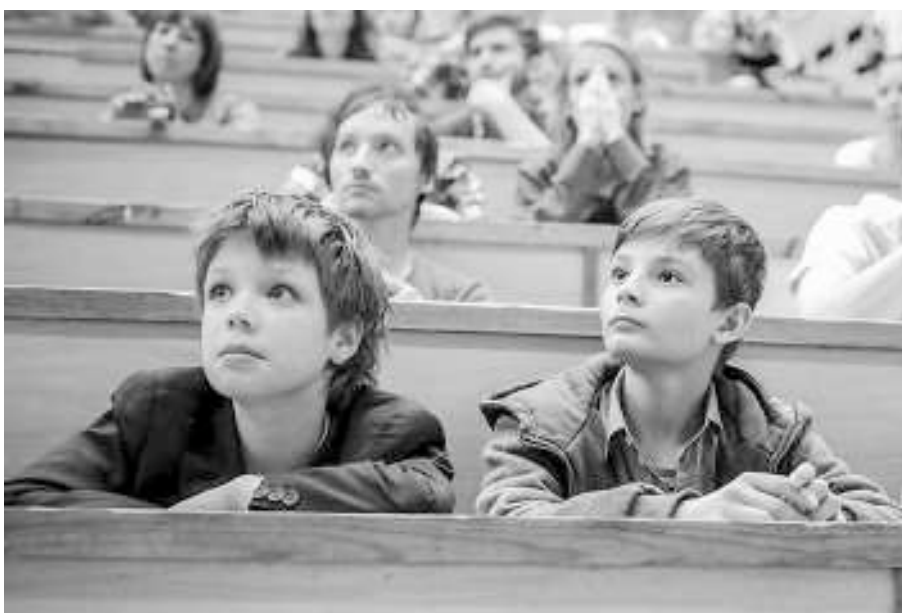
События фестиваля науки были интересны самой широкой публике. Даже дети «смотрели во все глаза» и «слушали во все уши».

Какую опасность содержит в себе одна выпитая чашечка кофе? Что следует знать начинающему палеонтологу? Для чего учёные доят мышей? В течение четырёх дней о науке «лёгким слогом» рассказывал фестиваль EUREKA!FEST.