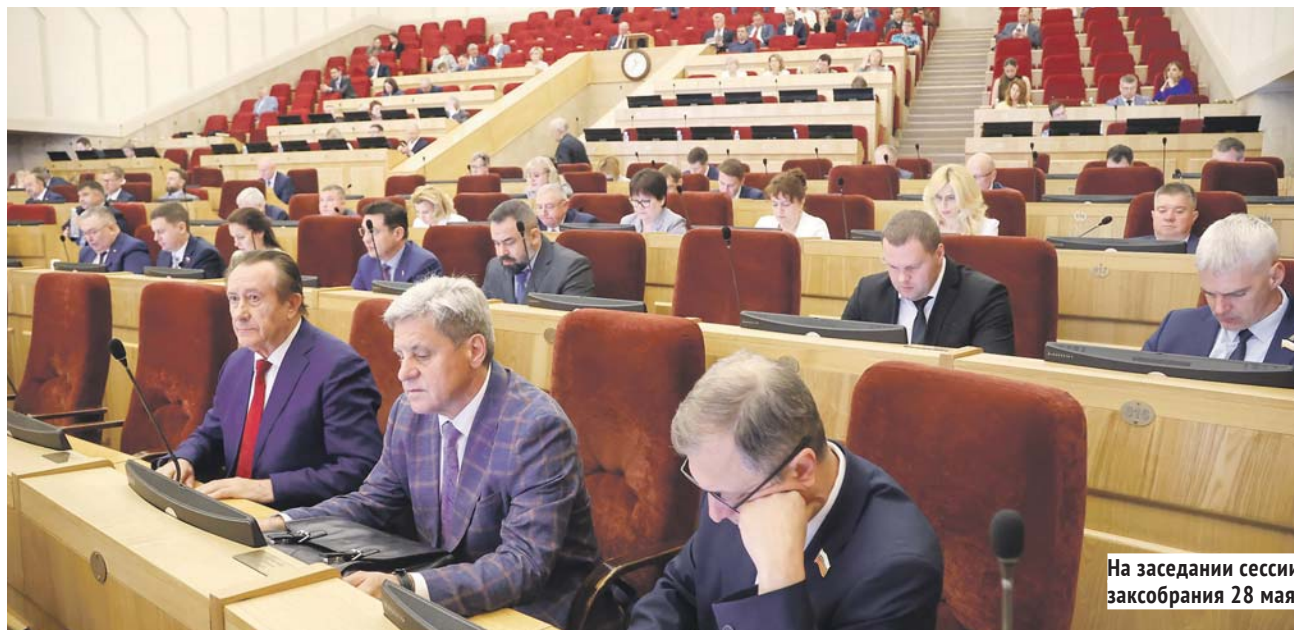
На заседании сессии заксобрания 28 мая.

Изменения в закон «О наградах Новосибирской области» было необходимо внести для совершенствования наградной системы, официального признания заслуг волонтеров, развития добровольческого движения. В поправках предлагается установить наименование знака отличия «За милосердие, добровольчество и благотворительность». Определён круг награждаемых, основания награждения, размер выплаты награждённому, порядок ношения знака отличия.