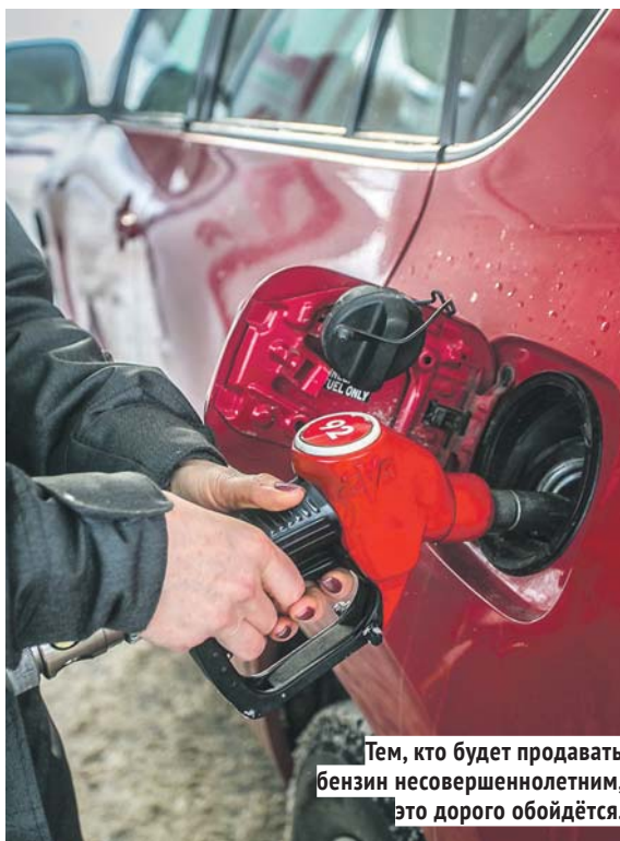
Тем, кто будет продавать бензин несовершеннолетним, это дорого обойдётся.

Прокурор Новосибирской области Александр Бучман представил на сессии заксобрания изменения в областные законы о защите прав детей и об административных правонарушениях. Они предусматривают запрет розничной продажи несовершеннолетним автомобильного бензина, дизельного топлива, лакокрасочных материалов (исключение — молодые люди 16 лет и старше, имеющие права на управление автомобилем и покупающие бензин для заправки машины). За нарушение этого запрета в законе об административных правонарушениях вводится наказание в виде наложения административного штрафа на должностных лиц — от трёх