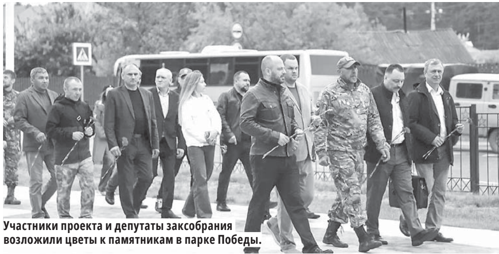
Участники проекта и депутаты заксобрания возложили цветы к памятникам в парке Победы.