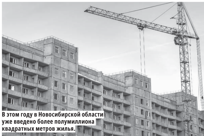
В этом году в Новосибирской области уже введено более полутора миллиона квадратных метров жилья.

— В процессе строительства находится 12 школ, часть из