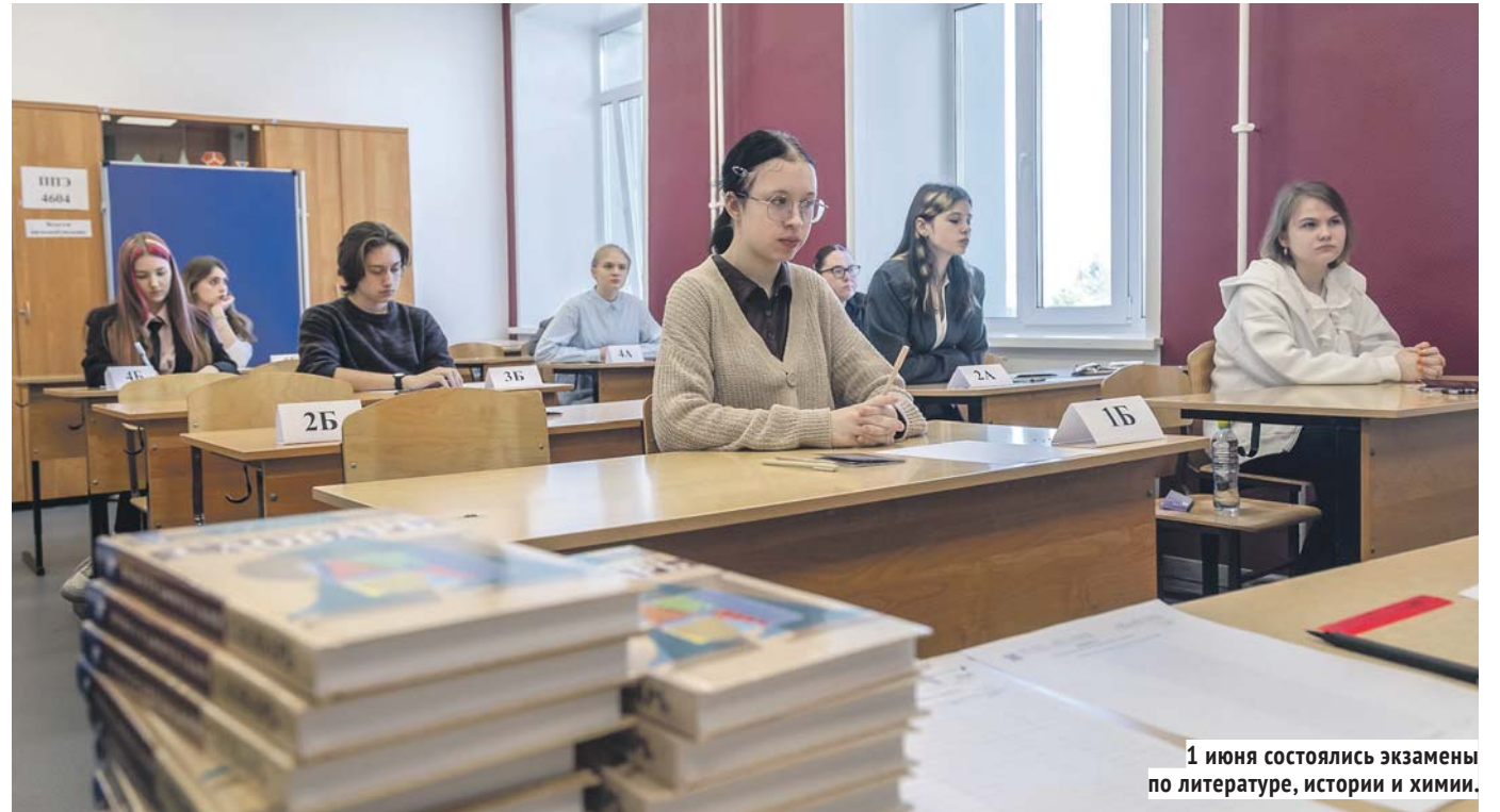
1 июня состоялись экзамены по литературе, истории и химии.