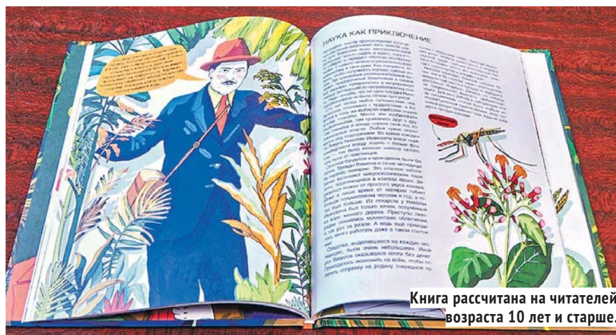
Книга рассчитана на читателей возраста 10 лет и старше.