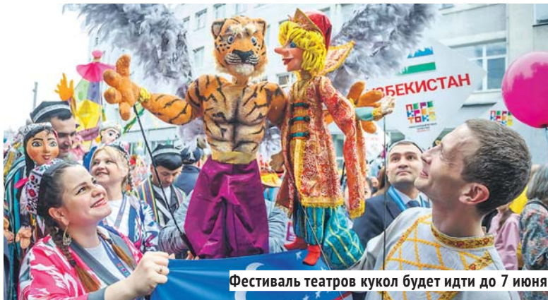
Фестиваль театров кукол будет идти до 7 июня.

Хмурый воскресный день 1 июня расцвёл яркими красками, когда на улице Ленина собрались красивые люди, чтобы пройти «по главной улице с оркестром» весёлым театрализованным шествием. География у «ПЕРЕКРЕСТКА» в этот раз грандиозная: международную фестивальную программу представят коллективы из Индонезии, Ирана, Китая, Саудовской Аравии, Таджикистана, Турции, Египта и Узбекистана, а за «русский колорит» отвечают театры Новосибирска, Санкт-Петербурга, Вологды, Перми, Барнаула и новых регионов — Луганска и Горловки.