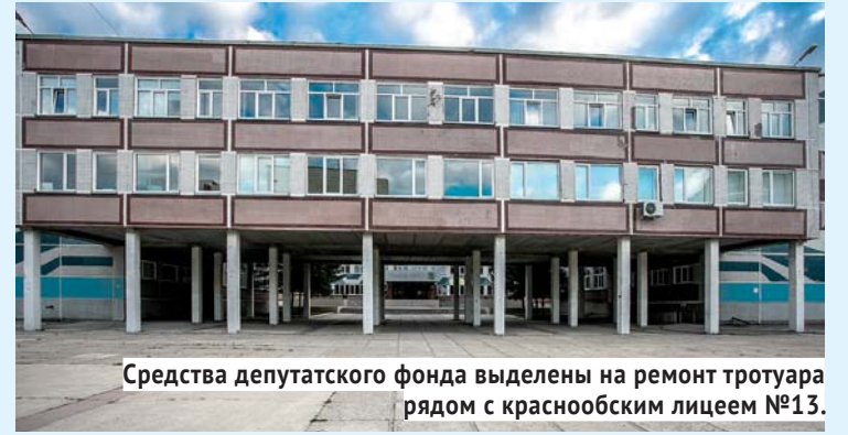
Средства депутатского фонда выделены на ремонт тротуара рядом с краснообским лицеем №13.