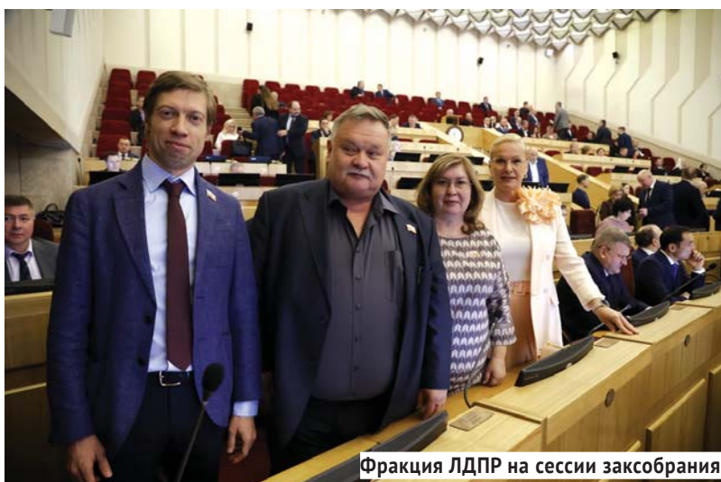
Фракция ЛДПР на сессии заксобрания.

Ещё одна острая тема для сельской местности — базовые коммунальные удобства. Люди не просят чего-то сверхъестественного — им нужно, чтобы