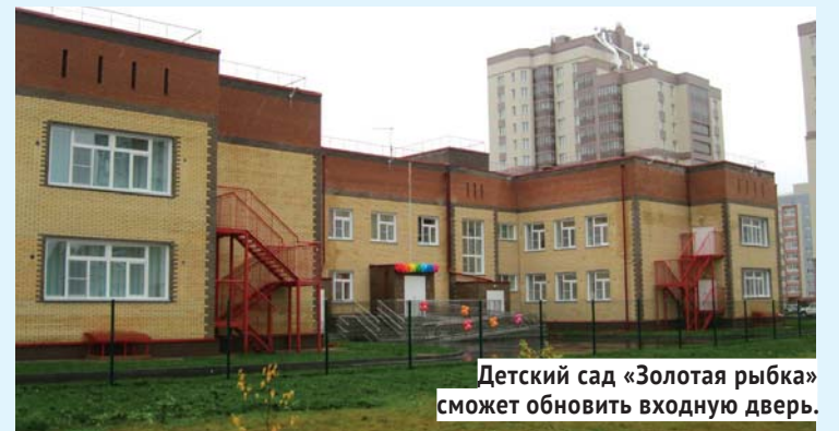
Детский сад «Золотая рыбка» сможет обновить входную дверь.