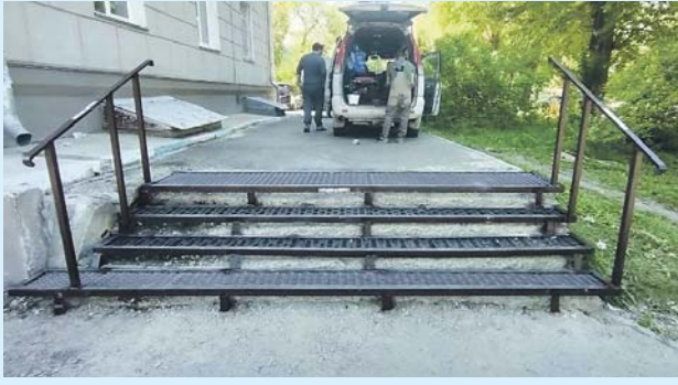
Произведён монтаж новой металлической лестницы с поручнями с торца дома на ул. Авиастроителей, 15.