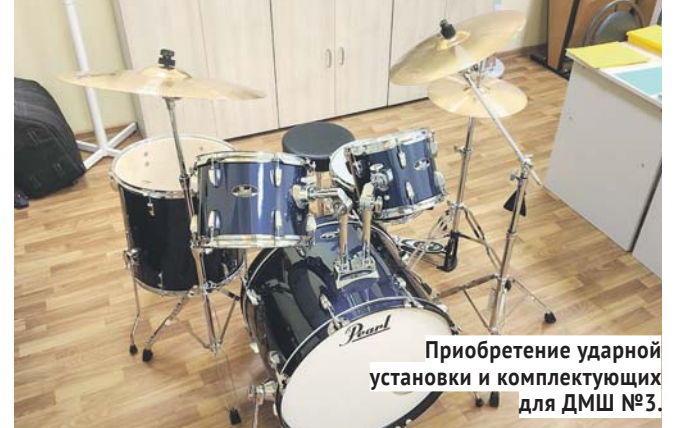
Приобретение ударной установки и комплектующих для ДМШ №3.