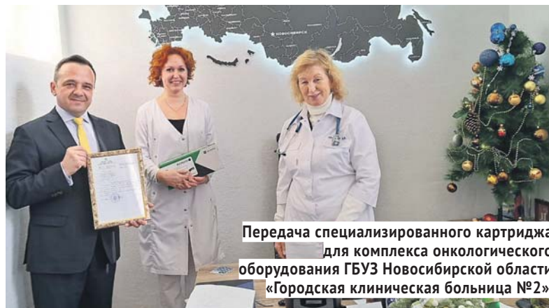
Передача специализированного картриджа для комплекса онкологического оборудования ГБУЗ Новосибирской области «Городская клиническая больница №2».