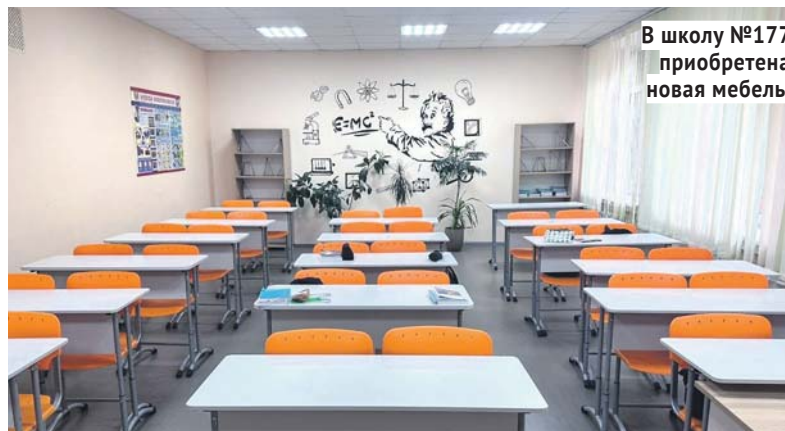
В школу №177 приобретена новая мебель.