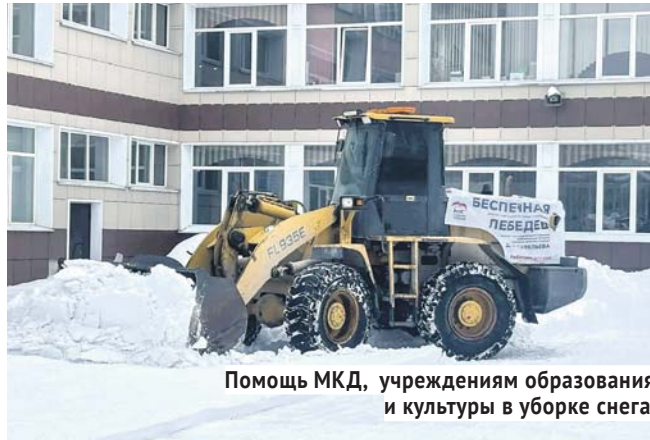
Помощь МКД, учреждениям образования и культуры в уборке снега.