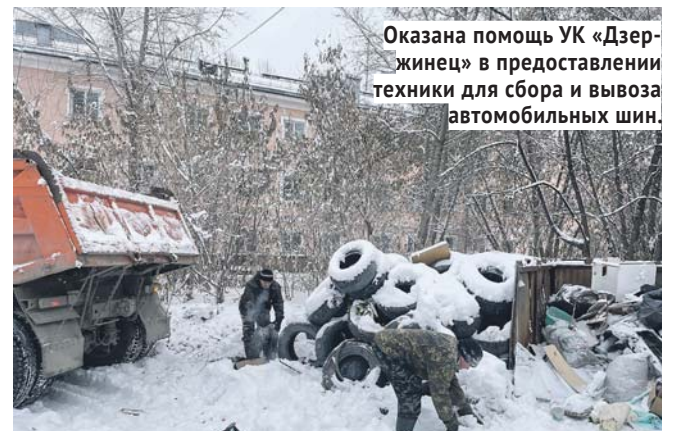
Оказана помощь УК «Дзержинец» в предоставлении техники для сбора и вывоза автомобильных шин.