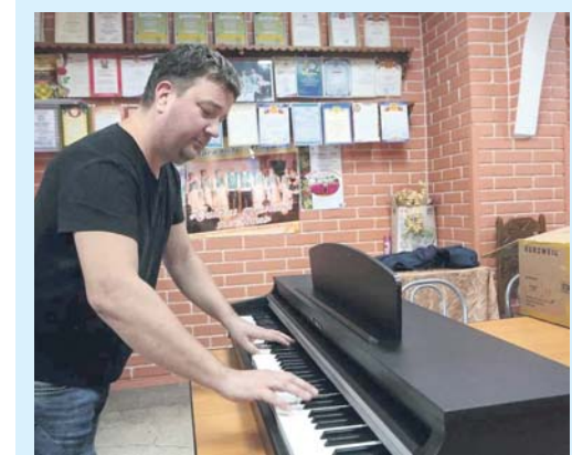
Приобретены два цифровых фортепиано для ЦКДР (ул. Театральная, 1).