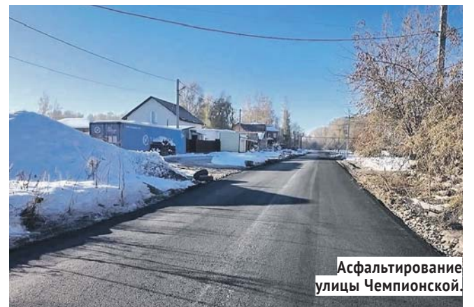
Асфальтирование улицы Чемпионской.