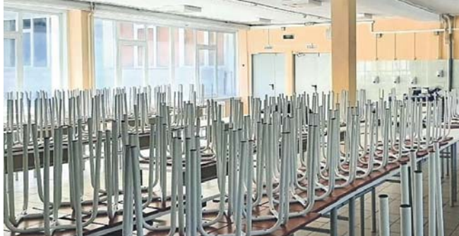
В школе №7 (ул. А. Лежена, 22) произведён косметический ремонт школьной столовой.