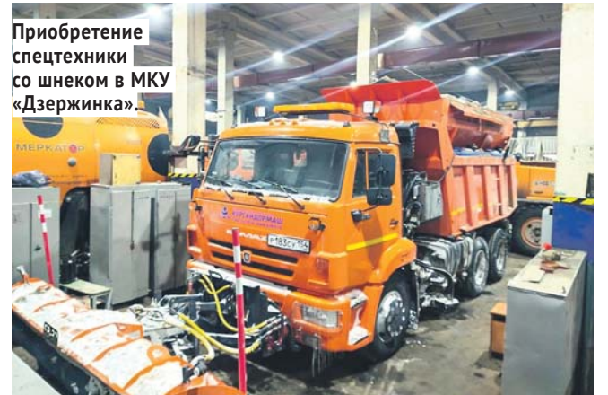
Приобретение спецтехники со шнеком в МКУ «Дзержинка».