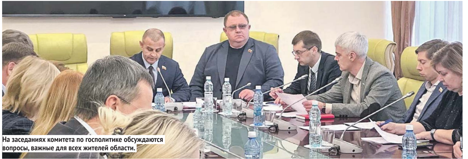
На заседаниях комитета по госполитике обсуждаются вопросы, важные для всех жителей области.

Госпрограммы позволяют привлекать софинансирование: на рубль местного бюджета мы получаем 10, а иногда и 50 рублей из областного и федерального бюджетов. Наша депутатская работа здесь заключается в том, чтобы помочь муниципалитетам подготовить проектно-сметную документацию и пройти госэкспертизу. Нет документации — объект в программу не попадёт.