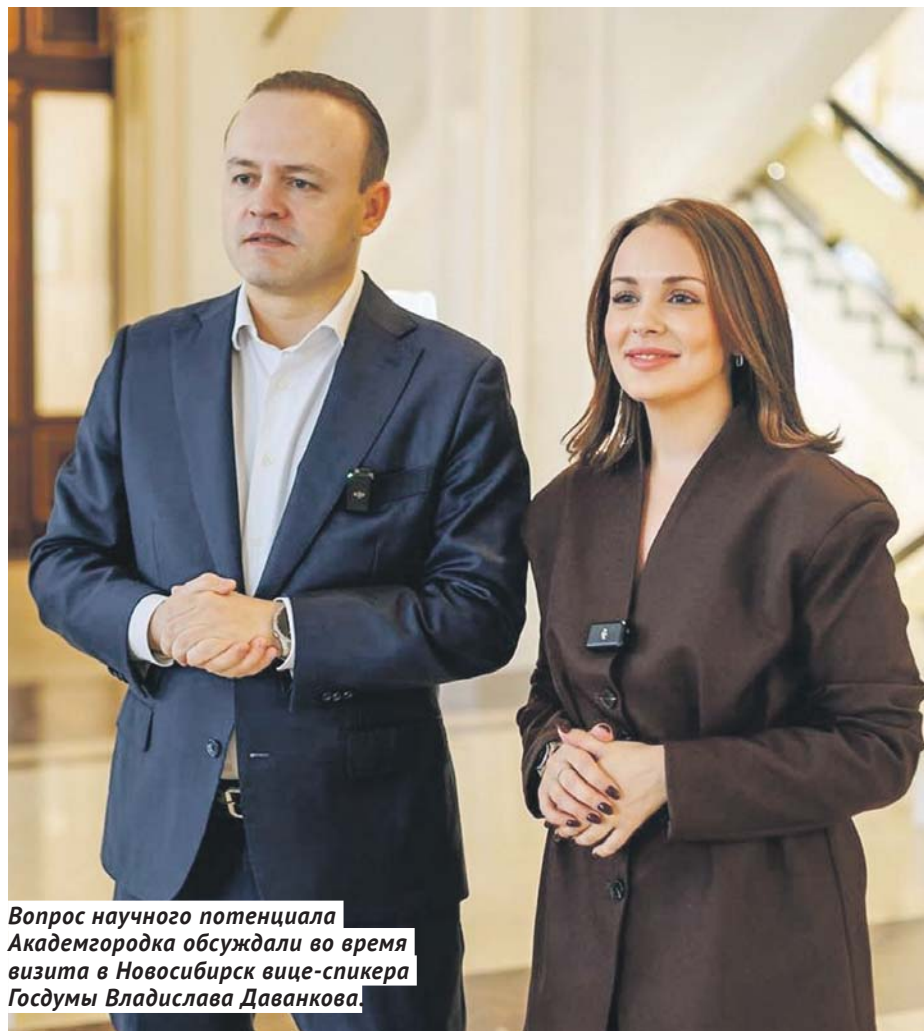
Вопрос научного потенциала Академгородка обсуждали во время визита в Новосибирск вице-спикера Госдумы Владислава Даванкова.

” Экономику не развить повышением налогов или введением новых штрафов. Это путь в никуда, который загоняет предпринимателей в тень или вынуждает уходить в другие регионы.