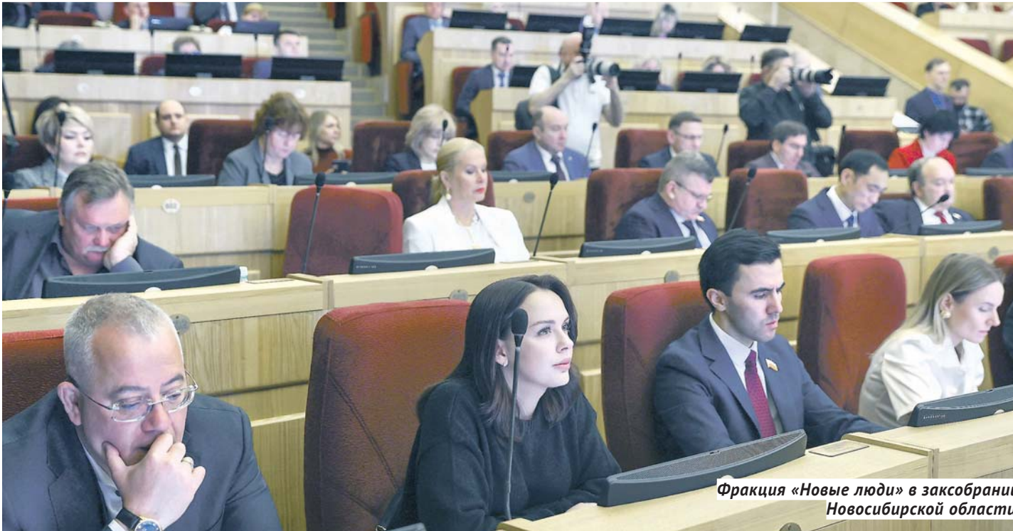
Фракция «Новые люди» в заксобрании Новосибирской области.