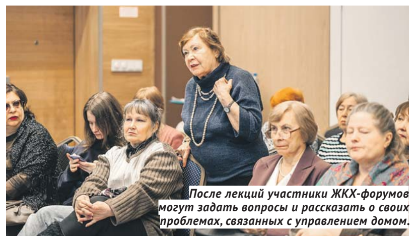
После лекций участники ЖКХ-форумов могут задать вопросы и рассказать о своих проблемах, связанных с управлением домом.

На ЖКХ-форумах совмещают теоретические знания и практику. Сначала перед участниками собраний выступают эксперты: депутаты, юристы, представители коммунальных служб и госжилинспекции. После этого начинается работа в группах, где жители учатся правильно фиксировать нару-