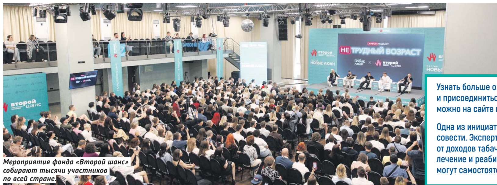
Мероприятия фонда «Второй шанс» собирают тысячи участников по всей стране.

Узнать больше о работе фонда и присоединиться к его деятельности можно на сайте второйшанс.рф