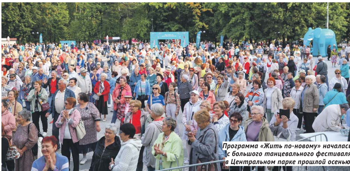
Программа «Жить по-новому» началась с большого танцевального фестиваля в Центральном парке прошлой осенью.