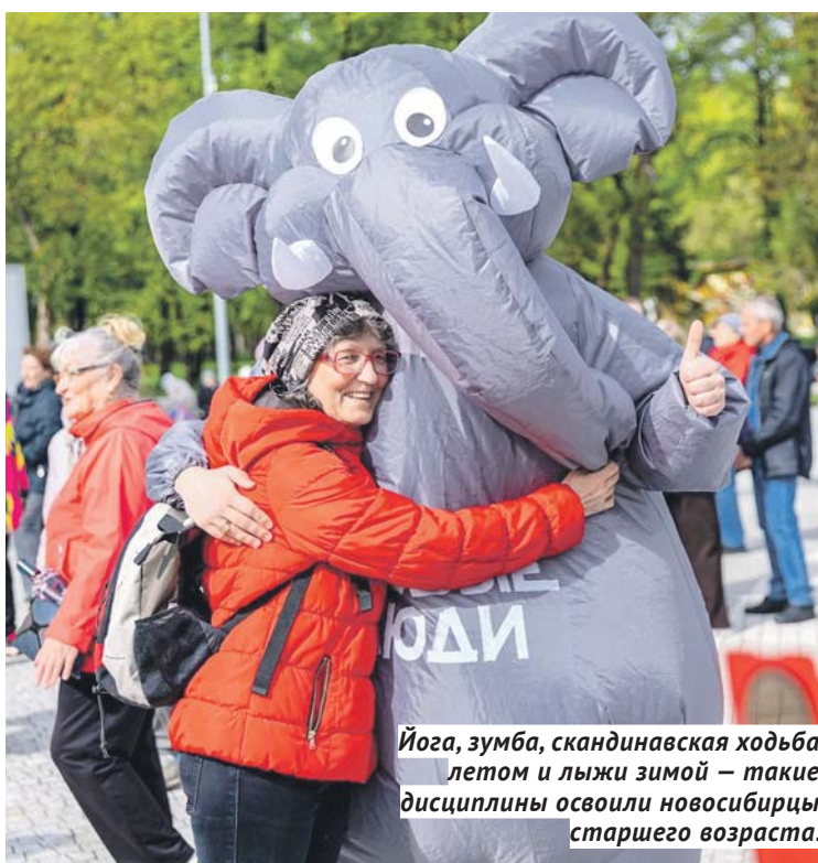
Йога, зумба, скандинавская ходьба летом и лыжи зимой — такие дисциплины освоили новосибирцы старшего возраста.

Программу активного долголетия «Жить по-новому» партия «Новые люди» запустила осенью прошлого года. Она помогает людям старшего поколения найти новые возможности для творчества и общения.