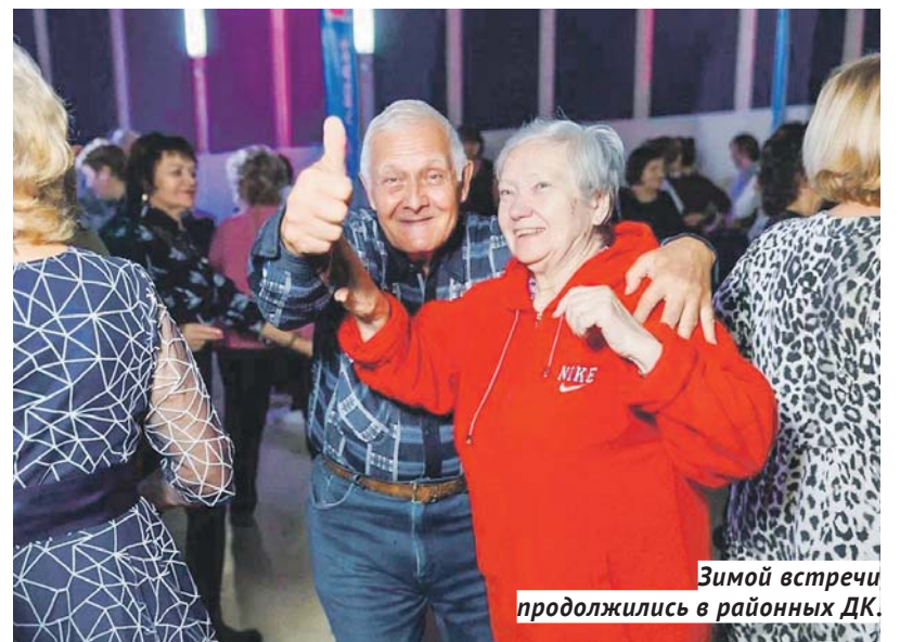
Зимой встречи продолжились в районных ДК.