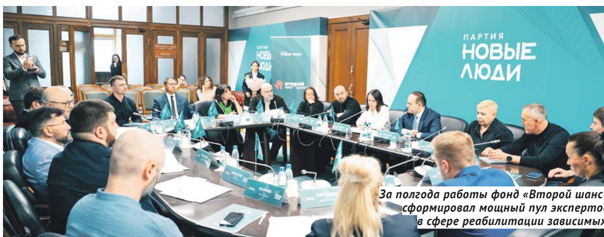
За полгода работы фонд «Второй шанс» сформировал мощный пул экспертов в сфере реабилитации зависимых.