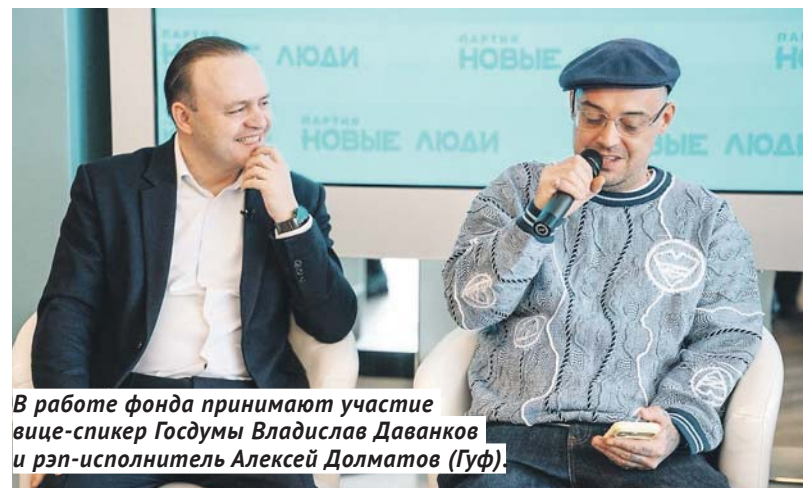
В работе фонда принимают участие вице-спикер Госдумы Владислав Даванков и рэп-исполнитель Алексей Долматов (Гуф) .