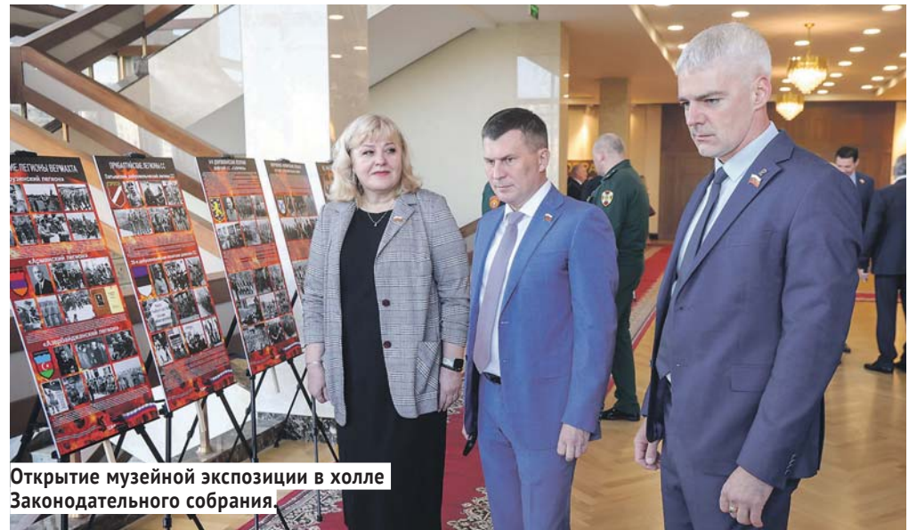
Открытие музейной экспозиции в холле Законодательного собрания.

Ещё одно очень важное направление — реализация нового национального проекта «Продолжительная и активная жизнь», целью которого является обеспечение увеличения к 2030 году доли граждан, ведущих здоровый образ жизни, в 1,5 раза. В рамках проекта заложены программы по профилактике неинфекционных заболеваний и трансформация центров здоровья для взрослых в центры медицины здорового долголетия для популяризации здорового образа жизни. Основными направлениями здесь являются совершенствование нормативной базы укрепления общественного здоровья и медицинской профилактики, а также создание эффективной индивидуальной профилактики, работа с факторами риска, приближение методов профилактики заболеваний к рабочему месту и так далее.