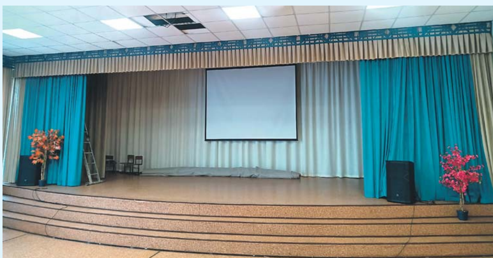
Для актового зала школы №131 приобрели оконные и кулисные шторы.