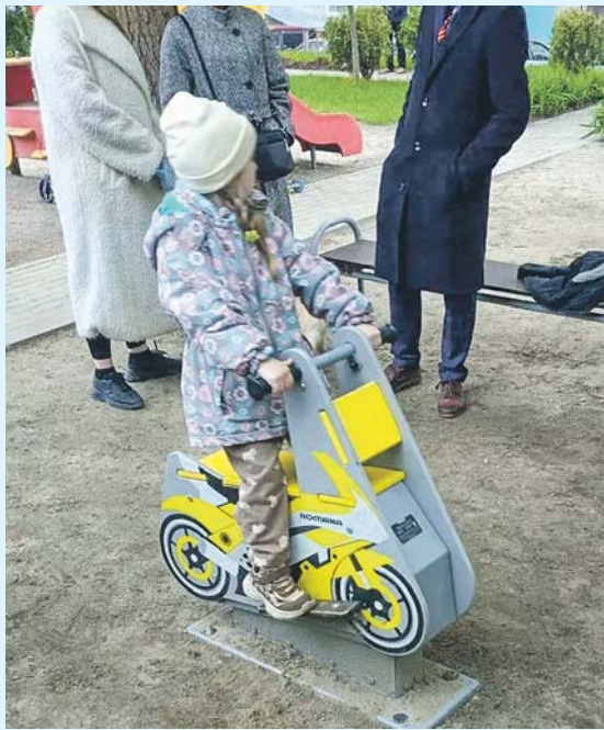
Новые детские элемен- ты поя- вились во дворе дома на Вокзаль- ной ма- гистрали, 5.