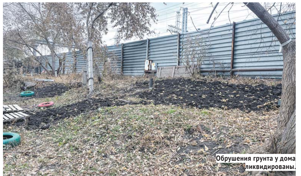
Обрушения грунта у дома ликвидированы.

Пока решали вопрос с подрядчиками, во дворе дома сложилась аварийная ситуация: из-за проводимых работ на сетях РЖД грунт на придомовой территории стал существенно проседать. Образовались обвалы и обрушения, превратившие двор в зону повышенной опасности, особенно для детей, поскольку