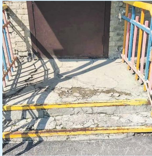
Так выглядело крыльцо детского сада №1 до ремонта...