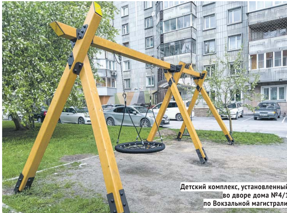
Детский комплекс, установленный во дворе дома №4/1 по Вокзальной магистрали.

В 2025 году при поддержке депутата Антона Тыртышного на территории округа были проведены следующие работы.