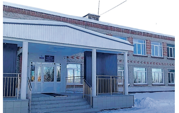
Школа в Новом Шарапе приняла учеников в ноябре 2025 года.