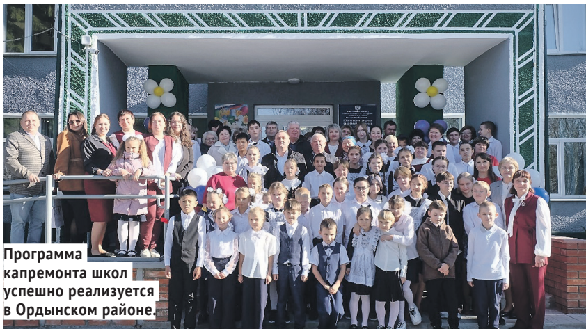
Программа капремонта школ успешно реализуется в Ордынском районе.