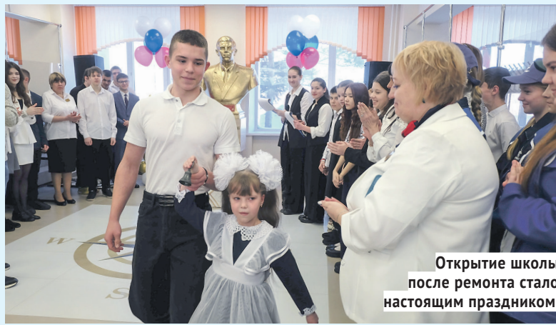
Открытие школы после ремонта стало настоящим праздником.

Ремонт школы выполнен по федеральному проекту «Всё лучшее — детям», входящему в нацпроект «Молодёжь и дети».