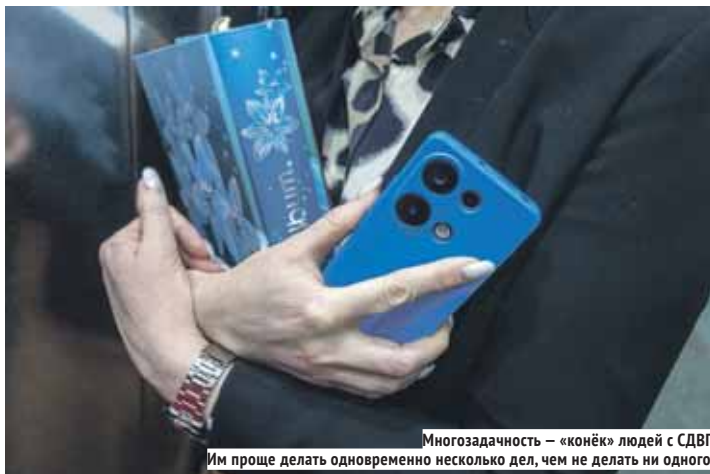
Многозадачность — «конёк» людей с СДВГ. Им проще делать одновременно несколько дел, чем не делать ни одного.