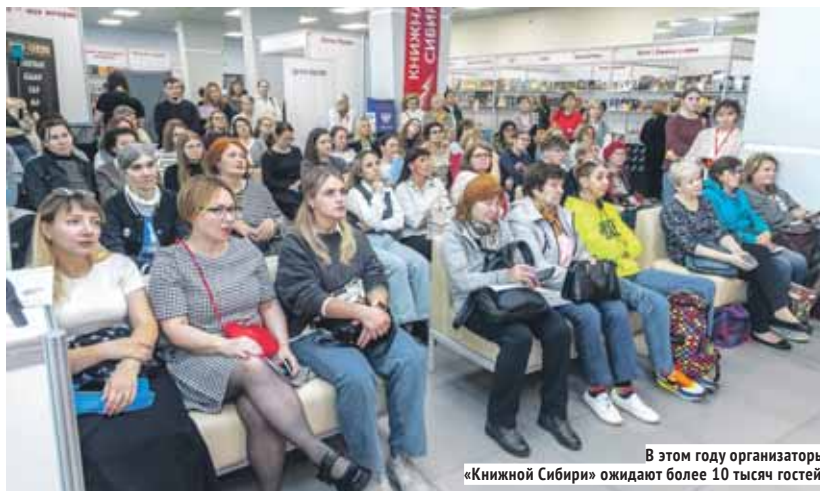
В этом году организаторы «Книжной Сибири» ожидают более 10 тысяч гостей.

Встречи с писателями, мастер-классы с иллюстраторами, лекции и книги от более чем 100 издательств России. Фестиваль «Книжная Сибирь» пройдёт 21–23 ноября.