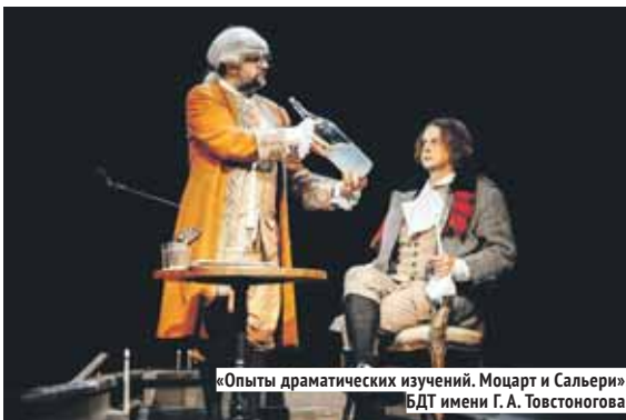
«Опыты драматических изучений. Моцарт и Сальери». БДТ имени Г. А. Товстоногова.