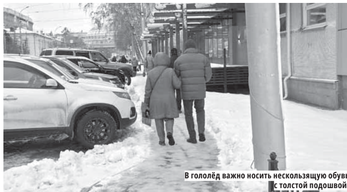
В гололёд важно носить нескользящую обувь с толстой подошвой.

Специалисты регионального управления Роспотребнадзора дали советы, что делать, если падение всё же произошло: