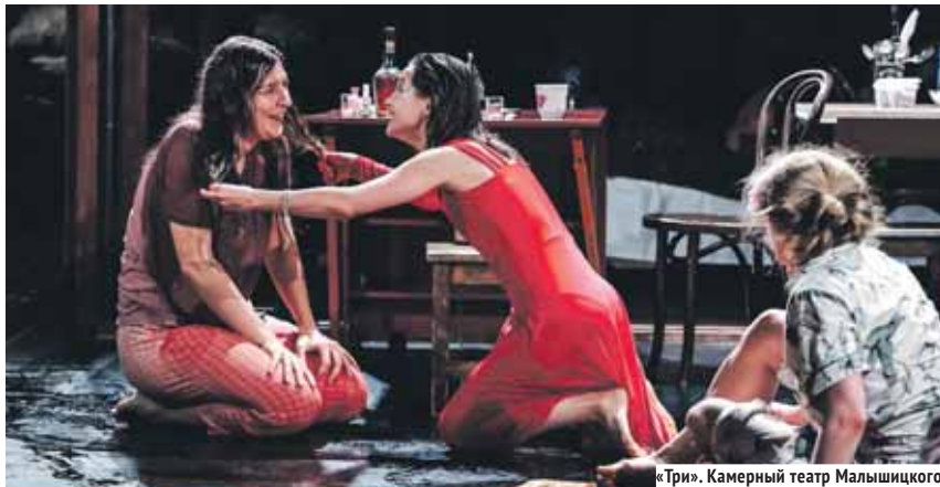
«Три». Камерный театр Малышицкого.