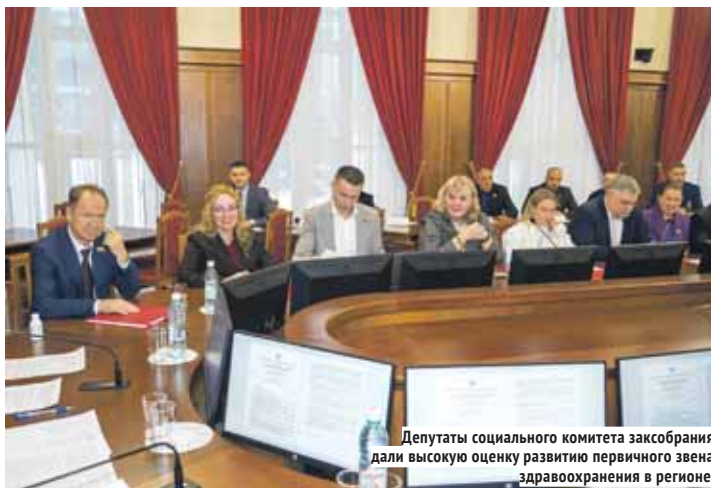
Депутаты социального комитета заксобраний дали высокую оценку развитию первичного звена здравоохранения в регионе.