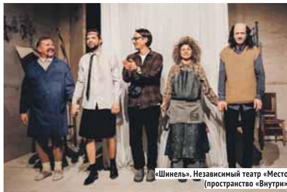
«Шинель». Независимый театр «Место» (пространство «Внутри»).