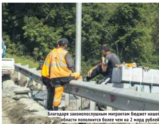
Благодаря законопослушным мигрантам бюджет нашей области пополнится более чем на 2 млрд рублей.

По данным министерства труда и социального развития Новосибирской области, количество официально зарегистрированных в нашем регионе мигрантов неуклонно растёт: если в 2022 году их было более 48 тысяч человек, то в нынешнем — уже более 58,3 тысячи человек. И большинство из них предпочитают не только официально регистрироваться, но и работать, приобретая