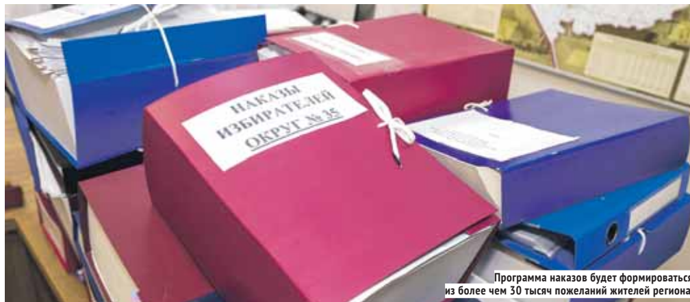
Программа наказов будет формироваться из более чем 30 тысяч пожеланий жителей региона.