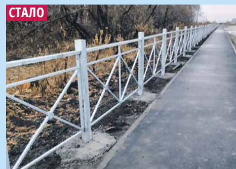
Устройство тротуара в селе Решеты Кочковского района.