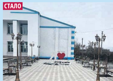
Ремонт ДК в селе Лагушье Купинского района.