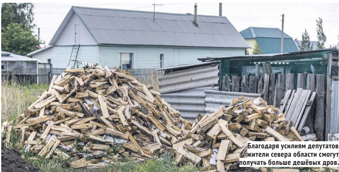
Благодаря усилиям депутатов жители севера области смогут получать больше дешёвых дров.