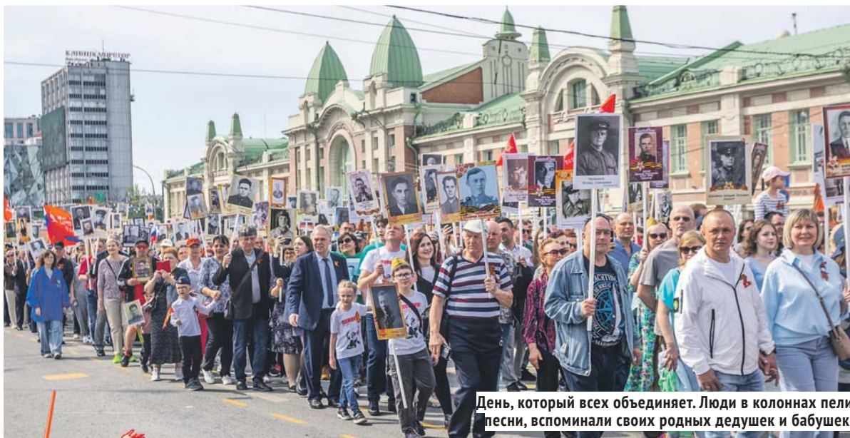
День, который всех объединяет. Люди в колоннах пели песни, вспоминали своих родных дедушек и бабушек.