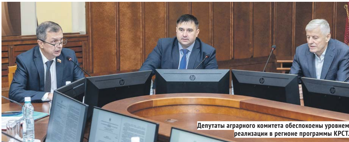
Депутаты аграрного комитета обеспокоены уровнем реализации в регионе программы КРСТ.

Новосибирская область весьма уверенно стартовала в программе КРСТ, даже с учётом того, что заявки поступали и утверждались максимум от четверти из 30 сельских районов.