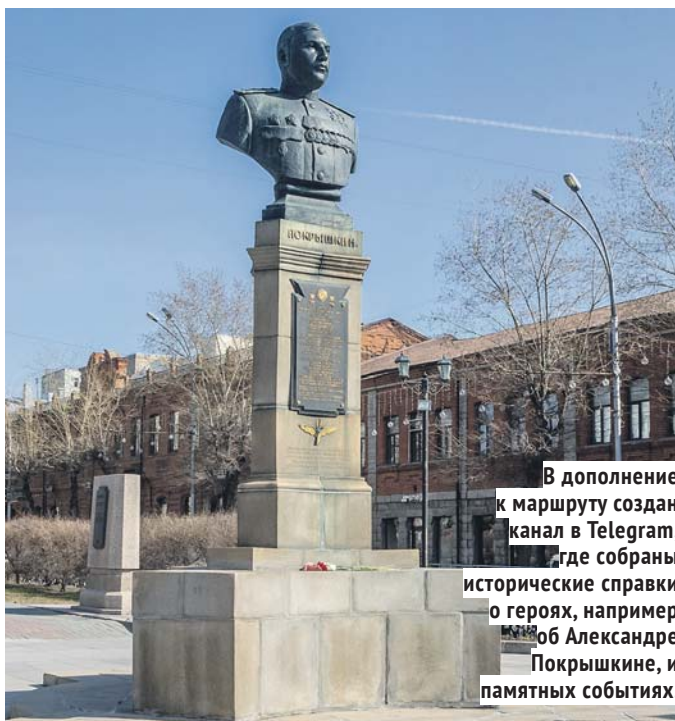
В дополнение к маршруту создан канал в Telegram, где собраны исторические справки о героях, например об Александре Покрышкине, и памятных событиях.

полную и достоверную информацию о памятных местах города, указанных в маршруте, вместе с родителями сходили в ГПНТБ и подготовились, — сказал школьник. — Чат-ботом воспользоваться несложно, каждый справится. Прогулка стартует с кнопки «Начать». Далее бот показывает вам первую точку маршрута, например, скульптуру или памятник. Вы идёте, затем нажимаете кнопку «Пришли» и получаете задание, связанное с этим местом. Выполняете его: отвечаете на вопрос, разгадываете загадку или ищете деталь на объекте. После правильного ответа бот расскажет вам интересную информацию об этом месте и покажет следующую точку маршрута. Да, если затрудняетесь с ответом, можно воспользоваться подсказкой. Это тоже предусмотрено.