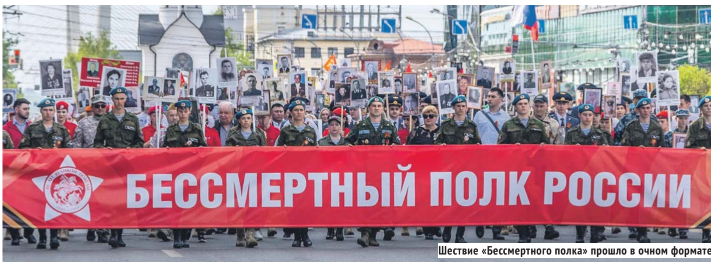
Шествие «Бессмертного полка» прошло в очном формате.

А в 10 часов на площади Ленина начался военный парад войск Новосибирского гарнизона, организованный 41-й общевойсковой армией: проехали колонны военной техники, в синем небе пролетели два истребителя, торжественным маршем прошли курсанты и юнармейцы.