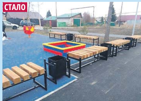
Благоустройство общественного пространства в селе Верх-Тула Новосибирского района.

сяч (покупка сценических костюмов для ДК деревни Алексеевка Здвинского района) до почти 6 млн рублей (организация дорожного движения в селе Марусино Новосибирского района).