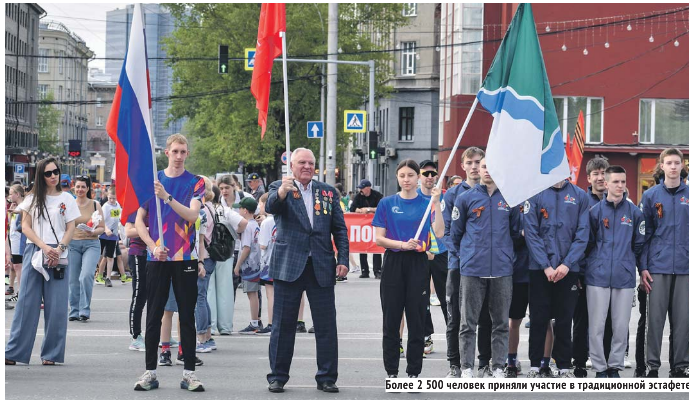
Более 2 500 человек приняли участие в традиционной эстафете.

Вера МАКСИМОВА