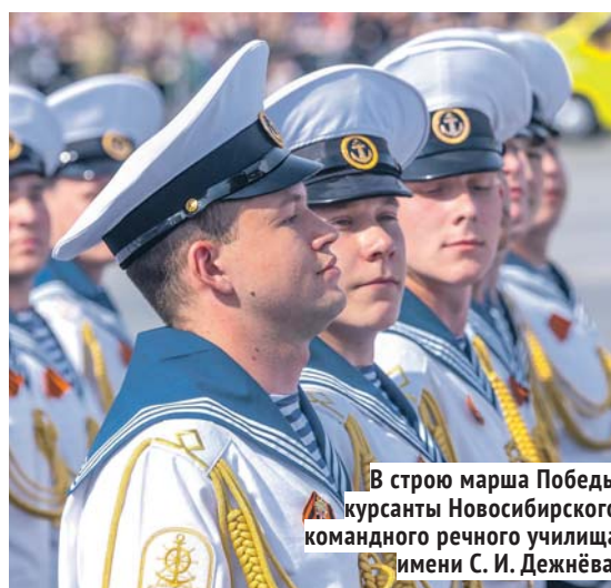
В строю марша Победы курсанты Новосибирского командного речного училища имени С. И. Дежнёва.