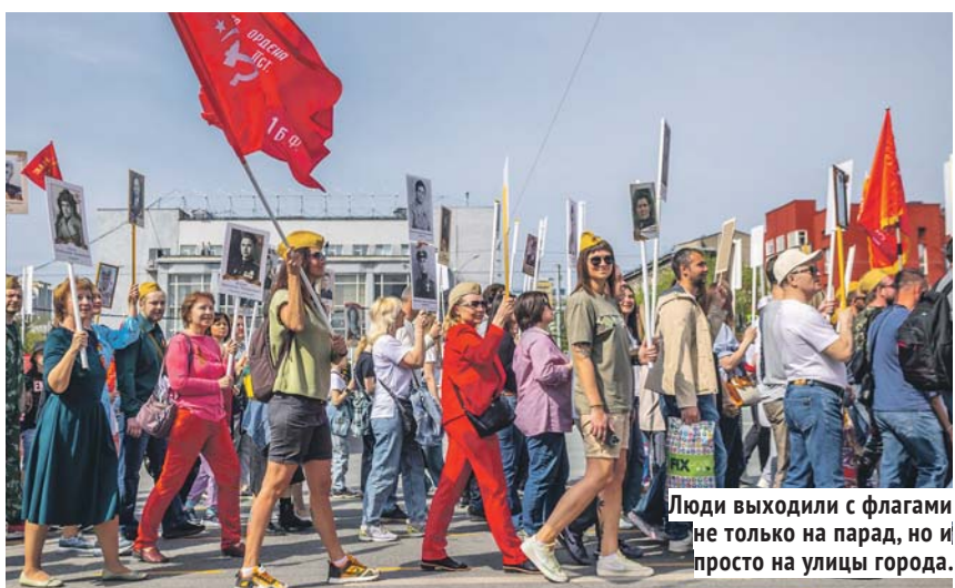
Люди выходили с флагами не только на парад, но и просто на улицы города.