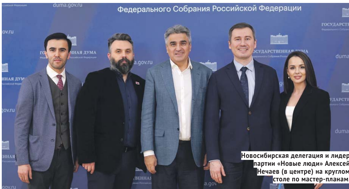
Новосибирская делегация и лидер партии «Новые люди» Алексей Нечаев (в центре) на круглом столе по мастер-планам.

Беспилотники — лишь один из примеров. Ещё в большей степени перемены касаются искусственного интеллекта, нейросетей. Они в корне меняют представление о большинстве профессий. К изменениям