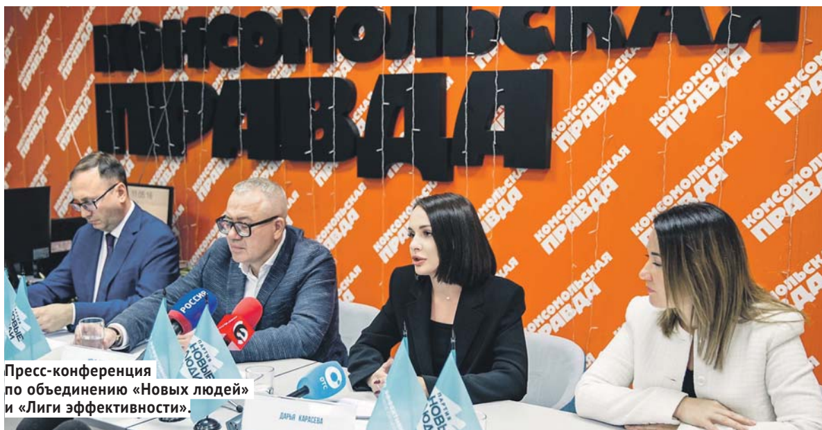
Пресс-конференция по объединению «Новых людей» и «Лиги эффективности».

нужно готовиться уже сегодня, причём всем. Медицина, образование, государственное управление изменятся под влиянием искусственного интеллекта не меньше, чем предпринимательство. Один из лидеров «Новых людей» Владислав Даванков говорит, что уже сейчас можно заменить треть чиновников на ИИ. Качество управления от этого не пострадает.