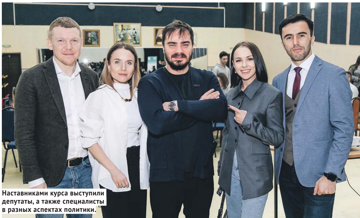
Наставниками курса выступили депутаты, а также специалисты в разных аспектах политики.

Узнать больше об образовательном курсе «Дело в политике» и присоединиться к нему можно по ссылке: vk.com/delovpolitikensk