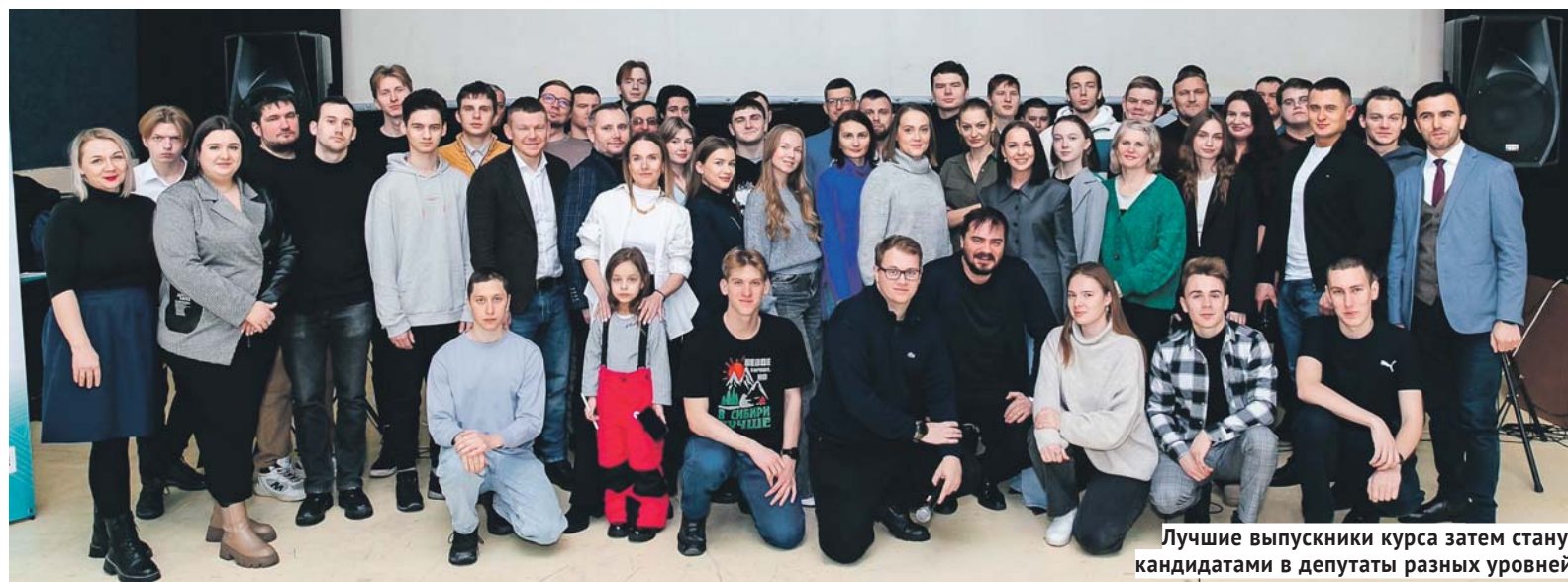
Лучшие выпускники курса затем станут кандидатами в депутаты разных уровней.