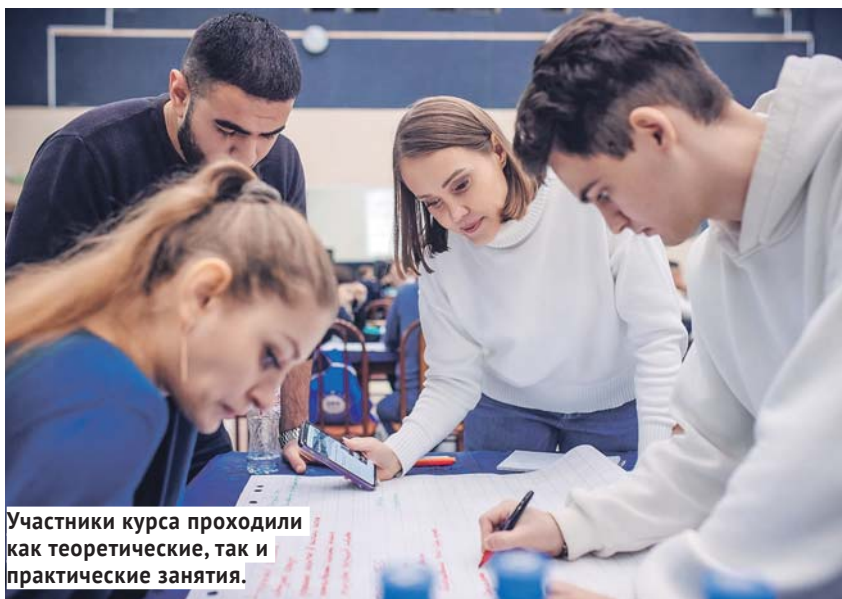
Участники курса проходили как теоретические, так и практические занятия.

80 новосибирцев стали выпускниками первой волны обучения курса «Дело в политике». Часть из них станут кандидатами в депутаты от «Новых людей».