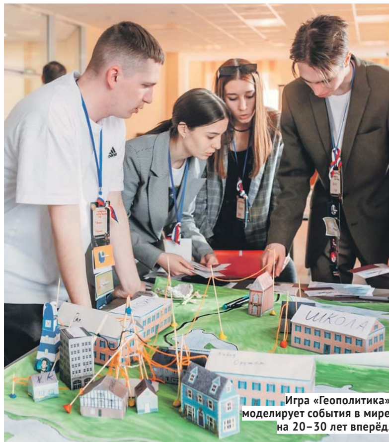
Игра «Геополитика» моделирует события в мире на 20–30 лет вперёд.

Это настоящий пример ответственного подхода к работе.