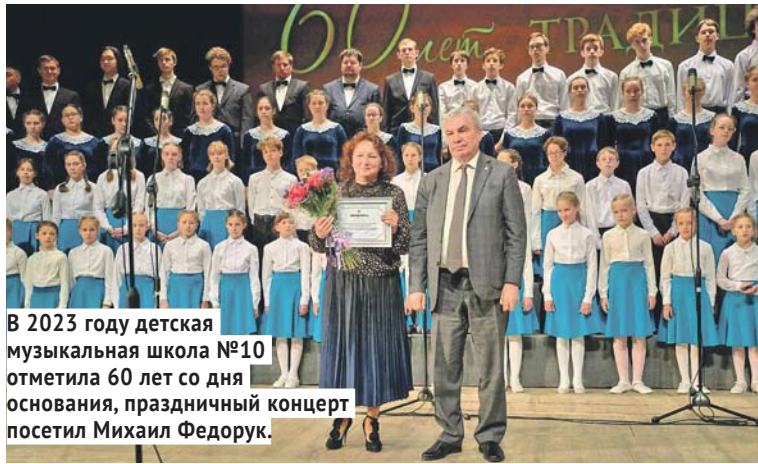
В 2023 году детская музыкальная школа №10 отметила 60 лет со дня основания, праздничный концерт посетил Михаил Федорук.

— Я каждый день прохожу мимо стройки и слежу за ходом работ. Коллектив преподавателей на деле доказал, что достоин такого подарка. Музыкальная