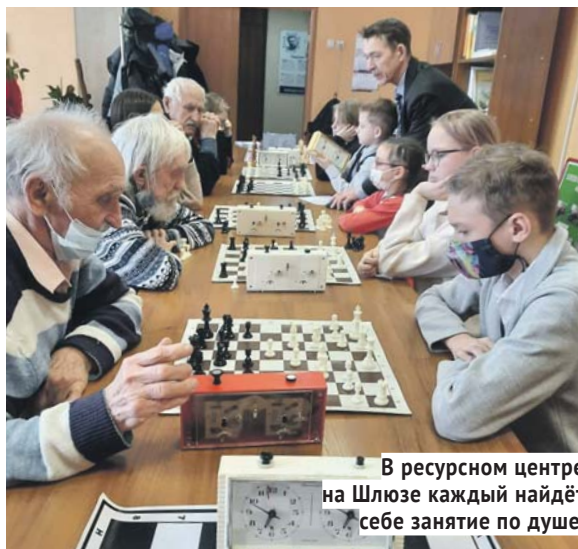
В ресурсном центре на Шлюза каждый найдёт себе занятие по душе.

«От общих проблем — к совместным действиям» — девиз всех неравнодушных людей.