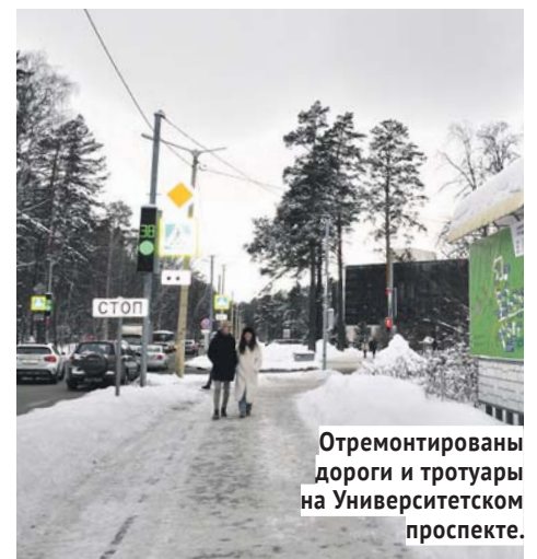
Отремонтированы дороги и тротуары на Университетском проспекте.

го сада №320, на улицах Строителей, Терешковой, Русская, Балтийская, Тружеников, Жемчужная, Иванова, Бульвар Молодёжи, Героев Труда. Резиновым покрытием оборудована детская площадка на улице Тружеников, 5.