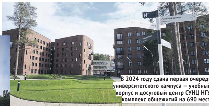
В 2024 году сдана первая очередь университетского кампуса — учебный корпус и досуговый центр СУНЦ НГУ, комплекс общежитий на 690 мест.

Ещё один проект — суперкомпьютерный центр «Лаврентьев», первая очередь которого уже запущена и позволяет решать научно-исследовательские и прикладные задачи в работе с большими языковыми моделями и генеративным искусственным интеллектом. Сегмент вычислительного кластера по вычислительным мощностям в 360 терафлопс (триллионов