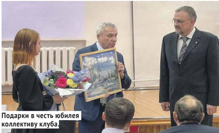
Подарки в честь юбилея коллективу клуба.

— Я и сам был воспитанником клуба, посещал кружок астрономии. И по сей день КЮТ остаётся актуальным. Академгородок сейчас активно развивается. Я хочу пожелать Клубу юных техников и дальше идти в ногу со временем, а мы ему окажем в этом всяческую поддержку.