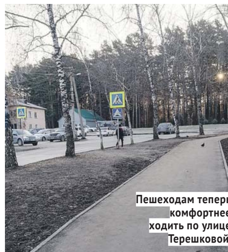
Пешеходам теперь комфортнее ходить по улице Терешковой.