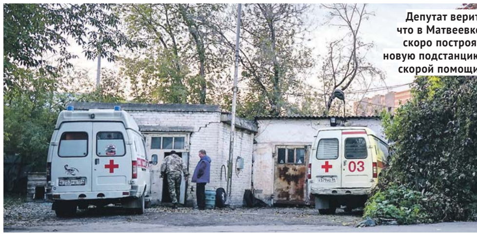
Депутат верит, что в Матвеевке скоро построят новую подстанцию скорой помощи.

— Сейчас глобально проблема одна — нет подтверждённого финансирования на 2025 год. Есть проектно-сметная документация, прошедшая экспертизу, есть готовый участок, по сути, нужно только «поставить» финансирование, провести торги и запустить подрядчика на стройплощадку. При утверждении в заксобрании бюджета на 2025–2027