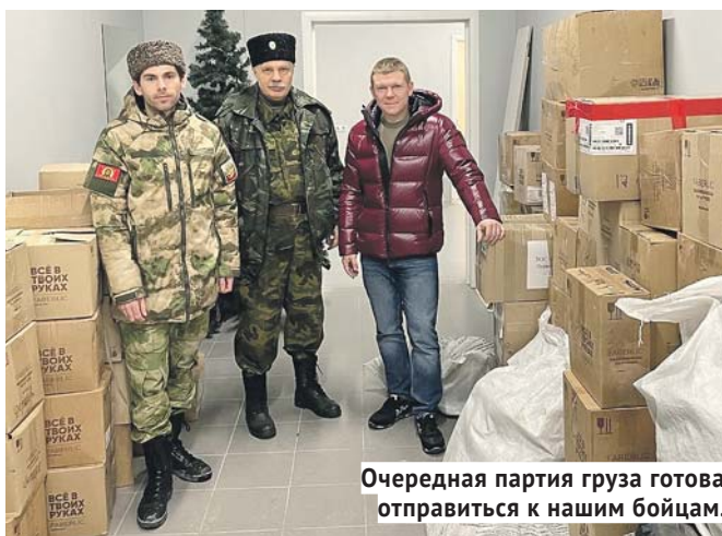
Очередная партия груза готова отправиться к нашим бойцам.

осени того же года, когда мы столкнулись с непрекращающимся потоком средств как от предпринимательского сообщества, так и от жителей Новосибирска и области, фонд был официально зарегистрирован.