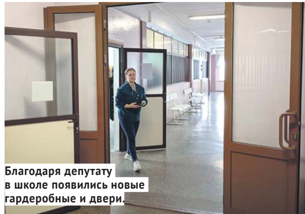
Благодаря депутату в школе появились новые гардеробные и двери.