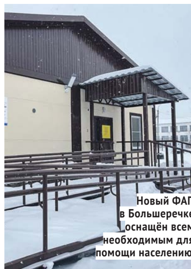
Новый ФАП в Большеречке оснащён всем необходимым для помощи населению.

Приятным событием для Болотнинского района в рамках исполнения наказов стало открытие новых, современных фельдшерско-акушерских пунктов, ставших настоящим подарком для людей, проживающих в глубинке. В деревнях Большая Чёрная и Большеречка появились красивые, уютные здания, соответствующие всем санитарно-гигиеническим требованиям. В медпунктах размещено всё необходимое оборудование, обустроены кабинеты для персонала и приёма посетителей. Теперь жители деревень будут получать медицинскую помощь в комфортных условиях.