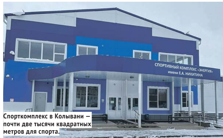
Спорткомплекс в Колывани — почти две тысячи квадратных метров для спорта.