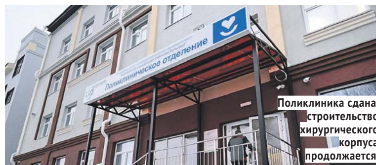
Поликлиника сдана, строительство хирургического корпуса продолжается.

«Объекты, действительно, долгожданные, как и любой объект социальной сферы, качественно повышающий уровень жизни населения. Строительство по-