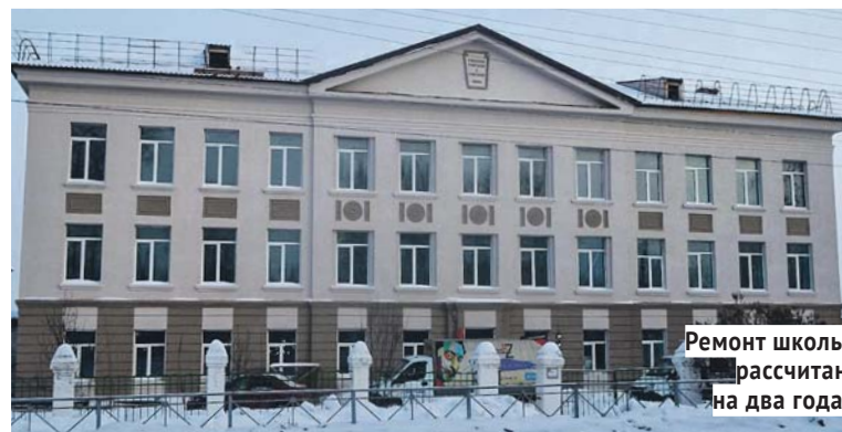
Ремонт школы рассчитан на два года.

ликлиники проходило в рамках реализации нацпроекта «Здравоохранение» и находилось на контроле губернатора, — рассказал депутат. — Неоднократно я сам посещал объект. Были замечания по выполнению работ, но благода-