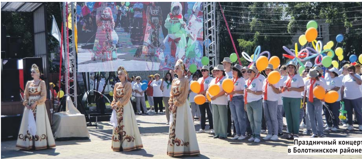
Праздничный концерт в Болотнинском районе.

муниципальным образованием достопримечательностей и продукции, производимой на своей территории.