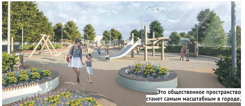
Это общественное пространство станет самым масштабным в городе.

Радуется, что в последние годы благоустройству малых территорий федеральные и региональные власти уделяют большое внимание, а главы муниципальных районов активно включаются в реализацию программ и конкурсов по этому направлению. Часто посещая