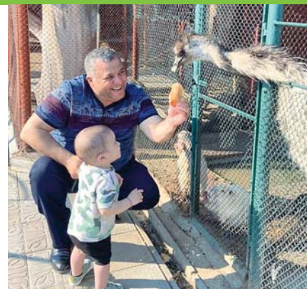
Внук Шакира Ибадетовича знает, что с дедушкой всегда интересно.