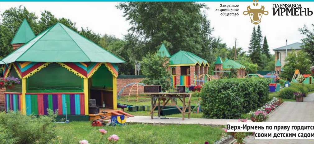
Верх-Ирмень по праву гордится своим детским садом.