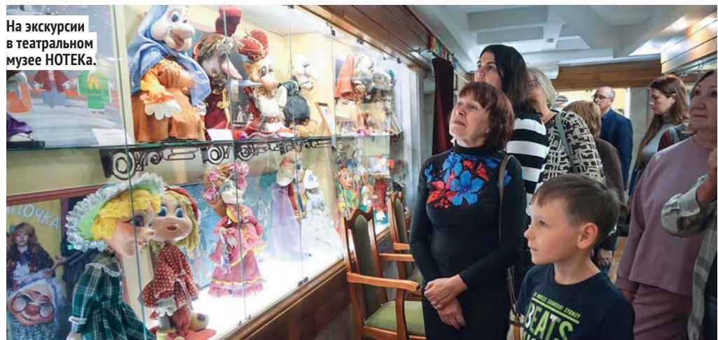
На экскурсии в театральном музее НОТЕКа.

Это «Репка», «Колобок», «Теремок», «Три медведя», «Любимые игрушки» по стихам Агнии Барто, «Заюшкина избушка» и другие спектакли. Самые первые сказки помогают юным зрителям узнать о том, как устроен мир, кто живёт рядом, как общаться и дружить. Так закладываются самые основы культурного кода в контексте культуры народов России и её ценностей.