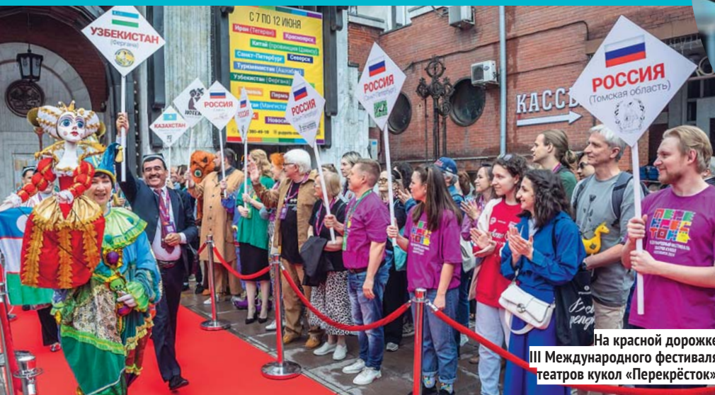
На красной дорожке III Международного фестиваля театров кукол «Перекрёсток».