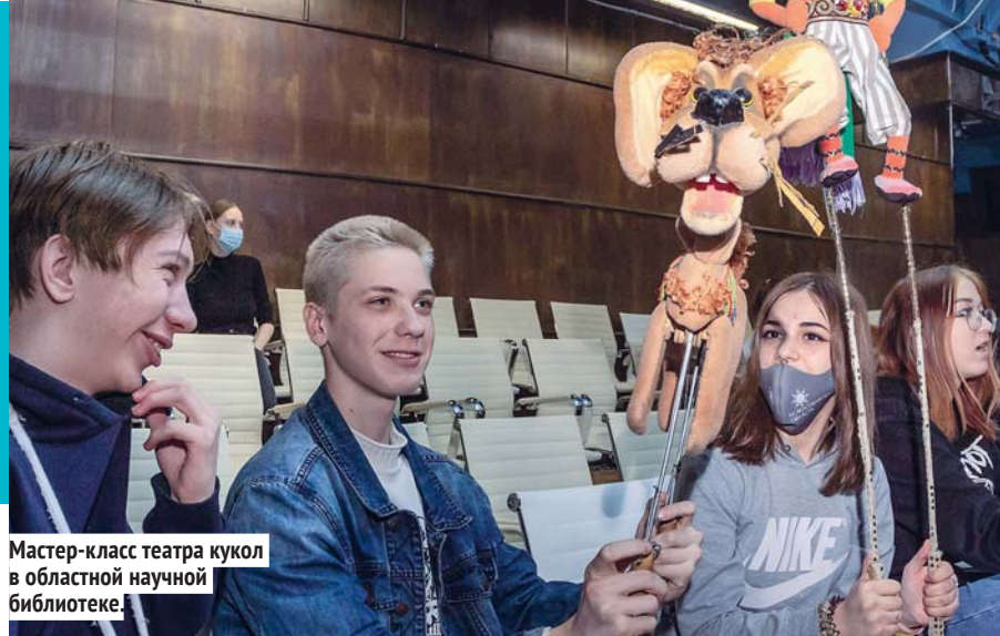
Мастер-класс театра кукол в областной научной библиотеке.

Литературной основой для репертуарных спектаклей служат классические произведения и современные пьесы, продолжающие темы культурного кода России. Так, в 2023 году зрители увидели шесть новых спектаклей, среди них — «Мойдодыр» по сказке Корнея Чуковского, «Про Ёжика и Медвежонка» по мотивам философских сказок Сергея Козлова, «Ревизор» по пьесе Николая Гоголя, «Удивительный полёт к звёздам» о новосибирском космонавте Анне Кикиной. Всего в прошлом году театр провёл 1 366 мероприятий с общим количеством зрителей почти 120 тысяч человек. Это показы спектаклей в самом театре и на других площадках, гастрольные поездки по области, мастер-классы, экскурсии, участие в городских событиях. Среди премьер этого года — «Гадкий