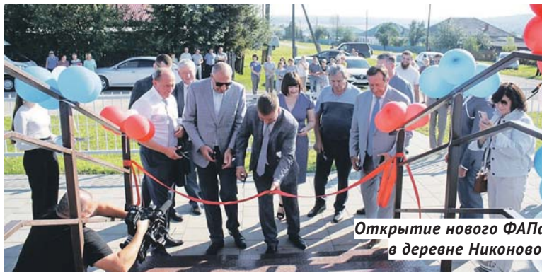
Открытие нового ФАПа в деревне Никоново.

Быстро и качественно модульный пункт построен работниками ООО «МирР»: было не только готово здание ФАПа, но и благоустроена территория вокруг него.