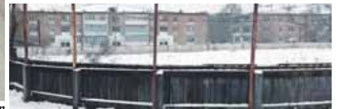
В посёлке Керамкомбинат появится новая хоккейная коробка.