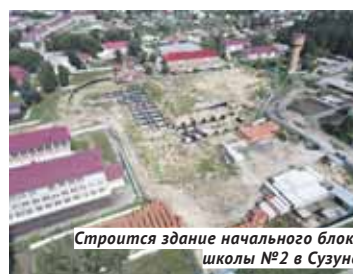
Строится здание начального блока школы №2 в Сузуне.