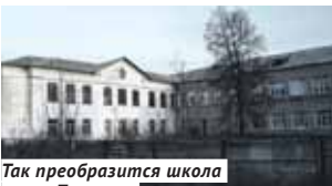
Так преобразится школа в р. п. Посевная.