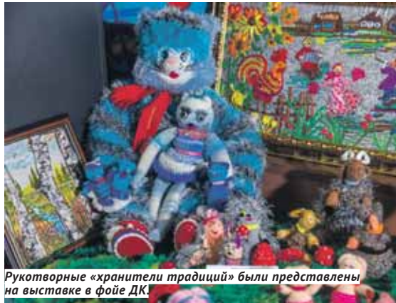
Рукотворные «хранители традиций» были представлены на выставке в фойе ДК.