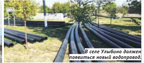
В селе Ульбино должен появиться новый водопровод.