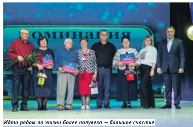
Идти рядом по жизни более полувека — большое счастье.