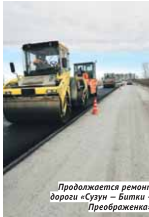
Продолжается ремонт дороги «Сузун — Битки — Преображенка».