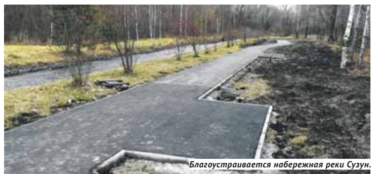
Благоустраивается набережная реки Сузун.