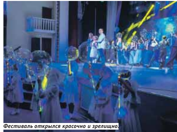
Фестиваль открылся красочно и зрелищно.