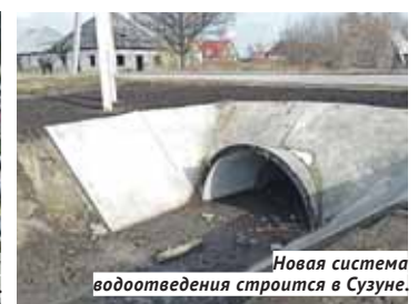
Новая система водоотведения строится в Сузуне.