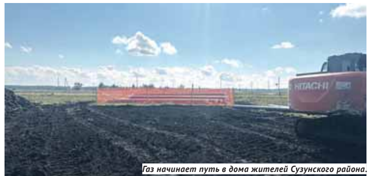
Газ начинает путь в дома жителей Сузунского района.