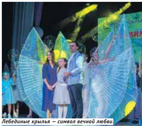
Лебединые крылья — символ вечной любви.