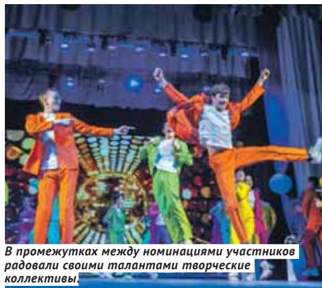
В промежутках между номинациями участники радовали своими талантами творческие коллективы.