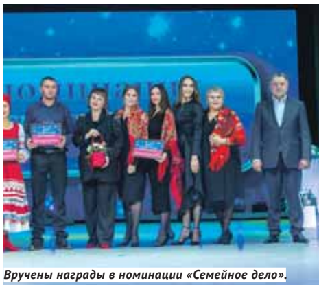
Вручены награды в номинации «Семейное дело».