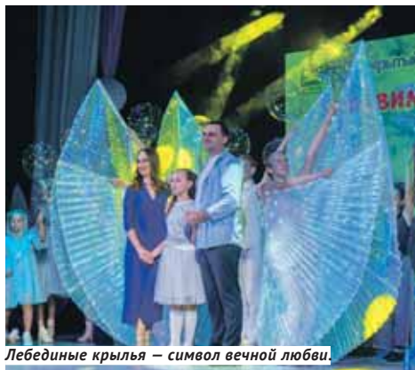
Лебединые крылья — символ вечной любви.