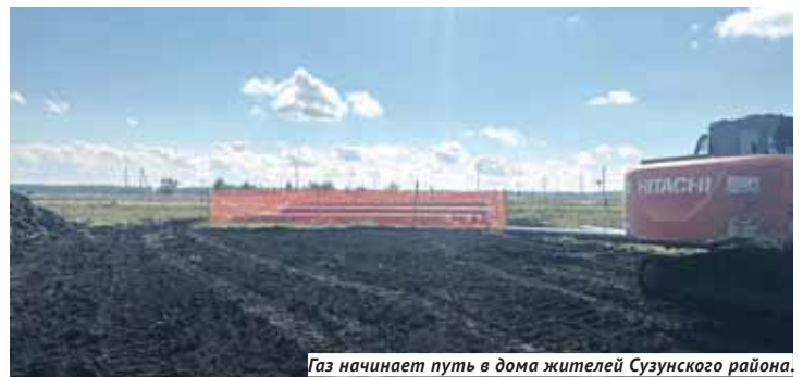
Газ начинает путь в дома жителей Сузунского района.