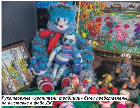
Рукотворные «хранители традиций» были представлены на выставке в фойе ДК.