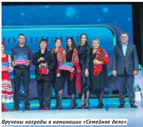
Вручены награды в номинации «Семейное дело».