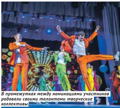
В промежутках между номинациями участники радовали своими талантами творческие коллективы.