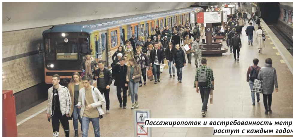
Пассажиропоток и востребованность метро растут с каждым годом.

и со стороны муниципалитета будет достаточно ресурсов для софинансирования проектных работ. Новый мэр Новосибирска — человек молодой, амбициозный, и мне понравилось, что в