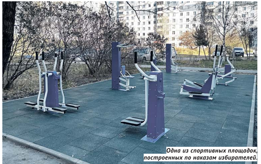
Одна из спортивных площадок, построенных по наказам избирателей.

— Совпадением это точно не назовёшь, ведь ещё с начала 1990-х я работал сначала первым заместителем, а затем главой Ленинского района, возглавлял профильный департамент энергетики и ЖКХ в мэрии Новосибирска, затем в администрации области курировал это направление, поэтому я, что называется, настолько «в теме», как мало кто в городе. И действительно, коммунальных аварий такого масштаба в Новосибирске не было почти три десятилетия, потому что даже в те трудные 1990-е, при фактическом отсутствии ресурсов в бюджете и у эксплуатирующих организаций, к прохождению отопительного сезона готовились более ответственно и основательно. А причиной моего, как вы сказали, жёсткого выступления стали два основных фактора. Во-первых, частный разговор с одним из бывших городских чиновников в сфере ЖКХ, который чуть ли не открытым текстом заявил, что неважно — делаем мы что-то или нет, 5-го числа каждого месяца зарплата на карточку всё равно приходит. Меня покорила не только эта «откровенность», но и неприкрытая расслабленность и уверенность, что ещё какое-то время удастся прожить на старом багаже. Как видим — не получилось!