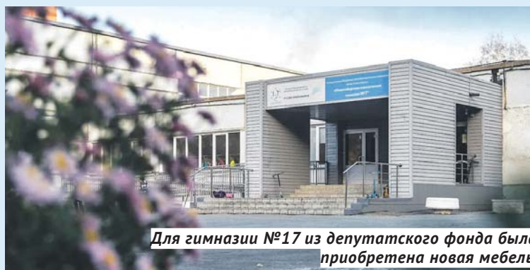
Для гимназии №17 из депутатского фонда была приобретена новая мебель.