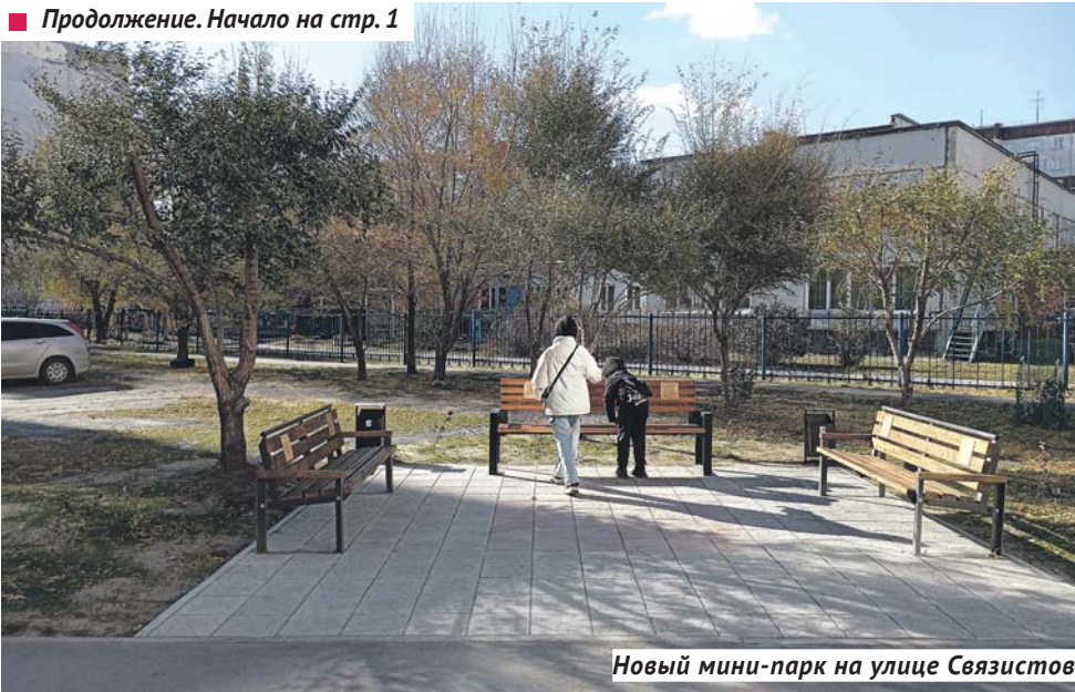
Новый мини-парк на улице Связистов.