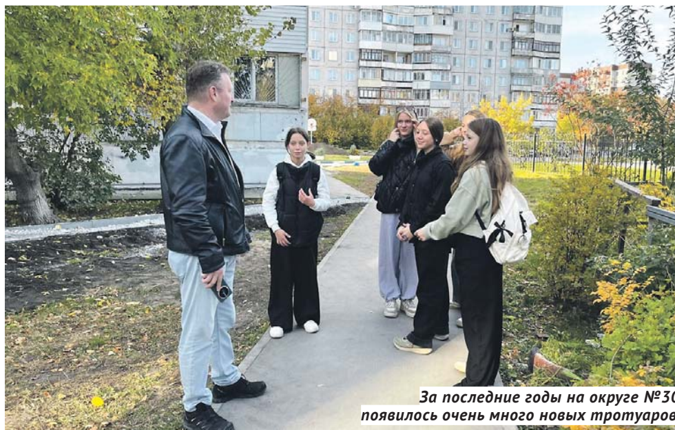
За последние годы на округе №30 появилось очень много новых тротуаров.