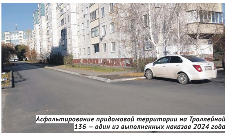
Асфальтирование придомовой территории на Троллейной, 136 — один из выполненных наказов 2024 года.

— Моё предложение, по целому ряду причин не очень популярное, — построить вблизи города атомную станцию. В принципе, при наличии тепловых сетей, электрических сетей и хорошего водного источника поставить одну станцию хорошей энергопрочности будет оптимальным выходом из ситуации. Ведь строят же объект четвёртого поколения в Томской области, почему мы не можем? Понятно, что вопрос сложный и политически, и экономически, но в перспективе, если мы хотим красивый город с чистым воздухом и удобством проживания, подобный энергоисточник необходимо проектировать. Или, по крайней мере, начинать лоббировать вопрос на федеральном уровне, потому что без государства здесь однозначно не справиться. Это правильно, потому что у государства функций больше, чем у правительства на территории отдельного региона или муниципалитета, даже такого, как Новосибирск. Сейчас моё предложение может казаться утопией, проблемой, не имеющей решения. Но в этом и состоит суть жизни: любые проблемы должны трансформироваться в задачи, а любая задача должна иметь несколько решений. Вот и всё... И этот принцип работает как в масштабах округа, где проживает несколько десятков тысяч человек, так и на уровне региона. Я полагаю, даже знаю, что у нас достаточно опытный губернатор, профессиональное правительство, новая интересная команда формируется в мэрии Новосибирска. И если мыслить смело и стратегически, то любые проблемы преодолимы, а самые сложные задачи — решаемы.