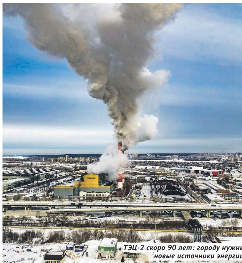
ТЭЦ-2 скоро 90 лет: городу нужны новые источники энергии.

— Впереди ещё долгая зима, и не хотелось бы забегать вперёд, но, на первый взгляд, кажется, что определённые уроки были усвоены. Когда в начале октября 2024 года произошёл прорыв магистральной трубы диаметром 700 миллиметров на улице Петропавловская (кстати, совсем недалеко от места январской аварии), дефект устранили за 12 часов. Потом, правда, ещё где-то две недели выходили на нормальные параметры отопления по отдельным домам, но это уже нюансы. В плюс надо добавить, что в целом более оперативно стали устранять дефекты и небольшие аварии на тепловых сетях и восстанавливать благоустройство прилегающих территорий. Повторюсь — пока рано судить о качестве подготовки к отопительному сезону в целом, но какие-то ускоренные курсы повышения профессионального мастерства и в снабжающих организациях, и в управляющих компаниях, похоже, были проведены.