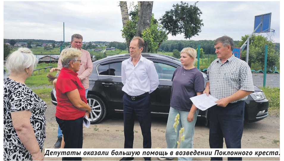
Депутаты оказали большую помощь в возведении Поклонного креста.