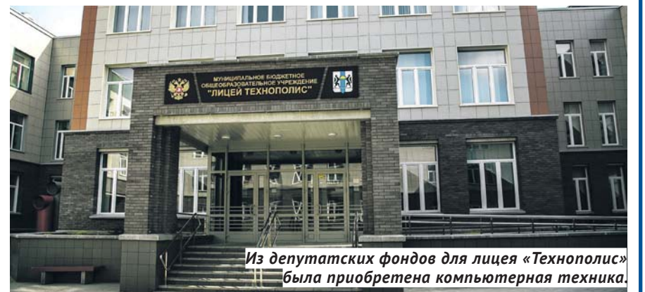
Из депутатских фондов для лицея «Технополис» была приобретена компьютерная техника.