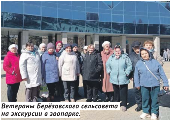
Ветераны Берёзовского сельсовета на экскурсии в зоопарке.