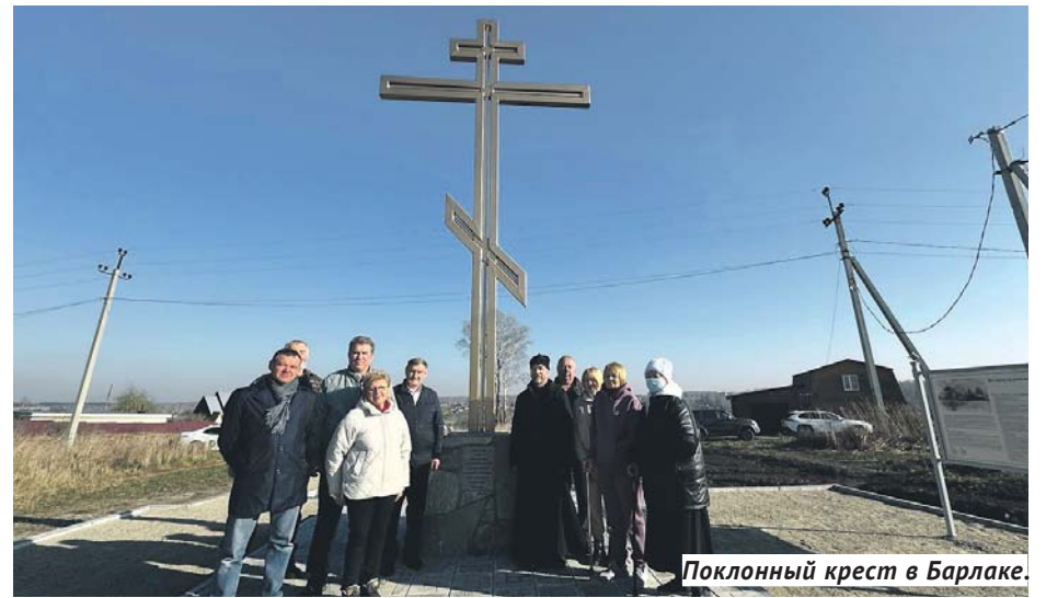
Поклонный крест в Барлаке.