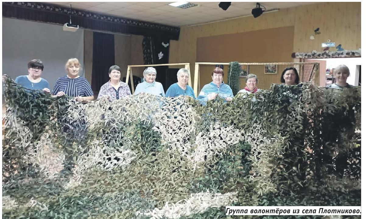
Группа волонтеров из села Плотниково.