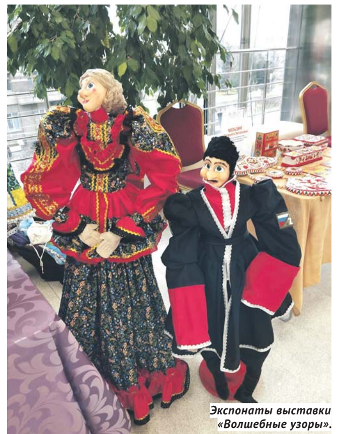
Экспонаты выставки «Волшебные узоры».

И вот свет в зале погас, и на сцене развернулось яркое, завораживающее действие. Хороводы и заливчатские танцы сменялись задорными песнями, яркими номерами ансамбля гармонистов и ансамбля ударных инструментов. А театры мод из Хакасии, Тывы и Якутии, казалось, погрузили зрителей в неземной мир! Невозможно было оторвать глаз от великолеп-