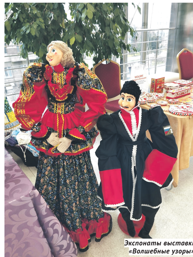
Экспонаты выставки «Волшебные узоры».

И вот свет в зале погас, и на сцене развернулось яркое, завораживающее действие. Хороводы и заливчатские танцы сменялись задорными песнями, яркими номерами ансамбля гармонистов и ансамбля ударных инструментов. А театры мод из Хакасии, Тывы и Якутии, казалось, погрузили зрителей в неземной мир! Невозможно было оторвать глаз от великолеп-