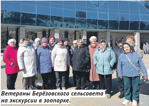
Ветераны Берёзовского сельсовета на экскурсии в зоопарке.