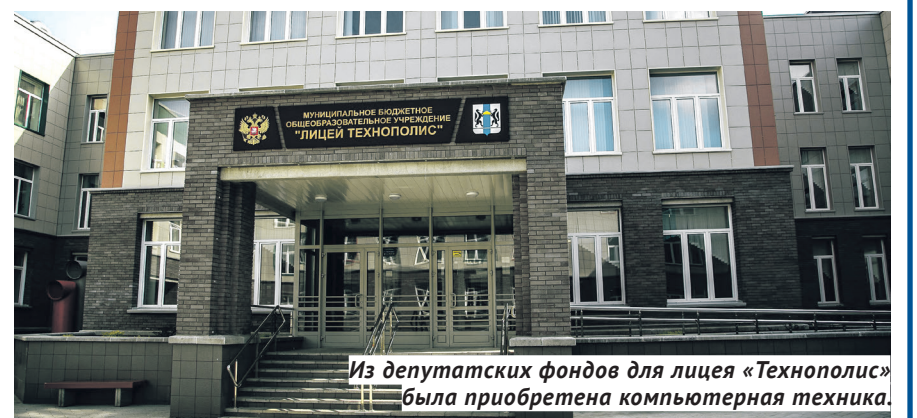
Из депутатских фондов для лицея «Технополис» была приобретена компьютерная техника.