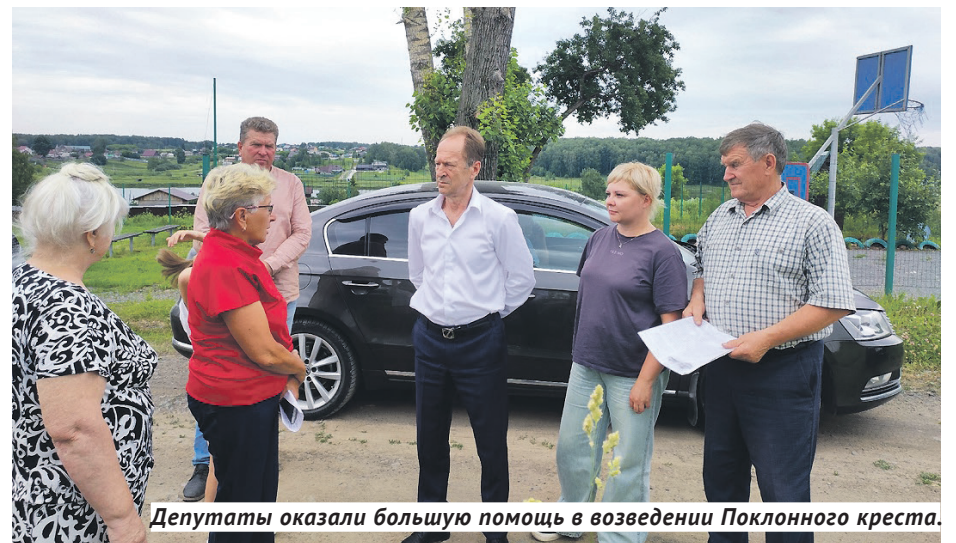
Депутаты оказали большую помощь в возведении Поклонного креста.