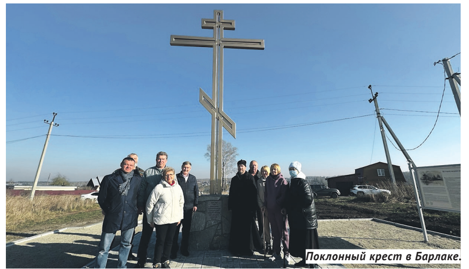
Поклонный крест в Барлаке.