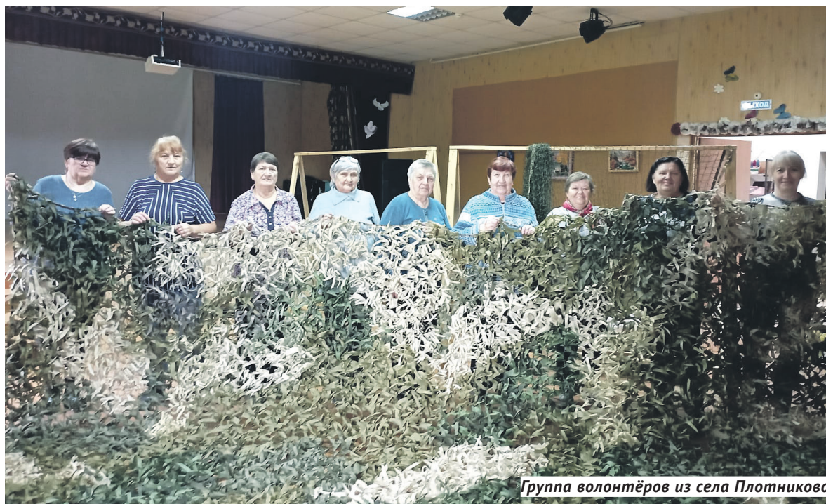
Группа волонтеров из села Плотниково.