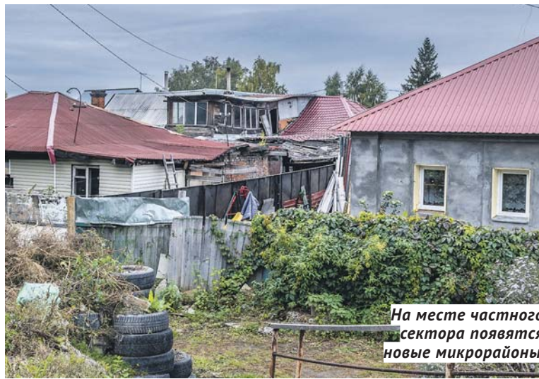
На месте частного сектора появятся новые микрорайоны.