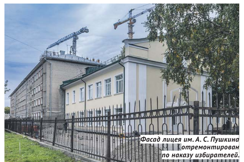
Фасад лицея им. А. С. Пушкина отремонтирован по наказу избирателей.

Большое внимание стали уделять тротуарам, что радует. Построено много тротуаров при подходах к школам. Сейчас, например, по улице Добролюбова построен тротуар от улицы Лескова, и фактически соединена сеть с улицей Пролетарской. Теперь обеспечена безопасность для передвижения детей. Строятся тротуар от больницы скорой помощи №2 на улице Якушева до детского сада №391 и пешеходный переход к школе №19. Выполняется ремонт тротуара возле дома №62 по улице Никитина, это очень проходное место, он давно находился в ужасном состоянии. Работу по этой территории выполнили, заасфальтировали все прилегающие участки, обособили пешеходную зону, а то раньше люди ходили фактически между машинами.