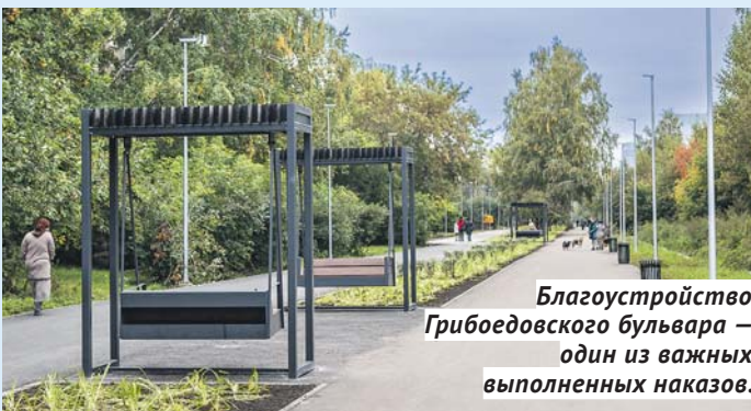
Благоустройство Грибоедовского бульвара – один из важных выполненных наказов.