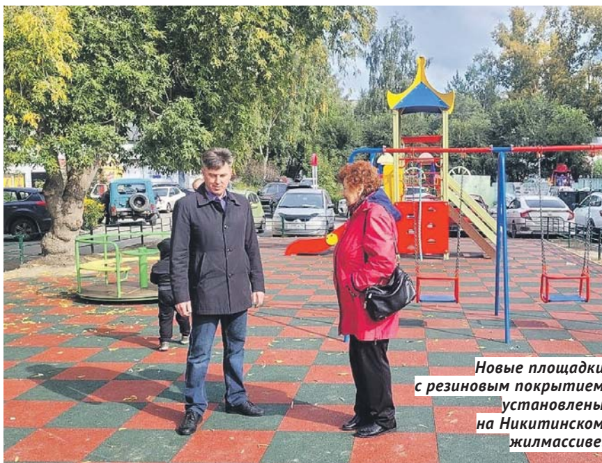
Новые площадки с резиновым покрытием установлены на Никитинском жилмассиве.

Проведено благоустройство придомовой территории по улице Лескова, 15 — асфальтирование проездов, парковок, тротуаров, обустройство детской площадки, ремонт лестниц. Но что делать с постоянными проблемами из-за аварий коммуникаций, пока никто не знает. Каждые полгода, если не чаще, происходит затопление территории, которая находится в низине. Сейчас после комплексного ремонта там опять произошла коммунальная авария, администрация разбирается с её последствиями.