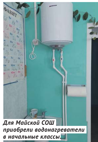
Для Майской СОШ приобрели водонагреватели в начальные классы.

получили ФАПы Искровского, Ярковского и Бочкарёвского сельсовета.