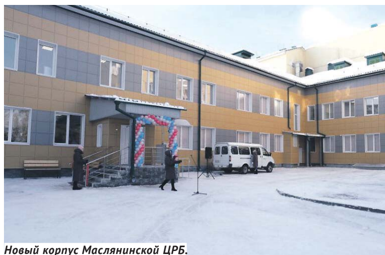
Новый корпус Маслянинской ЦРБ.