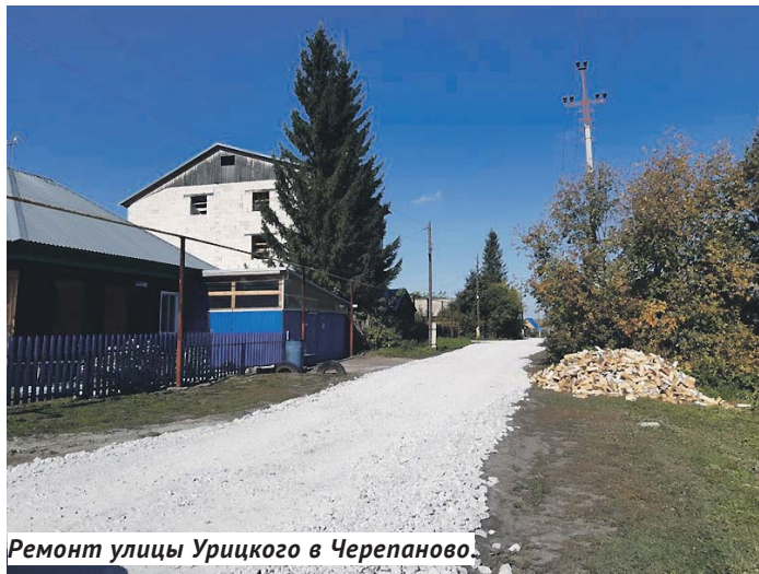
Ремонт улицы Урицкого в Черепаново.

получить благодарность от Новосибирской региональной федерации самбо за поддержку этого исконно русского вида единоборств, вдохновляющего нашу молодёжь на новые свершения и достижения.