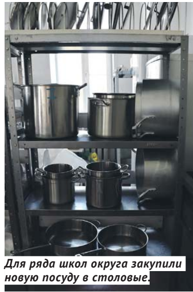
Для ряда школ округа закупили новую посуду в столовые.