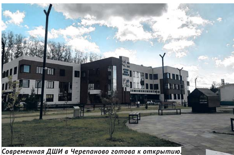
Современная ДШИ в Черепаново готова к открытию.

— Строительно-монтажные работы выполнены полностью, заканчиваются внутреннее оснащение помещений и стадия оформления разрешительных документов. В декабре этого года запланировано торжественное открытие ДШИ. Событие, действительно, важнейшее для города, и в чём-то даже уникальное. Дело в том, что в Новосибирской области несколько десятилетий не строилось подобных крупных досуговых центров для развития творческих способностей детей и молодёжи. И черепановским ребятишкам, которые до этого занимались дополнительным