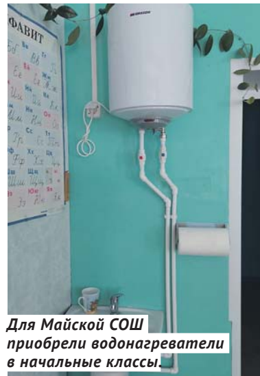
Для Майской СОШ приобрели водонагреватели в начальные классы.

получили ФАПы Искровского, Ярковского и Бочкарёвского сельсовета.