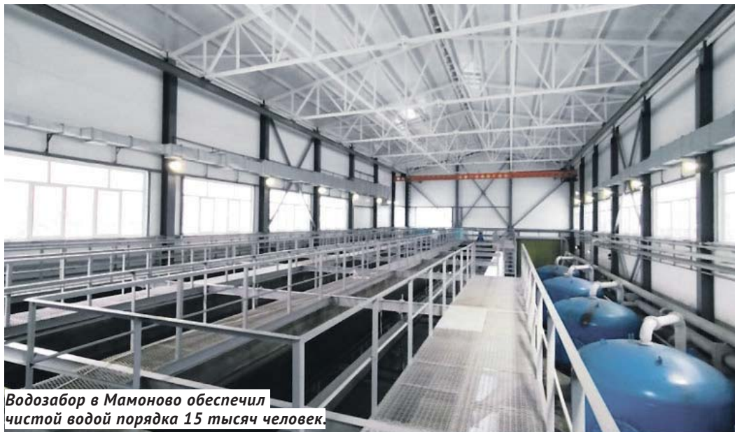
Водозабор в Мамоново обеспечил чистой водой порядка 15 тысяч человек.

— Известно, что вы активно поддерживаете развитие спорта на вашем округе.