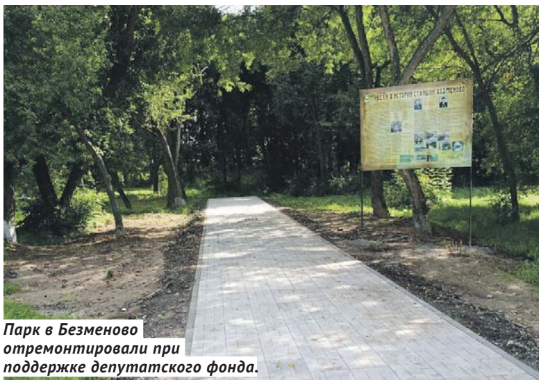
Парк в Безменово отремонтировали при поддержке депутатского фонда.