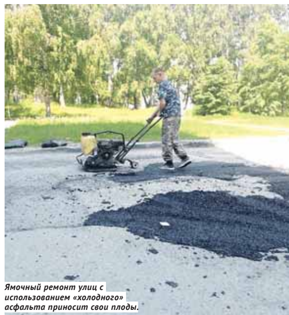
Ямочный ремонт улиц с использованием «холодного» асфальта приносит свои плоды.

Российской Федерации». Это оценка работы вашего благотворительного фонда?