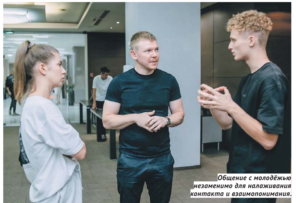
Общение с молодёжью незаменимо для налаживания контакта и взаимопонимания.

Но главное, мэру необходимо сделать так, чтобы все подразделения муниципалитета — департаменты, управления, отделы, районные администрации — работали как единый механизм, отлаженная система. И тогда мы будем видеть и качественные дороги, и чистые остановки, и вовремя выведенную снегоуборочную технику. Своевременная реакция на всё, что происходит в городе, быстрое реагирование, минимум ненужной бюрократии — и результат, не сомневаюсь, будет.