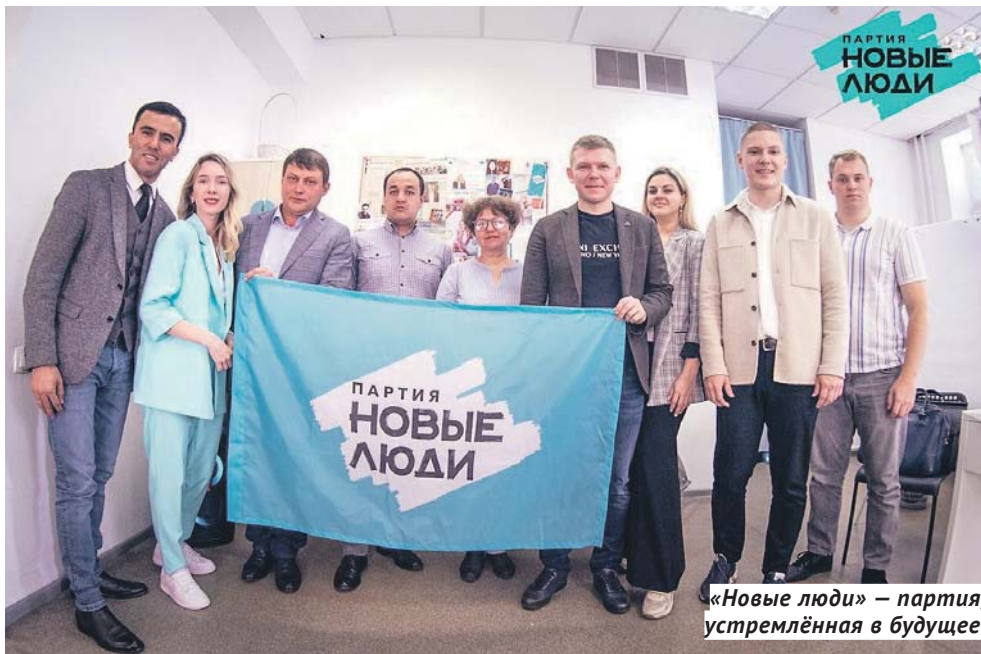
«Новые люди» — партия, устремлённая в будущее.