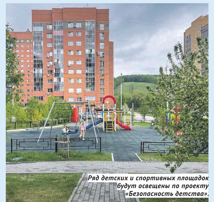
Ряд детских и спортивных площадок будут освещены по проекту «Безопасность детства».