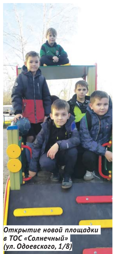
Открытие новой площадки в ТОС «Солнечный» (ул. Одоевского, 1/8)

Для обеспечения безопасности по маршрутам следования детей к школам и дошкольным учреждениям выполнены работы по обустройству тротуаров на улицах Узорной, Физкультурной, Берёзовой, Красный Факел, Марата. Проведено благоустройство улиц частного сектора, асфальтирование улиц Железняк, Моисеенко, Шмидта, Донбасской, Гостиной, Леонида Русских, Радиаторной. Для обеспечения безопасности дорожного движения в районе выполнена установка 11 светофорных объектов на Бердском шоссе и улицах Одоевского, Героев Революции и Первомайской.