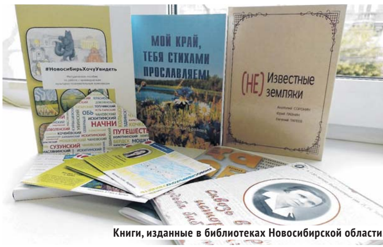
Книги, изданные в библиотеках Новосибирской области.

заявок от 18 районов области и 6 от библиотечных систем Новосибирска поступило на конкурс 2024 года.