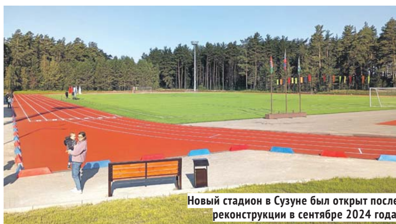
Новый стадион в Сузуне был открыт после реконструкции в сентябре 2024 года.

— Четыре ключевых и более 100 значимых спортивных объектов — это то, что на поверхности, — добавил министр. —