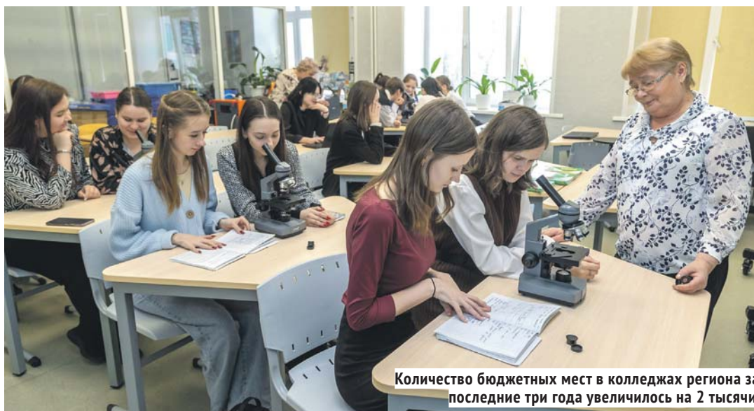
Количество бюджетных мест в колледжах региона за последние три года увеличилось на 2 тысячи.

В последние годы мы часто слышим, что выпускников становится всё меньше, а значит, существует опасность того, что среднее профессиональное образование ждёт затяжной коллапс. Впрочем, как и высшее. По официальным данным, число выпускников российских школ падало с 2010 до 2017 года. Потом начался период стабилизации. Согласно прогнозу Минпросвещения РФ, рост количества выпускников ожидается только в 2025-м. При этом часть стабилизации, начавшаяся с 2021 года, больше напоминает «мёртвый штиль». Ведь если сравнивать численность выпускников школ с базовым уровнем 2010-го, получается, что даже при условии небольшого роста к 2025 году мы едва перешагнём долю в 93,3%. И происходит это на фоне того, что уже сегодня, по оценкам федерального правительства, в России не хватает сотен тысяч инженеров и других специалистов. Сидеть и ждать, когда ситуация сама по себе станет более благоприятной, — такой вариант власти Новосибирской области даже не рассматривали.