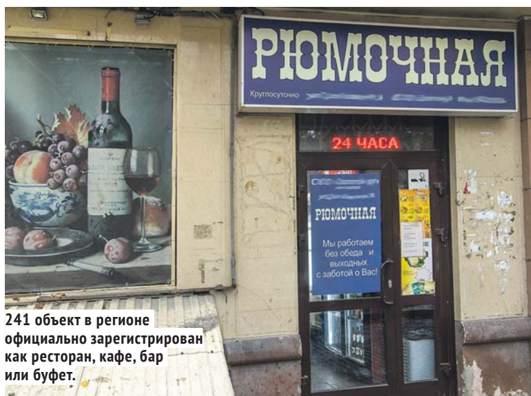
241 объект в регионе официально зарегистрирован как ресторан, кафе, бар или буфет.

Согласно законопроекту, продажа спиртных напитков — пива и пивных напитков, сидра