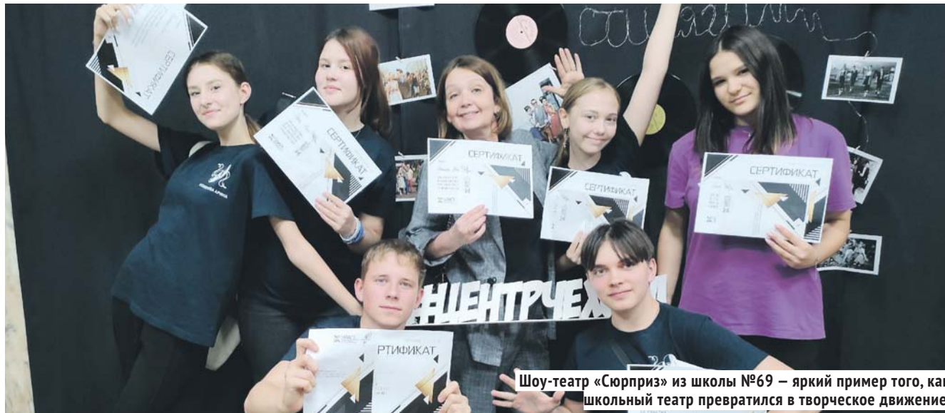
Шоу-театр «Сюрприз» из школы №69 — яркий пример того, как школьный театр превратился в творческое движение.