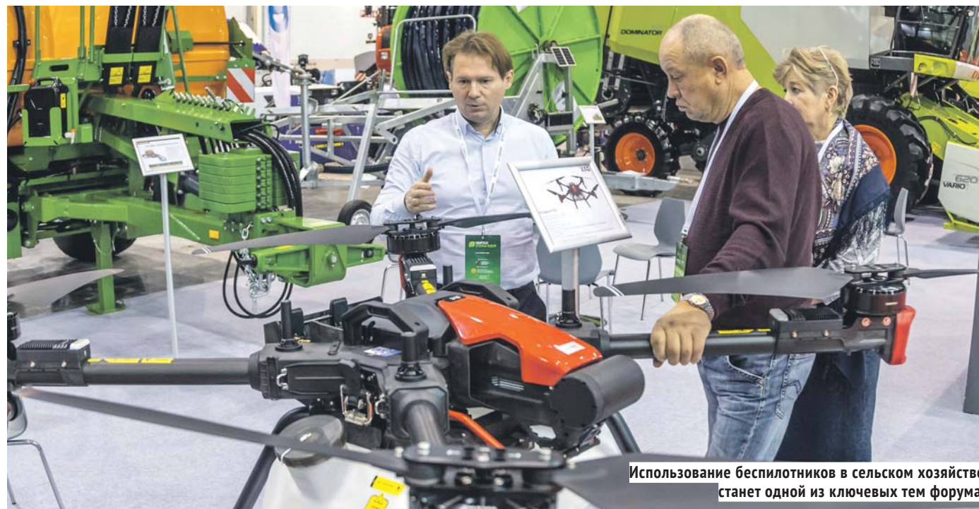
Использование беспилотников в сельском хозяйстве станет одной из ключевых тем форума.