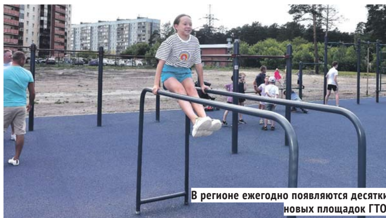
В регионе ежегодно появляются десятки новых площадок ГТО.

типа (мини-стадиона) в Криводановке, Чанах, Барышево и Кочках. Помимо этого, по нацпроекту были построены 105 площадок подготовки и сдачи нормативов ГТО. И их строительство уже даёт ощутимые результаты: к концу октября Новосибирская область установила рекорд по количеству новых участников, зарегистрировавшихся в системе тестирования ГТО, — 63 тысячи человек. Ранее итоговый годо-