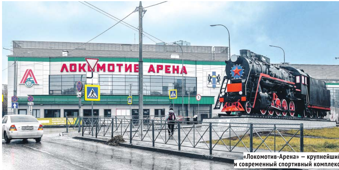
«Локомотив-Арена» — крупнейший и современный спортивный комплекс.

Впрочем, и в плане появления новых спортивных объектов завершающийся шестилетний период был весьма результативным. Естественно, в центре внимания — крупнейшие и знаковые сооружения. Это многофункциональная ледовая «Сибирь-Арена», один из крупнейших и современных в России волейбольных комплексов «Локомотив-Арена», первый в регионе профессиональный легкоатлетический манеж в Кольцово и второй полноразмерный бассейн СКА, который был открыт в марте 2024 года. А в целом в Новосибирской области было построено и оснащено оборудованием более 100 спортивных объектов практически во всех городах и муниципальных районах. Оснащены новыми покрытиями, беговыми дорожками и трибунами стадионы в Сузуне и Бердске, а также четыре физкультурно-оздоровительных комплекса открытого