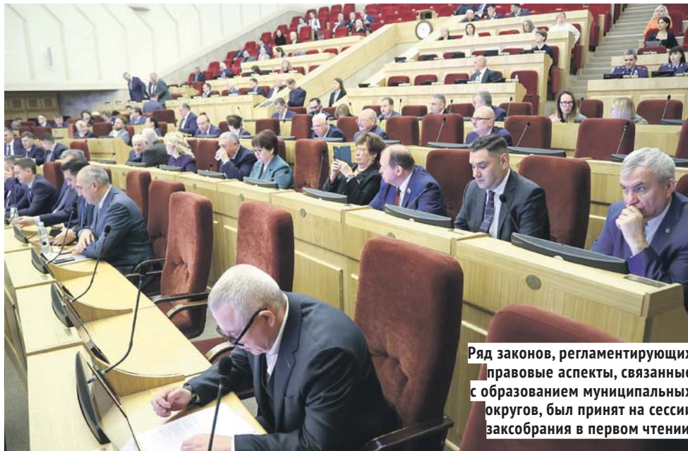
Ряд законов, регламентирующих правовые аспекты, связанные с образованием муниципальных округов, был принят на сессии заксобрания в первом чтении.

В Новосибирской области речь о создании муниципальных округов впервые зашла в начале 2024 года, когда соответствующие поправки в законодательство обсудили на заседаниях комитетов. В качестве пилотных были выбраны три района области: Карасукский, Маслянинский и Татарский. Законы о создании муниципальных округов были приняты заксобрани-