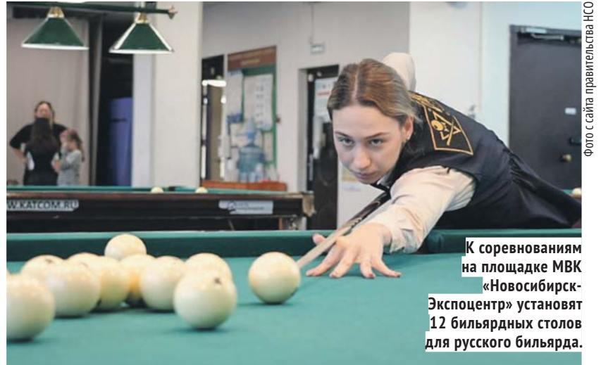
К соревнованиям на площадке МВК «Новосибирск-Экспоцентр» установят 12 бильярдных столов для русского бильярда.

Предстоящие соревнования пройдут в дисциплине «пирамида — командные соревнования», участники будут бороться за мировое первенство в формате «два на два».