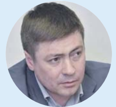
Сергей АХАПОВ , министр физической культуры и спорта НСО:

— Несмотря на завершение федерального проекта, мы продолжим реализацию основных инфраструктурных направлений, ориентированных на создание дополнительных условий для занятий различных категорий населения региона физической культурой и спортом. Эти направления прописаны во всех национальных проектах, которые будут исполнены в дальнейшем.