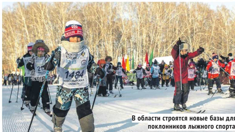
В области строятся новые базы для поклонников лыжного спорта.