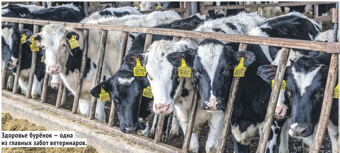
Здоровье бурёнок — одна из главных забот ветеринаров.

Проводится большая работа по выявлению лейкоза у животных, замещению инфицированного поголовья здоровым молодняком. Здесь ситуация также улучшается — за последние три года количество