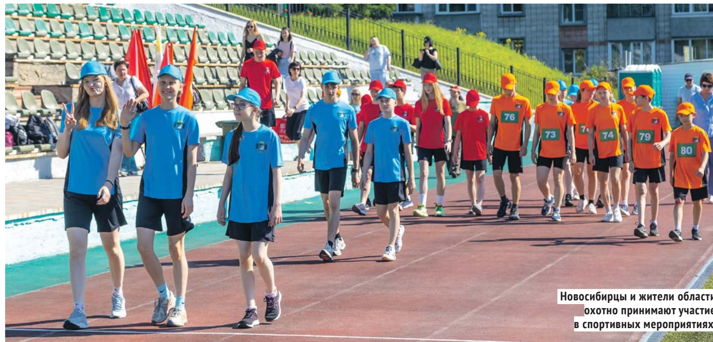
Новосибирцы и жители области охотно принимают участие в спортивных мероприятиях.