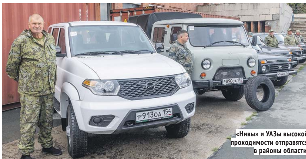
«Нивы» и УАЗы высокой проходимости отправятся в районы области.

Шесть автомобилей «Нива» и три автомобиля УАЗ высокой проходимости отправятся в районы области, где будут использоваться при осуществлении охранных рейдов, мониторинга окружающей среды, выполнения био-