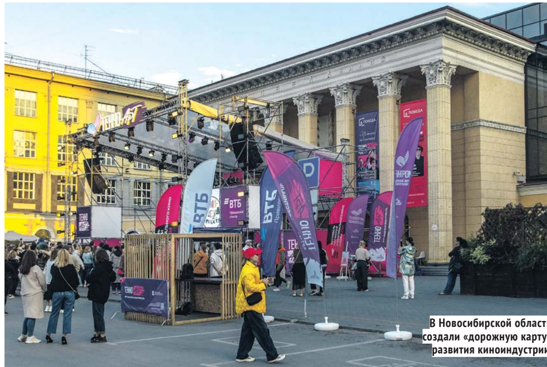
В Новосибирской области создали «дорожную карту» развития киноиндустрии.