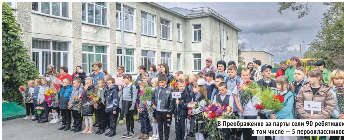
В Преображенке за парты села 90 ребятишек, в том числе — 5 первоклассников.