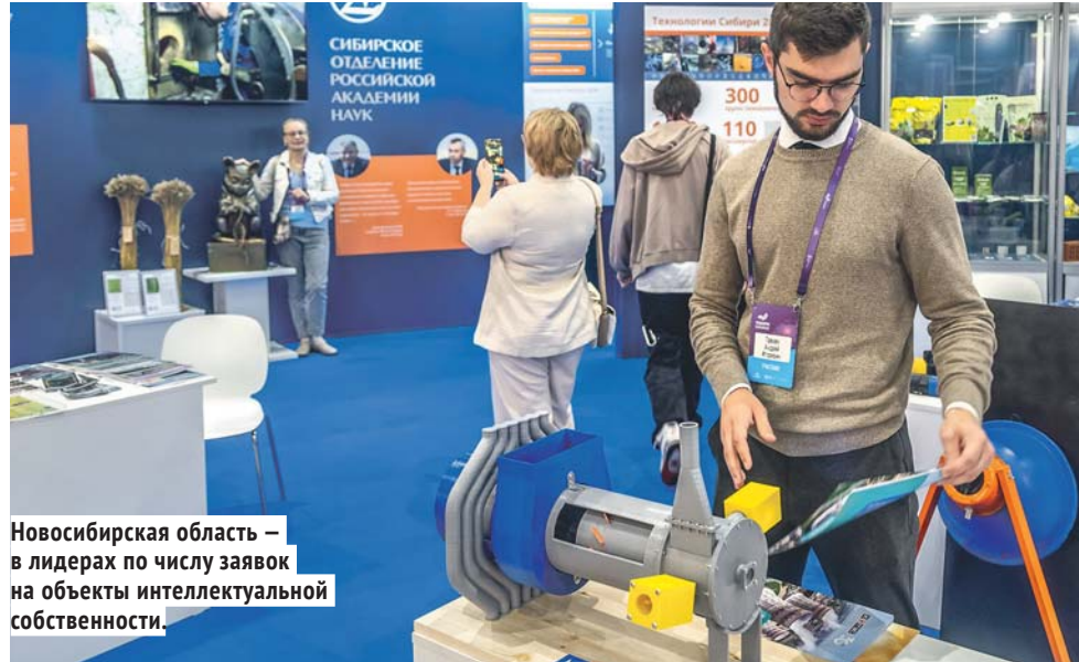
Новосибирская область — в лидерах по числу заявок на объекты интеллектуальной собственности.

В регионе работает Сибирский центр Федерального института промышленной собственности, который проводит экспертизу заявок и реализует масштабный проект по подготовке экспертов в области интеллектуальной собственности. Идёт проработка комплекса экономических мер поддержки сферы. Это кредитование под залог интеллектуальной собственности, субсидирование затрат на получение международных патентов, налоговые льготы.