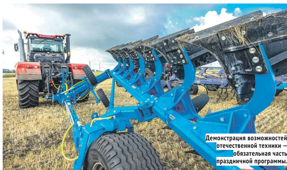
Демонстрация возможностей отечественной техники — обязательная часть праздничной программы.