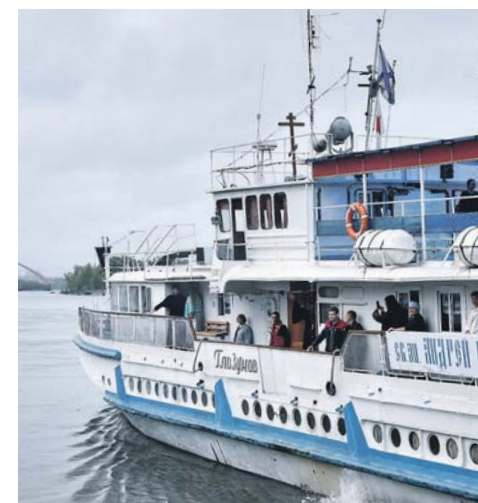
С графиком посещения населённых пунктов региона можно ознакомиться на сайте министерства региональной политики НСО.

Медицинский приём будут вести врачи: терапевт, хирург, педиатр, кардиолог, гинеколог, офтальмолог, невролог, эндокринолог, отоларинголог. Врачи также проведут функциональные диагностики УЗИ и ЭКГ. Все желающие смогут принять таинства крещения, причастия, исповеди, индивидуально побеседовать со священником, получить святую воду и приобрести духовную литературу.