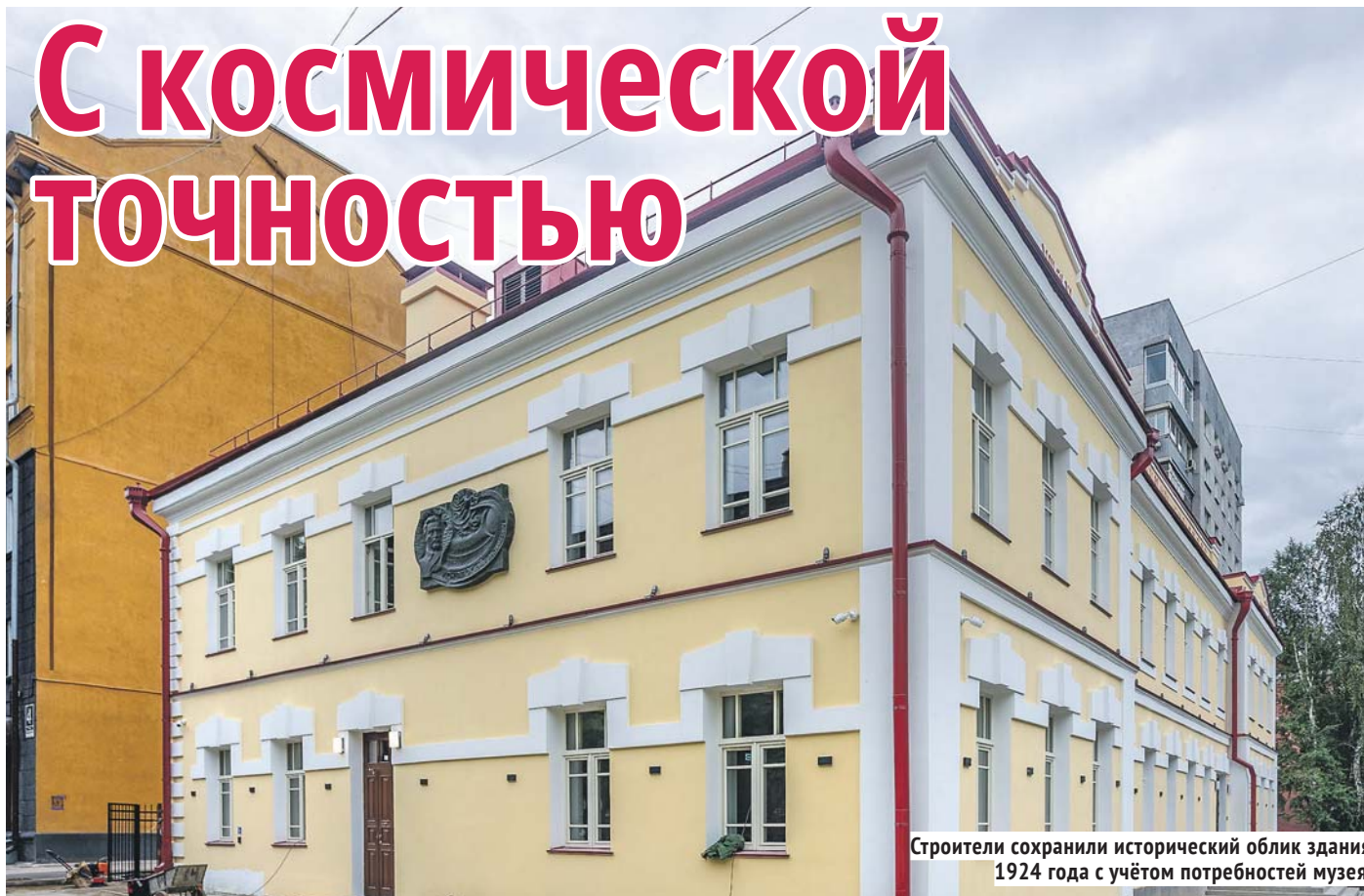
Строители сохранили исторический облик здания 1924 года с учётом потребностей музея.