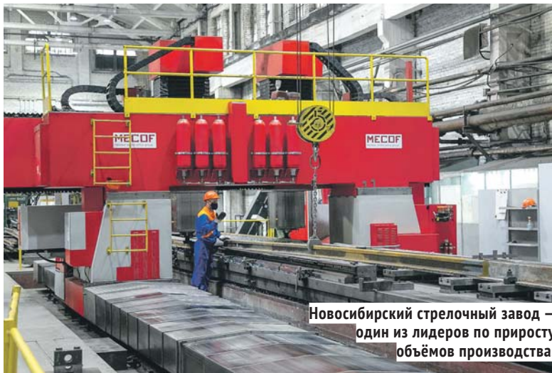
Новосибирский стрелочный завод — один из лидеров по приросту объёмов производства.

Если оценивать по сферам деятельности, то предприятия, выпускающие компьютеры, оптические и электронные изделия, показали рост 35,5%, электрическое оборудование — 17,8%, лекарственные средства и медицинские материалы — 15,5%, химические продукты — 13,9%. Вице-губернатор отметил, что в регионе продолжают эффективно работать меры господдержки промышленности, в частности, проведена дока-