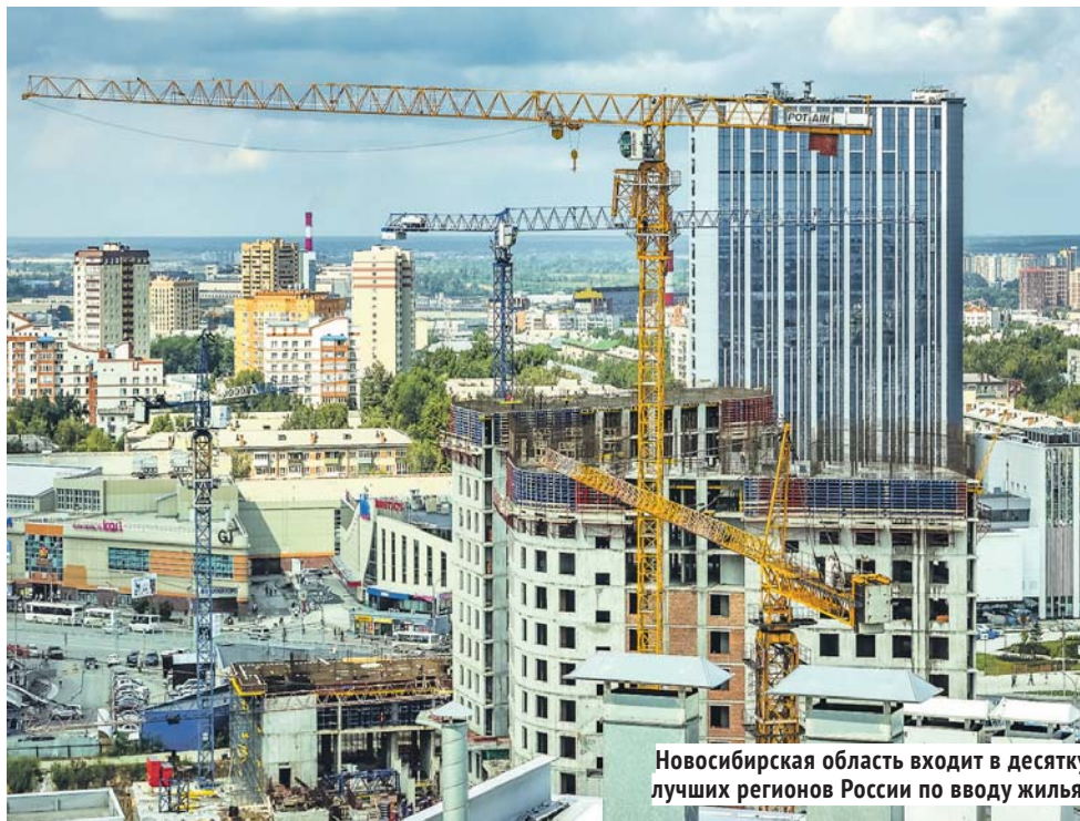
Новосибирская область входит в десятку лучших регионов России по вводу жилья.

— Сегодня в едином реестре проблемных объектов остаётся три жилых дома, по каждому из которых разработан алгоритм выхода из кризисной ситуации, понятны механизмы и сроки