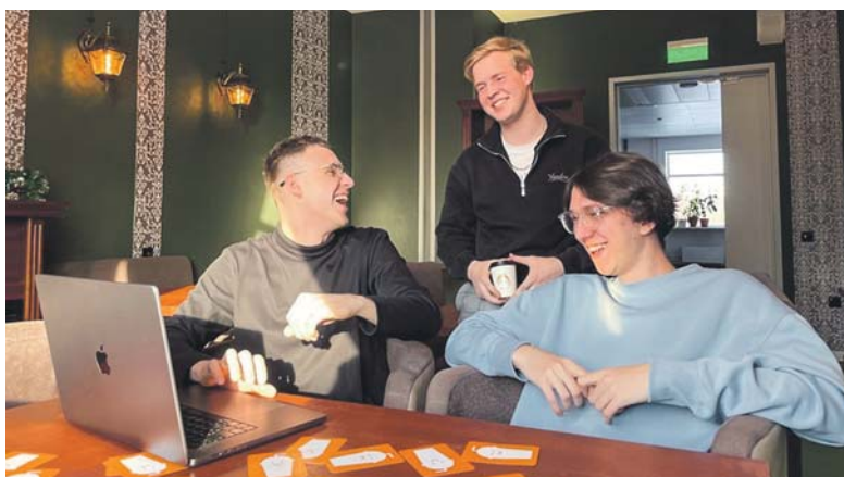
Покупка кофе — дело серьёзное, уверены студенты НГУ, создавшие Телеграм-бота для кофеен.

студентов в 2025 году выйдет на рынок. По задумке скачать и сыграть в эту игру смогут не только россияне, разработка планирует выйти и на международном рынке.