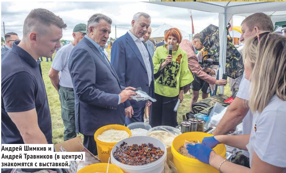
Андрей Шимкив и Андрей Травников (в центре) знакомятся с выставкой.

1 млн 533 тысячи гектаров целинных и залежных земель было освоено в Новосибирской области в 1954–1958 годах.