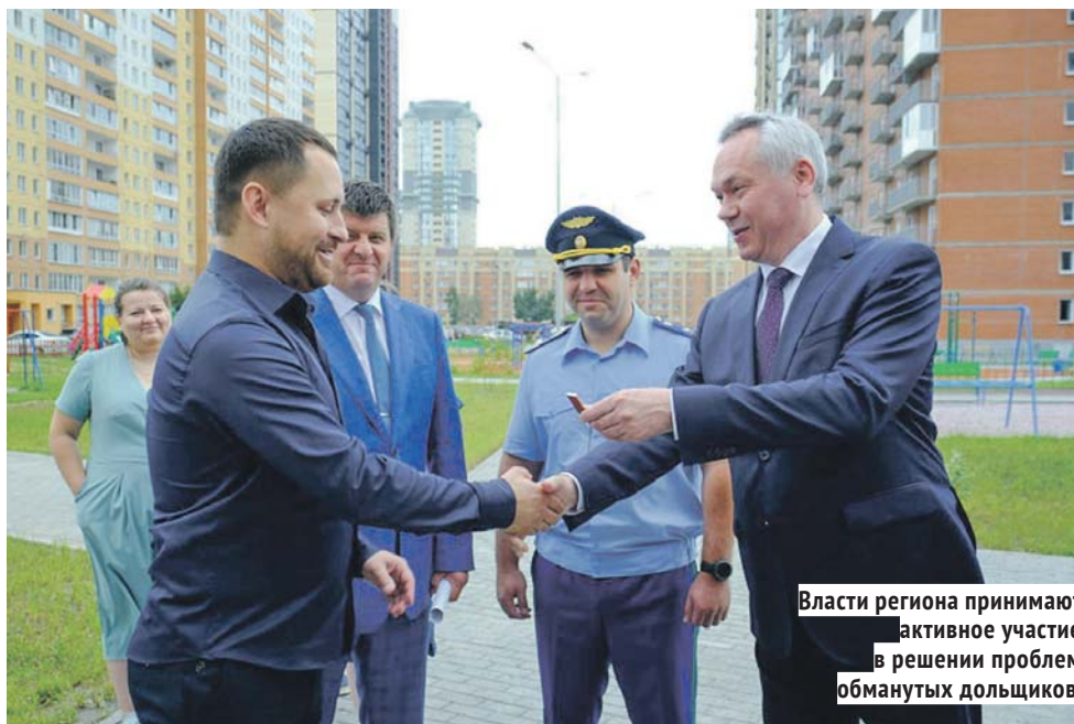
Власти региона принимают активное участие в решении проблем обманутых дольщиков.