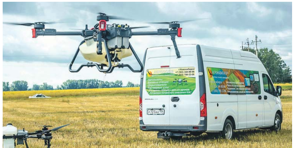
Беспилотники для обработки полевых работ — уже реальность на полях Новосибирской области.