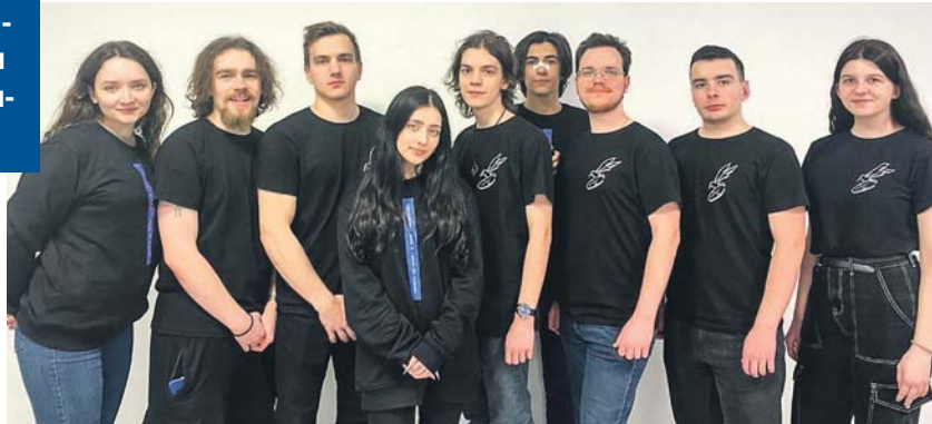
Компьютерной игрой, создаваемой новосибирскими студентами, уже заинтересовались крупные компании.