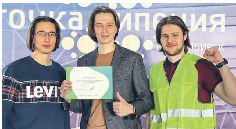
Стартап новосибирских студентов позволит водителям получить техпомощь даже в самых удалённых местах.

Чтобы воспользоваться Cloffer, клиент заходит в ТГ-бот, выбирает блюдо с добавками по желанию, оплачивает заказ через СБП и следит за его статусом приготовления. О готовности напитка или блюда гость получает уведомление. Кофейни же с помощью бота могут отслеживать статистику работы заведения за определённый период времени. Он анализирует действия пользователя, используя машинное обучение, и предлагает более выгодные предложения.