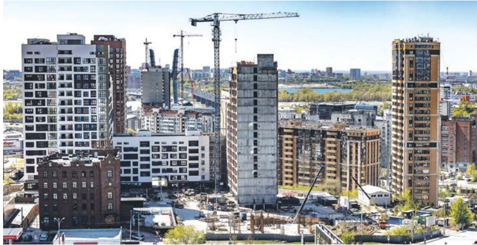
Уже сейчас средняя ставка по ипотечным кредитам составляет около 18%.