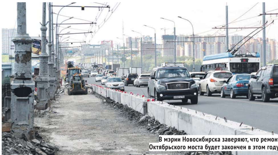
В мэрии Новосибирска заверяют, что ремонт Октябрьского моста будет закончен в этом году.

Депутатов, безусловно, больше всего интересовали мосты, которые находятся в зоне пристального внимания — Октябрьский и Димитровский в Новосибирске. И без того не блестящая дорожная ситуация в областном центре сильно осложнилась в последние два года, после запуска сначала капитального ремонта Октябрьского моста, а затем и стартовавшего в этом году ремонта Димитровского. Причём проблемы, сопровождающие ремонтный процесс, удивительно похожи. С подрядчиком, который летом 2022 года начал ремонт Октябрьского моста, в ноябре прошлого года контракт был расторгнут, а поиски новой компании, естественно, замедлили темпы работ. А буквально 8 июля