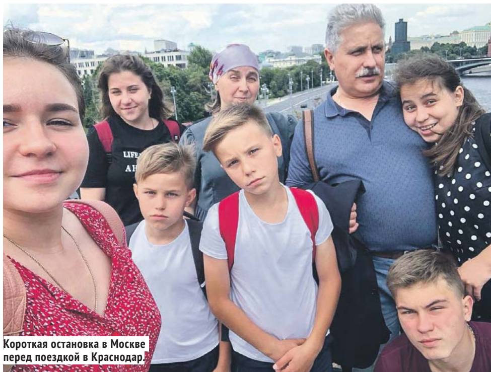
Короткая остановка в Москве перед поездкой в Краснодар.