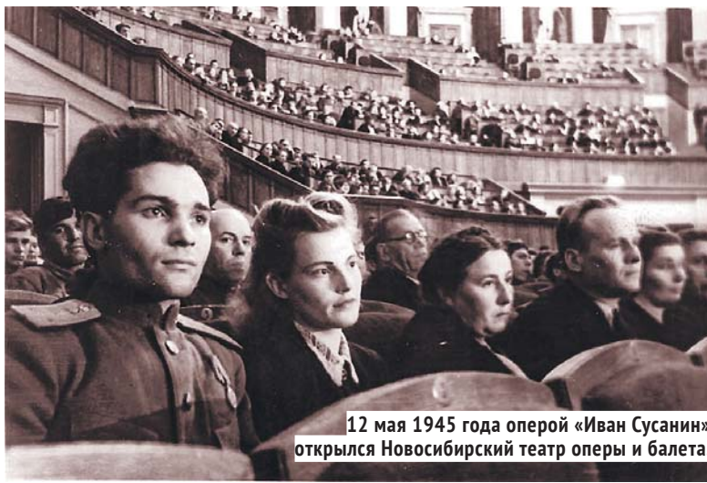
12 мая 1945 года оперой «Иван Сусанин» открылся Новосибирский театр оперы и балета.

передали в фонд обороны 5 000 000 рублей.