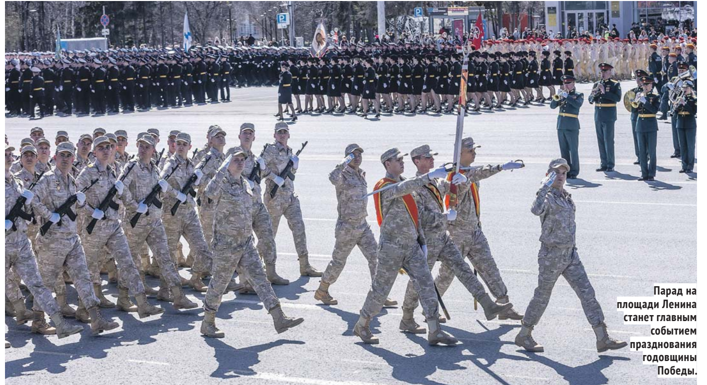
Парад на площади Ленина станет главным событием празднования годовщины Победы.