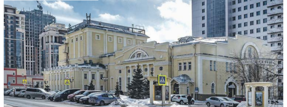
Слом масштаба и стилистики исторической части центра, улица Ленина в районе театра «Красный факел».

личная от проекта, и форма реализации самого ограждения участка, выходящего непосредственно на главную улицу города — Красный проспект. Полное неуважение к жителям Новосибирска. Остаётся лишь дополнить забор надписью «Осторожно, злая собака!».