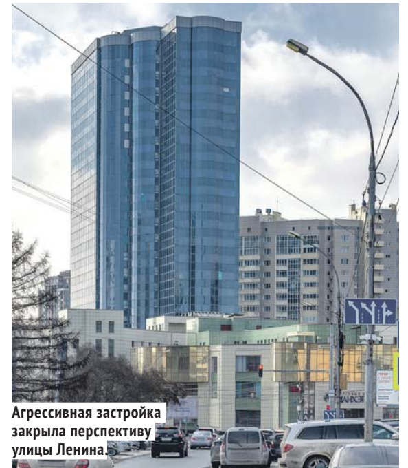
Агрессивная застройка закрыла перспективу улицы Ленина.