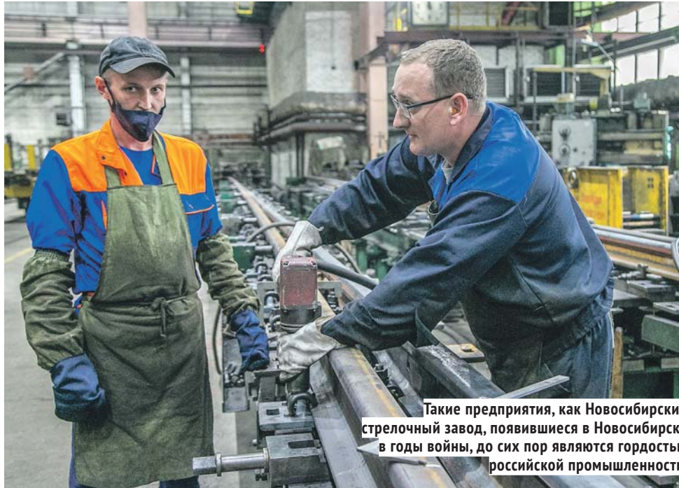
Такие предприятия, как Новосибирский стрелочный завод, появившиеся в Новосибирске в годы войны, до сих пор являются гордостью российской промышленности.

— Первым в июле 1941 года к нам прибыл Московский завод цветных металлов. В то время это был единственный в стране завод, выпускавший химически чистое золото. Оперативная эвакуация предприятия организована по особому распоряжению заместителя председателя Совета народных комиссаров СССР Л. П. Берии. Первый эшелон с оборудованием пришёл 21 июля, а уже в августе «золотой» завод начал выпускать продукцию — золотые слитки, которыми мы расплачивались с союзниками за поставку вооружения и продовольствия для фронта. После войны Новосибирский аффинажный завод был одним из самых крупных предприятий такого рода в стране. В год