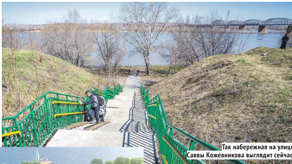
Так набережная на улице Саввы Кожевникова выглядит сейчас.

История рейтингового голосования, которое проходило практически во всех регионах России, по своей продолжительности совпадает со сроком действия национального проекта «Формирование комфортной городской среды», реализация которого началась в 2018 году. Именно весной того года новосибирцы впервые получили право проголосовать за объекты благоустройства, которые ближе их сердцу или просто месту проживания. Благодаря нацпроекту за эти годы удалось провести реконструкцию таких