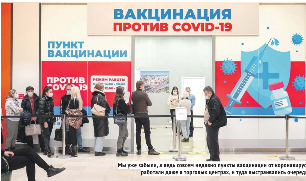
Мы уже забыли, а ведь совсем недавно пункты вакцинации от коронавируса работали даже в торговых центрах, и туда выстраивались очереди.