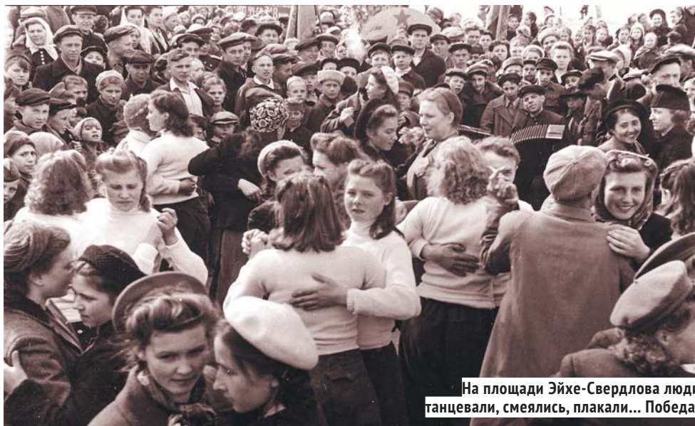
На площади Эйхе-Свердлова люди танцевали, смеялись, плакали... Победа!

восемь утра местное радио уже зовёт: «Все на митинг!». Возле заводских проходных формируются колонны — идут к центру города с песнями и танцами.