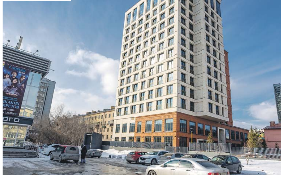
Омертвление общественно-деловой части центра, Красный проспект у КК имени Маяковского.

Татьяна ТАЙЧЕНАЧЕВА