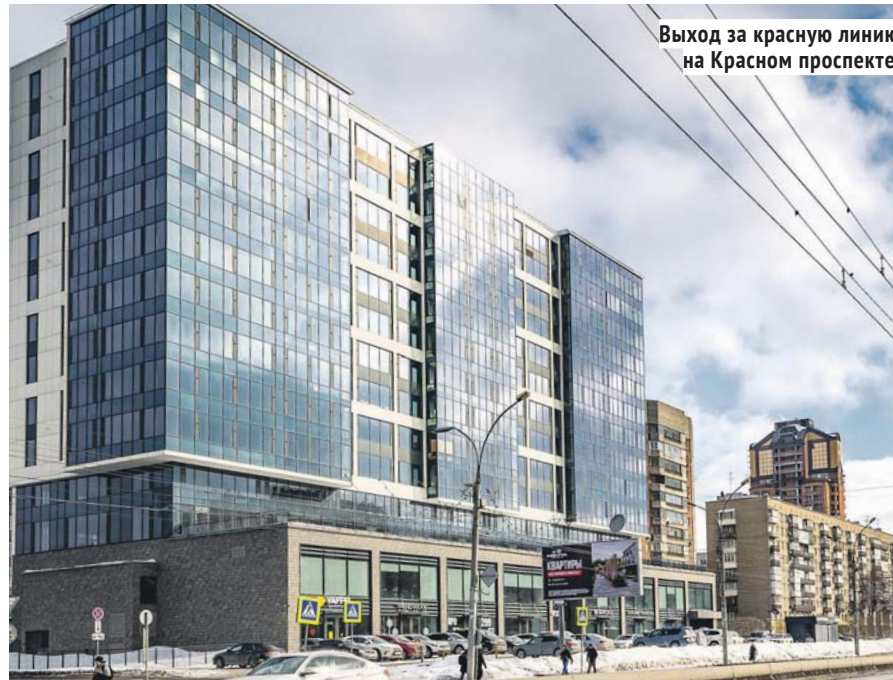
Выход за красную линию на Красном проспекте.

Одним из важнейших назначений центра города является наличие в нём общественных пространств — открытых, доступных и насыщенных общественно значимыми городскими функциями. Понижать статус территории от общественно-деловой до жилой для исторического ядра города — преступно. Выполненный в 2018 году московским архитектурным бюро «Остоженка» проект апарт-отеля на пересечении Красного проспекта и улицы Чаплыгина предусматривал устройство вокруг объекта интегрированных в окружающую застройку общественных пространств. В процессе реализации проекта апарт-отель превратился в жилой комплекс закрытого типа с глухим забором. Вызывает недоумение и архитектура, от-