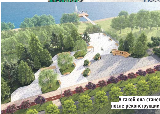
А такой она станет после реконструкции.

масштабных и знаковых объектов, как Монумент Славы, Михайловская набережная, Заельцовский парк и Затулинский дисперсный парк в Новосибирске. В этом году будет проведено благоустройство прошлогоднего победителя — парка в пойме реки Каменка.