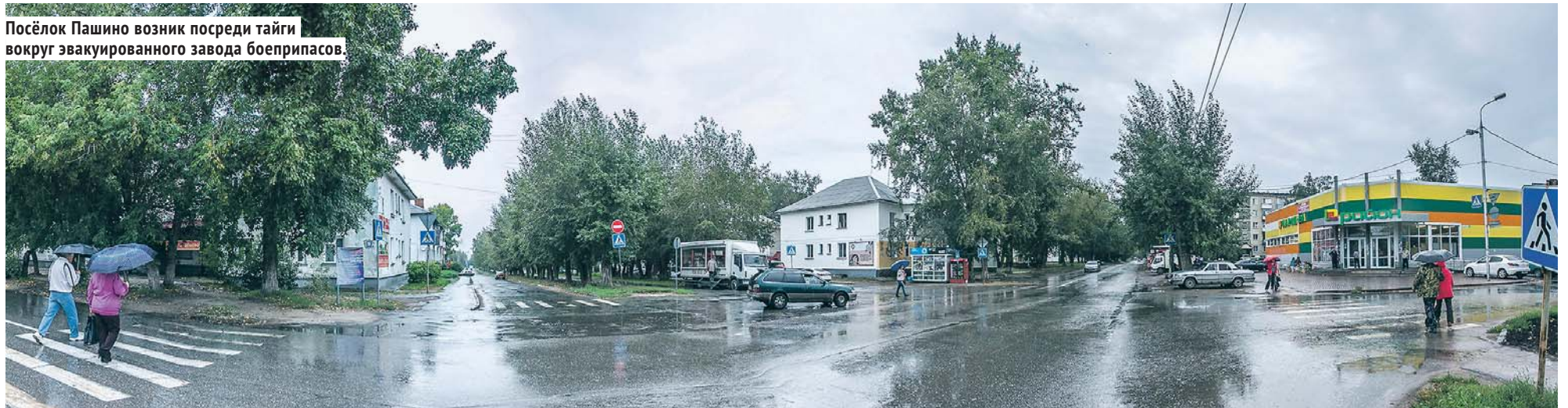
Посёлок Пашино возник посреди тайги вокруг эвакуированного завода боеприпасов