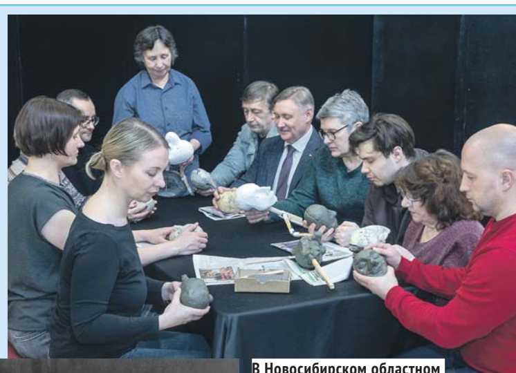
В Новосибирском областном театре кукол повторили исторический кадр 1942 года, где военных учат изготавливать кукол для фронтовых агитбригад.