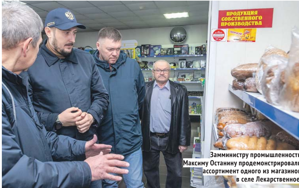
Заминистру промышленности Максиму Останину продемонстрировали ассортимент одного из магазинов в селе Лекарственное.

— Главная цель субсидии — сохранение действующей торговой сети отдалённых сёл и развитие в них новых форматов. При этом наш регион до сих пор является единственным в России, где существует подобная мера поддержки, — отметил заместитель министра промышленности, торговли и развития предпринимательства Максим Останин . — Ассортимент и автолавок, и торговых объектов, куда