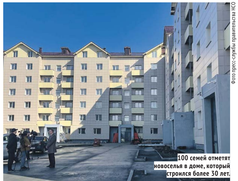
100 семей отмечают новоселья в доме, который строился более 30 лет.

По словам участницы долевого строительства дома по улице Ивлева, 160 Тамары Бакановой , этого события её семья ждала более 13 лет, и оно стало возможным благодаря активной позиции ЖСК и помощи правительства региона.