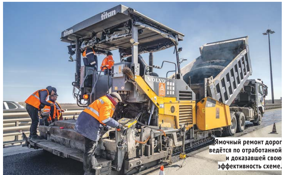
Ямочный ремонт дорог ведётся по отработанной и доказавшей свою эффективность схеме.

Гарантийный срок на верхний слой покрытия из асфальтобетона на Советском шоссе при интенсивности движения автомобилей 10–20 тысяч в сутки составит 4 года, на дорожную разметку из термопластика — 1 год. Гарантия на барьерное металлическое ограждение достигает 5 лет.