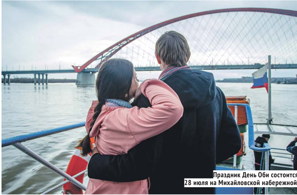
Праздник День Оби состоится 28 июля на Михайловской набережной.