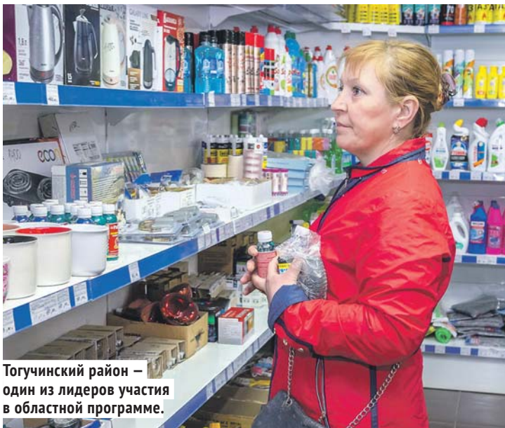
Тогучинский район — один из лидеров участия в областной программе.

предприниматели доставляют свой товар, включает в себя все товары первой необходимости, в том числе крупы, сахар и соль, определённые позиции одежды и обуви, предметы гигиены, канцелярию и хозяйственные товары. В целом торговые организации и пред-