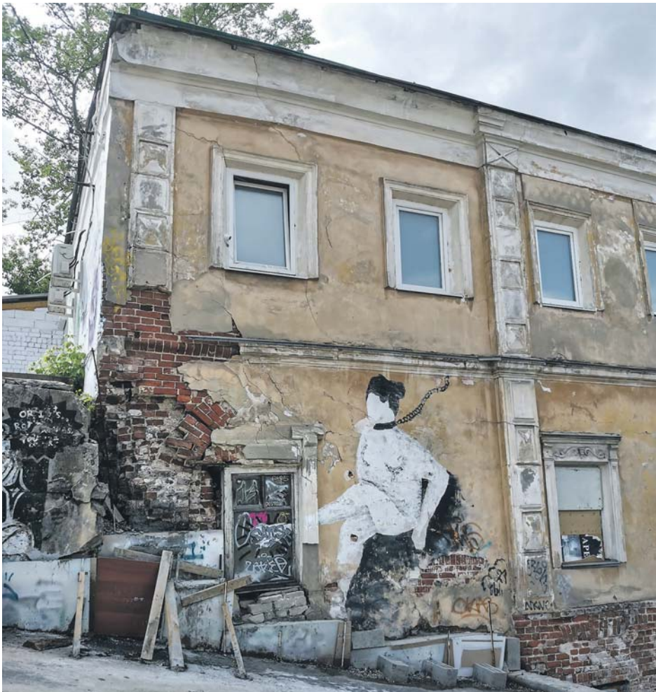
Наталья ДМИТРИЕВА

Эксперты федерального проекта «Трезвая Россия» в конце 2023 года обнаружили результаты своего исследования: в нашей стране почти 6 млн человек живут с наркотической зависимостью. Мужчины по-прежнему лидируют по объёму употребляемых наркотиков и алкоголя, но этот гендерный перевес стремительно сокращается: если в прошлом веке соотношение мужчин и женщин с аддикциями составляло 10:1, то сегодня уже 4:1. В нашем регионе количество зарегистрированных больных наркоманией остаётся относительно стабильным уже несколько лет и составляет примерно 4,1–4,2 тысячи человек, но мы должны понимать, что это официально зарегистрированная «верхушка айсберга». Специалисты Новосибирского областного наркодиспансера подтверждают: эти данные неточные — соотношение известных и скрытых случаев употребления наркотиков составляет 1:7.