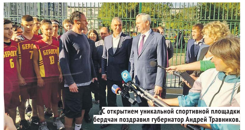
С открытием уникальной спортивной площадки бердчан поздравил губернатор Андрей Травников.

И это обещание было выполнено: осенью 2023 года были открыты ещё две таких площадки — на улице Лелюха, 13 и улице Попова, 33.