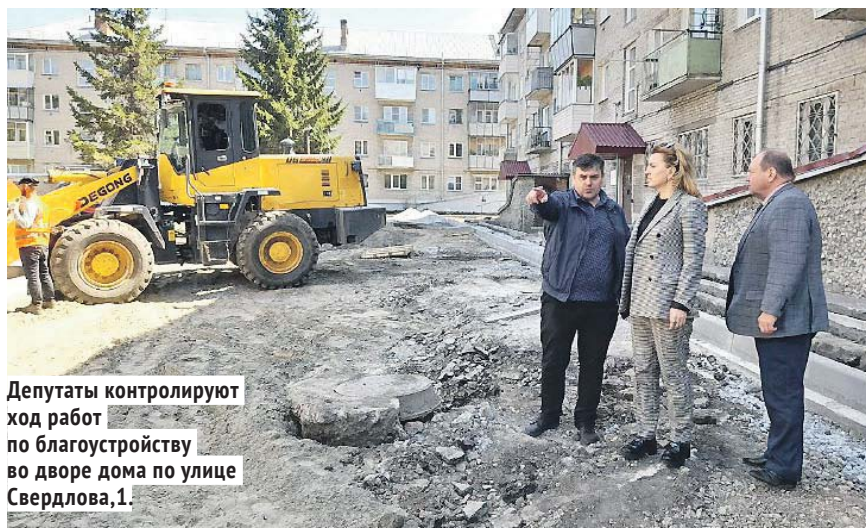
Депутаты контролируют ход работ по благоустройству во дворе дома по улице Свердлова, 1.

Ремонт дорог и благоустройство дворовых территорий входят в число приоритетных наказов избирателей, и депутаты тщательно контролируют их исполнение.