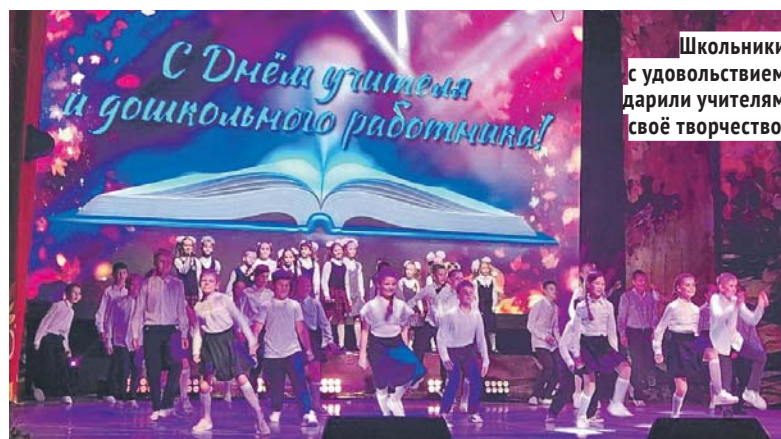
Школьники с удовольствием дарят учителям своё творчество.

Она заверила, что депутаты делают всё возможное для создания комфортных условий в Бердской центральной городской больнице, улучше-