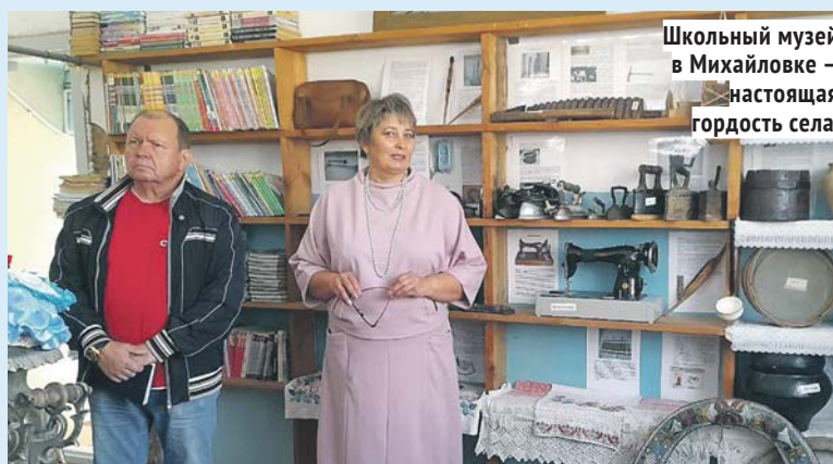
Школьный музей в Михайловке — настоящая гордость села.

В Гусельниковскую и Беловскую школу надо приобрести мебель в классы,