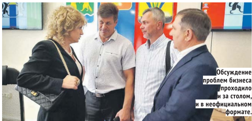
Обсуждение проблем бизнеса проходило и за столом, и в неофициальном формате.