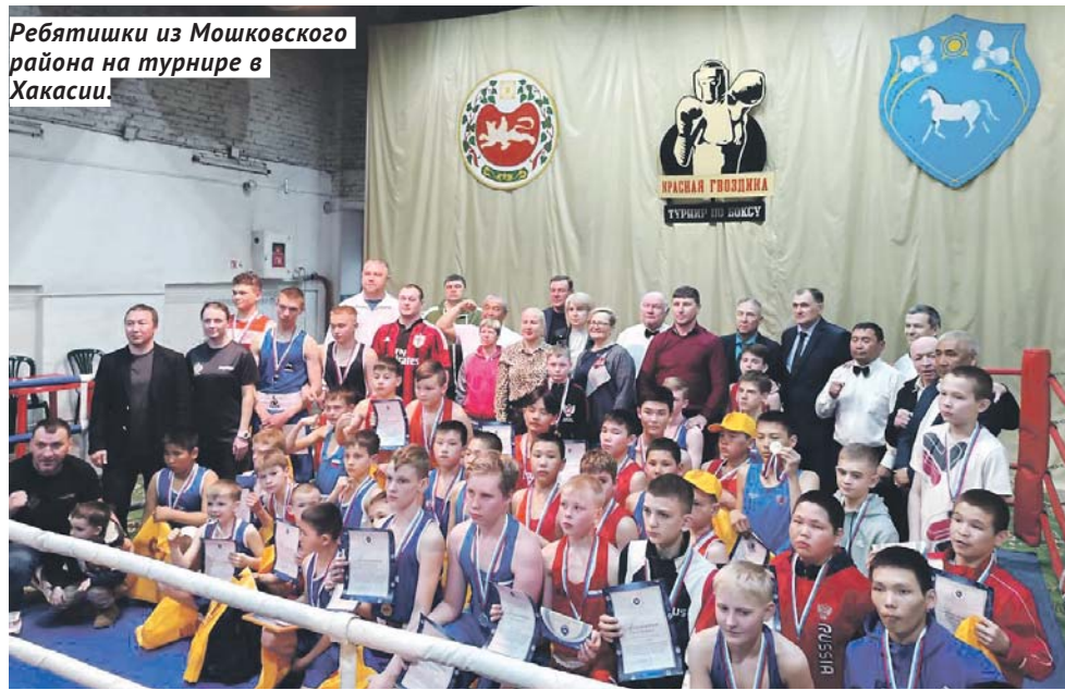
Ребята из Мошковского района на турнире в Хакасии.