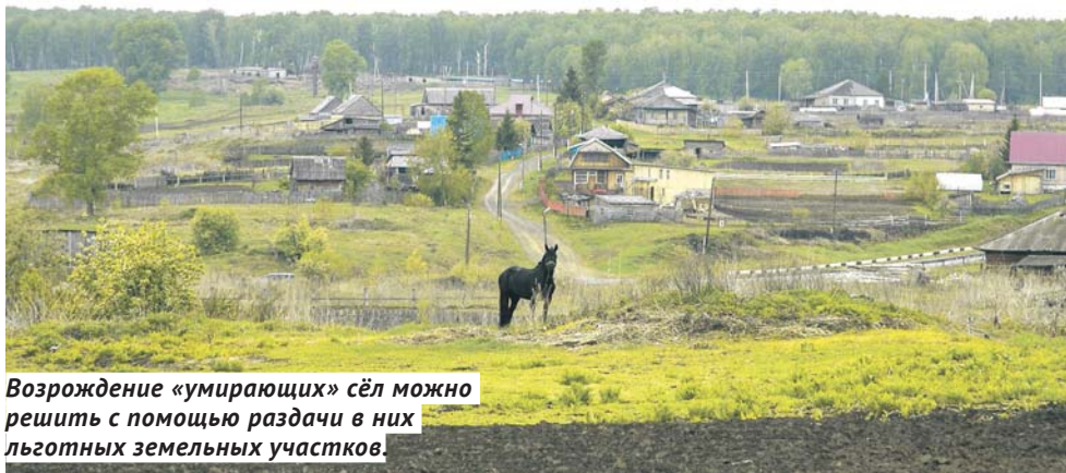
Возрождение «умирающих» сёл можно решить с помощью раздачи в них льготных земельных участков.

заранее сформированных предложений. А не просто в очередь тебя поставили — и сиди ожидай.