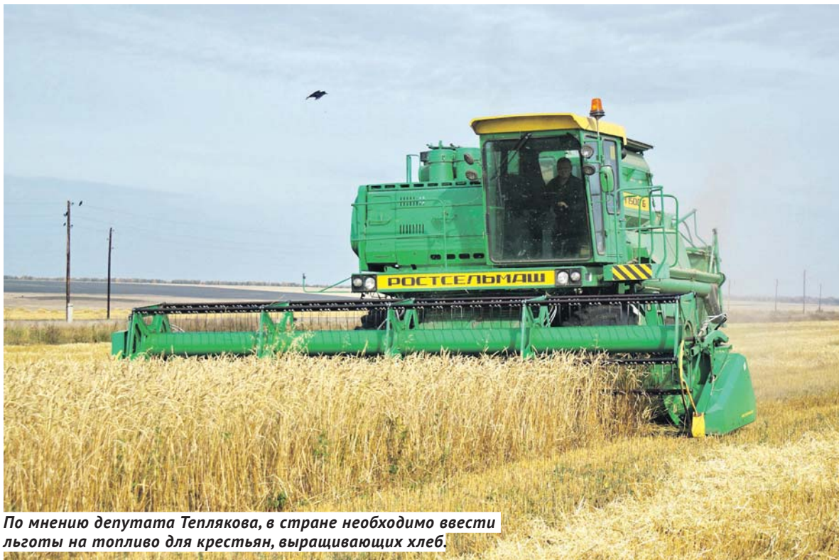
По мнению депутата Теплякова, в стране необходимо ввести льготы на топливо для крестьян, выращивающих хлеб.

На следующий день проблема вновь обсуждалась депутата-