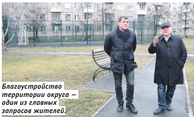
Благоустройство территории округа – один из главных запросов жителей.