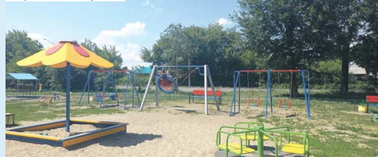
Площадка на Троллейной выполнена на средства депутатского фонда.