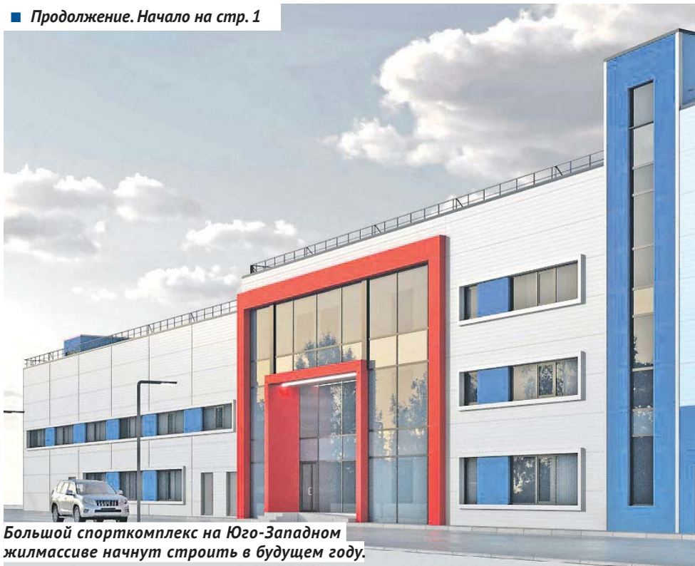
Большой спорткомплекс на Юго-Западном жилмассиве начнут строить в будущем году.