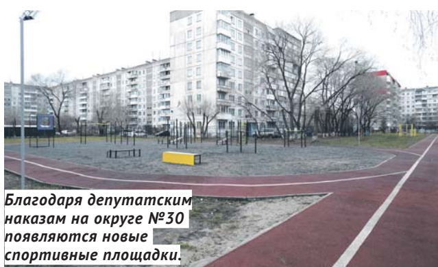
Благодаря депутатским наказам на округе №30 появляются новые спортивные площадки.