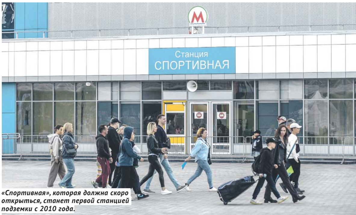
«Спортивная», которая должна скоро открыться, станет первой станцией подземки с 2010 года.

По итогам 2022 года Новосибирский метрополитен сохранил третье место в России по пассажиропотоку, уступая только подземкам двух столиц, — 77,3 млн человек. Это вдвое больше, чем в Екатеринбургском метрополитене (38 млн пассажиров), в котором девять станций. При этом по количеству станций (13) Новосибирский метрополитен занимает четвёртое место в стране. Нижегородский метрополитен, который насчитывает 16 станций, в 2022 году обслужил всего 30 млн пассажиров.