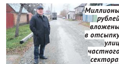
Миллионы рублей вложены в отсыпку улиц частного сектора.

Спортплощадки – также один из трендов последних лет: одна площадка появилась на улице 9-й Гвардейской дивизии (программа «Территория