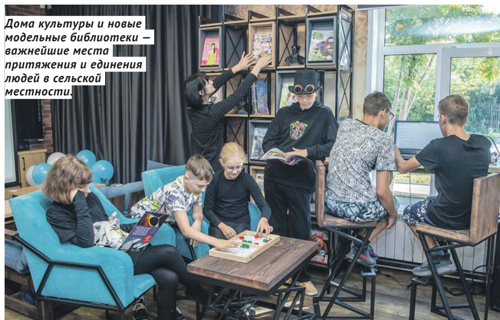
Дома культуры и новые модельные библиотеки — важнейшие места притяжения и единения людей в сельской местности.