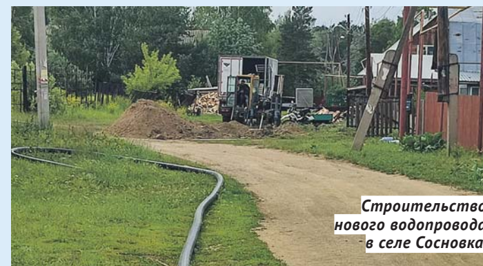
Строительство нового водопровода в селе Сосновка.

Но этим модернизация систем ЖКХ на округе №17 не завершается. Многие из запланированных работ будут касаться именно водоснабжения и повышения качества питьевой воды. Один из крупнейших планируемых проектов стоимостью почти 200 миллионов рублей — строительство магистрального водопровода в селе Барышево, там же — реконструкция канализационно-насосной станции. Скважины и станции водоочистки (нередко — вместе) будут построены в посёлках Железнодорожный, Ломовская Дача, Ленинский, Витаминка. Также завершается разработка проектов по строительству блочно-модульных газовых котельных в сёлах Барышево и Раздольное.