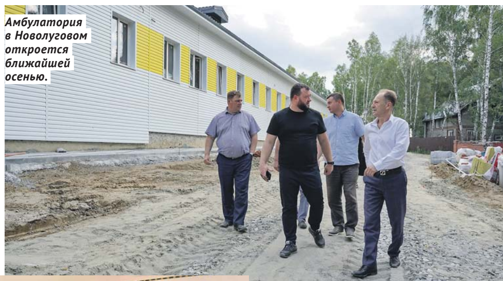
Амбулатория в Новолуговом откроется ближайшей осенью.

Но амбулатория в Ложке стала лишь первым этапом кардинального обновления системы здравоохранения на избирательном округе депутатов Законодательного Собрания Юрия Похила и Игоря Гришунина . Уже весной радостное событие произошло в Каменском сельсовете Новосибирского района — в микрорайоне Олимпийская Слава достроили новое поликлиническое отделение больницы №2 с детским и взрослым отделениями и дневным стационаром. В детском отделении разместились кабинеты доврачебного приёма и педиатра, фильтр-бокс, прививочный и процедурный кабинеты. Во взрослом отделении, помимо кабинетов терапевтов, предусмотрены кабинеты