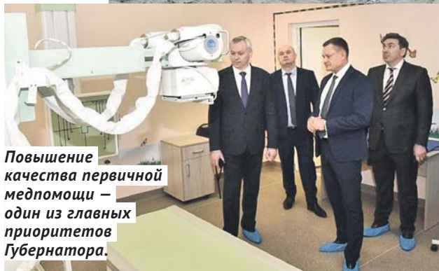
Повышение качества первичной медпомощи — один из главных приоритетов Губернатора.

врачей-специалистов, акушера-гинеколога, кабинеты физиотерапии и процедурный. Новая поликлиника, безусловно, улучшила доступность медпомощи для жителей села Каменка, посёлка Восход,