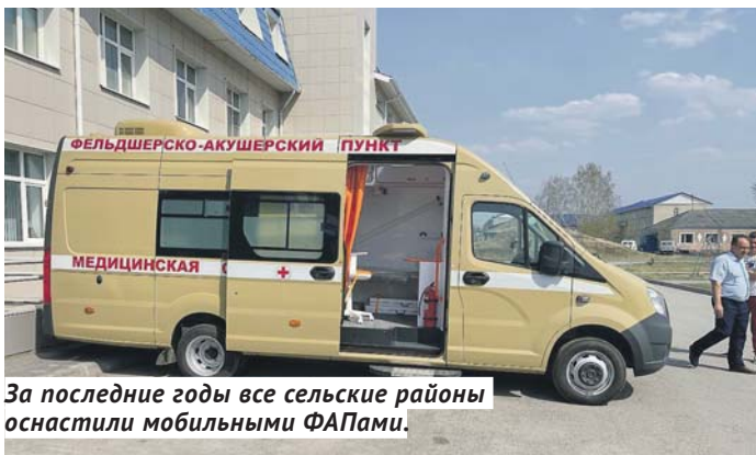
За последние годы все сельские районы оснастили мобильными ФАПами.

в Новосибирске, что кардинально изменит в лучшую сторону качество медицинского обслуживания в областном центре.