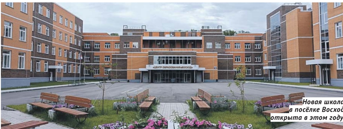
Новая школа в посёлке Восход открыта в этом году.

Образовательное учреждение на 1 100 учеников открылось в Новосибирском районе.