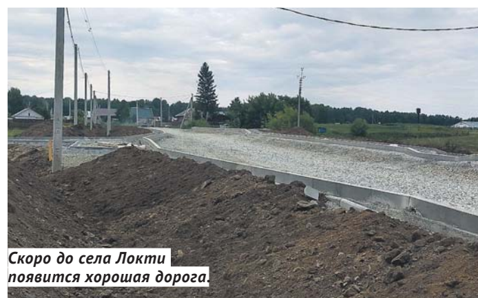
Скоро до села Локти появится хорошая дорога.

Дороги, новые медицинские и образовательные учреждения, улучшение коммунальных систем — все эти многочисленные вопросы на округе находятся в стадии решения либо в самых ближайших планах. За последние годы сделано очень многое, но главное — это то, что ещё предстоит сделать депутатам Игорю Гришунину и Юрию Похилу.