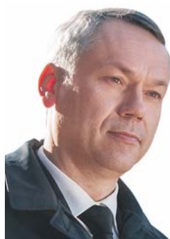
Андрей ТРАВНИКОВ, Губернатор Новосибирской области:

Законодательного Собрания Новосибирской области