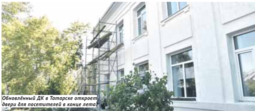
Обновлённый ДК в Татарске откроет двери для посетителей в конце лета.