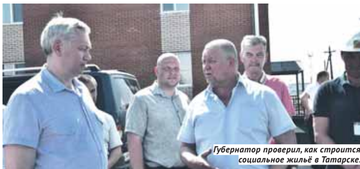
Губернатор проверил, как строится социальное жильё в Татарске.