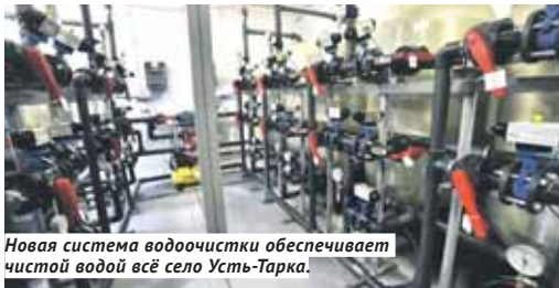
Новая система водоочистки обеспечивает чистой водой всё село Усть-Тарка.

Благодаря программе «Чистая вода» районы области последовательно обеспечиваются современными системами водоочистки.