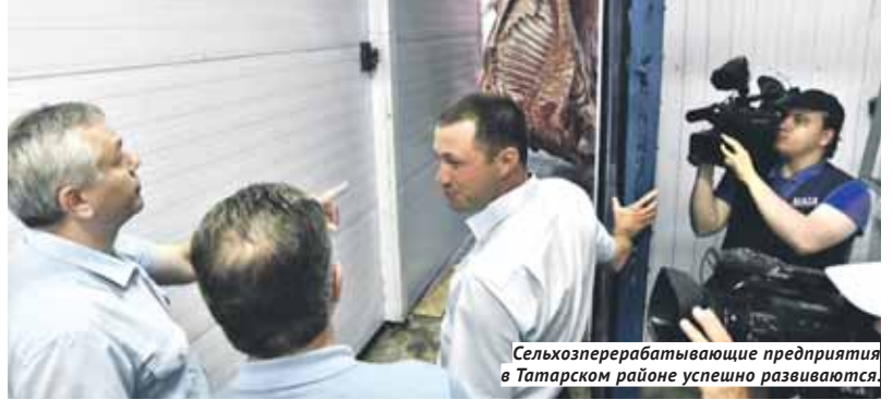
Сельхозперерабатывающие предприятия в Татарском районе успешно развиваются.