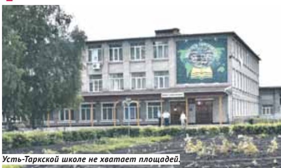
Усть-Тарковской школе не хватает площадей.

— За счёт модернизации мы возрождаем старые здания школ, они получают всё необ-