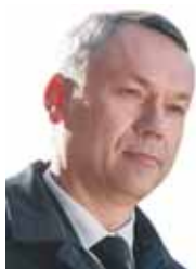
Андрей ТРАВНИКОВ, Губернатор Новосибирской области:

■ Депутат Законодательного Собрания от партии «Единая Россия» по округу №2 (Татарский, Усть-Таркский, Чистоозёрный районы Новосибирской области) ■ Комитет по транспортной, промышленной и информационной политике, заместитель председателя ■ Комиссия по наказам избирателей ■ Фракция: «Единая Россия»