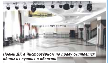
Новый ДК в Чистоозёрном по праву считается одним из лучших в области.

Дворец культуры открыл двери для жителей Чистоозёрного в марте 2022 года и стал главной культурной площадкой всего района. В новом здании разместились три учреждения культуры: культурно-досуго-