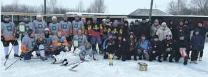
Участники хоккейного турнира памяти Валерия Воронцова.