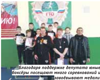
Благодаря поддержке депутата юные боксёры посещают много соревнований и завоевывают медали.