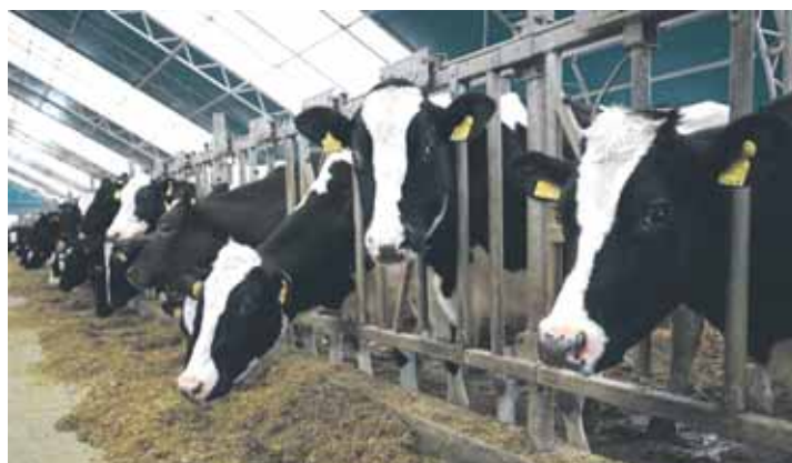
Если не отменить новые правила, то только Новосибирская область может потерять 40 тысяч коров.

— Вывезти из Сибири зерно на экспорт невозможно. Наши заявки по железнодорожным перевозкам в направлении восточного полигона в лучшем случае выполняются на 17 процентов. А это направление сегодня является единственным возможным драйвером роста отгрузок в КНР и Юго-Восточную Азию. Зампред аграрного комитета Госдумы Олег Нилов обратился к председателю Правительства РФ с просьбой в три раза увеличить закупки зерна государством у аграриев в интервенционный фонд, чтобы вздёрнуть цену на растениеводческую продукцию. В этом плане фракция действует, коллеги в работе, мы поддержку чувствуем. Сезон рекордных урожаев 2022–2023 годов обнажил проблему. В связи с тем, что аграриями был собран урожай зерновых в 157,7 миллиона тонн и масличных культур в 24,8 миллиона тонн, ожидается небывалый переходящий остаток. На начало предстоящей уборки по зерну он составляет порядка 26 миллионов тонн и до 3 миллионов тонн по «масличке». При ожидаемом новом урожае в 120–130 миллионов тонн у аграриев могут появиться серьёзные риски по хранению собранного. А с учётом ухода некоторых трейдеров с рынка проблема может усугубиться. Олег Нилов также обратил внимание на то, что темы сохранения и реализации прошлогоднего урожая ставятся практически на каждом заседании аграрного комитета, что, по мнению депутатов, Правительство должно активнее искать рынки сбыта: в Южной и Центральной Америке, Африке, Афганистане, Венесуэле, Северной Корее и других странах.