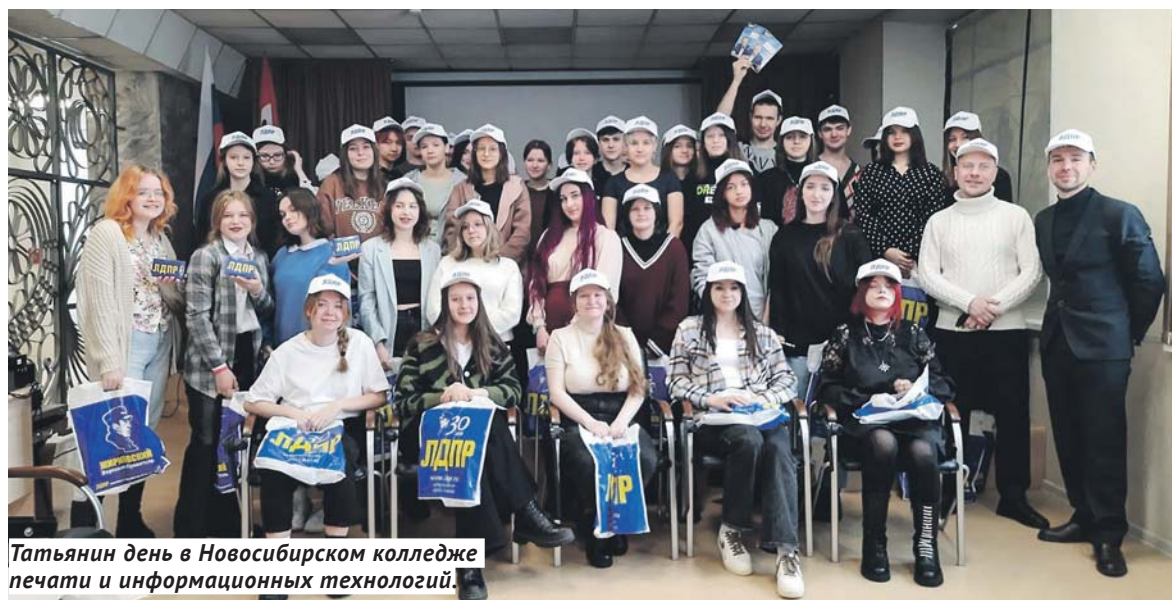
Татьянин день в Новосибирском колледже печати и информационных технологий.

Координатор Новосибирского регионального отделения ЛДПР, депутат заксобраний Евгений Шаблинский отмечает, что молодёжь — это основной костяк партии и её кадровый резерв.