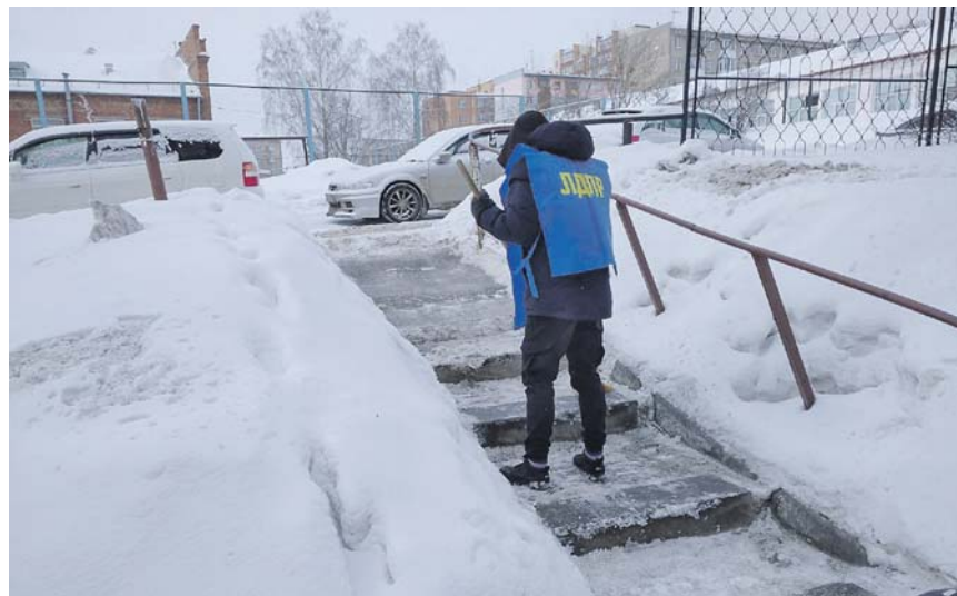
Активисты партии всегда готовы прийти на помощь!

Текущий год тоже не будет лёгким и простым, но мы как партия, как депутаты должны сделать всё, чтобы поддержать пенсионеров и инвалидов, помочь нашим мобилизованным защитникам и их семьям, позаботиться о детях. И я ещё раз повторю: для нашей партии и всех депутатов сейчас самое главное — скорейшее приближение нашей Победы!