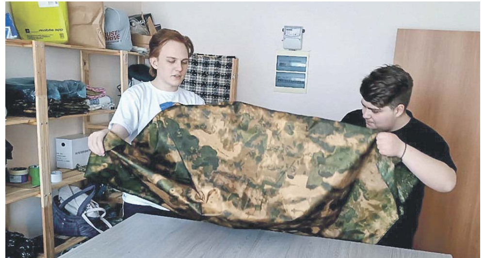
Молодёжь ЛДПР помогает швейбагу.

Победители конкурса получают возможность стать кандидатами от ЛДПР на выборах всех уровней.