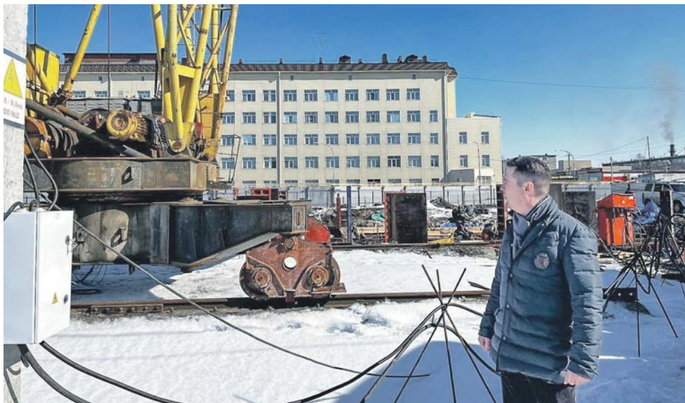
Строительство детской поликлиники — огромный шаг к созданию медицинского кластера в Барабинском районе.