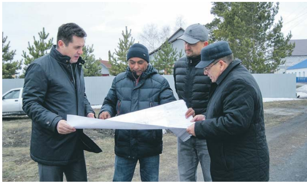
Спустя много лет дан старт реализации партийного проекта — строительству бассейна в Здвинском районе. И вот радостное событие — подрядчик приступил к выполнению заказа.

— Сегодня в Новосибирской области активно развивается патриотическое направление, в частности,