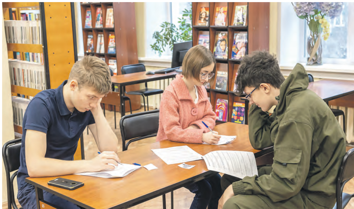
Участники просветительской акции «Краеведческий эрудит: Новосибирь-85» в Новосибирской областной научной библиотеке.

Краеведение и генеалогия идут бок о бок, библиотеки становятся тем местом, где человек, задумавший написать родословную, может получить профессиональную