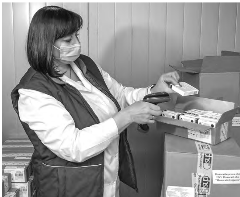
Пока на рынке отечественных вакцин от коронавируса «Спутник V» выглядит монополистом: доля «КовиВака» не превышает 5%. Потеснят ли его другие конкуренты?