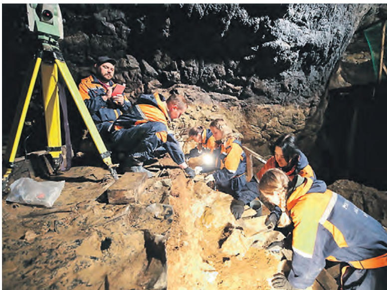
Идут работы в Денисовой пещере.

Когда и какими путями в Центральную Азию и Сибирь приходили их первые жители — «соплеменники» тех, чьи следы теперь изучают археологи в Денисовой пещере? По данным учёных, заселение бескрайних азиатских просторов шло в два этапа. Первый начался 2 млн лет назад, когда из Африки вышли древнейшие представители вида «хомо эректус» (человек прямоходящий), именно с ними связан древнейший в Сибири археологический памятник Карамы недалеко от Денисовой пещеры, возраст которого 600–800 тысяч лет. После этого наступил длительный перерыв, и на протяжении 300 тысяч лет ни одно человекоподобное существо не оставило после себя никаких следов — видимо, климат стал для них неподходящим. Вторая волна заселения Сибири началась с территории Ближнего Востока и Кавказа. Археологических памятников на пути следования этих путешественников осталось достаточно, чтобы восстановить картину миграции и «генеалогии» денисовского человека. На это и были направлены усилия 11 отрядов специалистов Института археологии и этнографии СО РАН, работав-