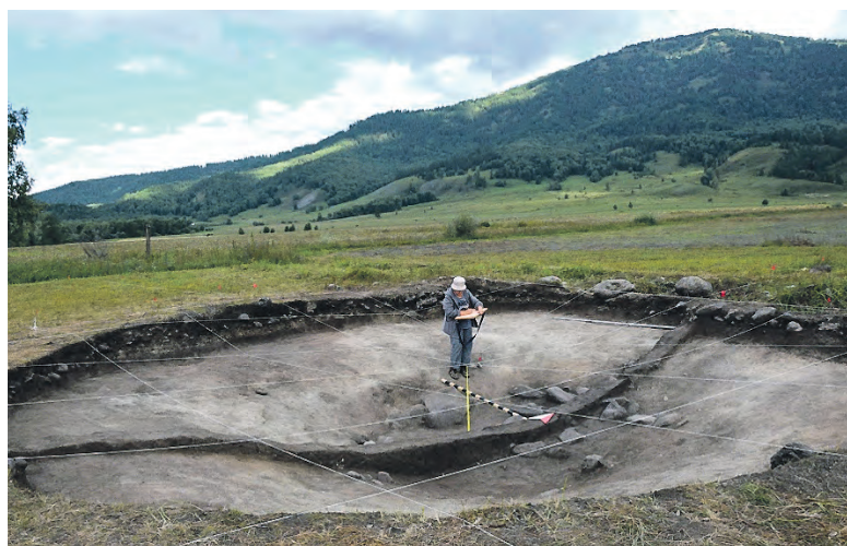
Раскопки кургана в Катандинской долине.

И даже на, казалось бы, давно изученной территории Новосибирской области каждый сезон приносит новые от-