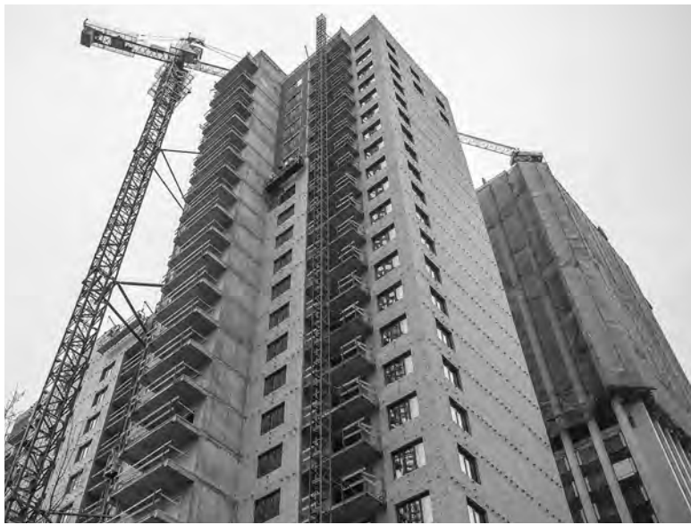
По данным на конец 2022 года, в регионе было введено 2 млн 137 тысяч квадратных метров жилья.

Строители подчёркивают: в том, что ни одного объекта в