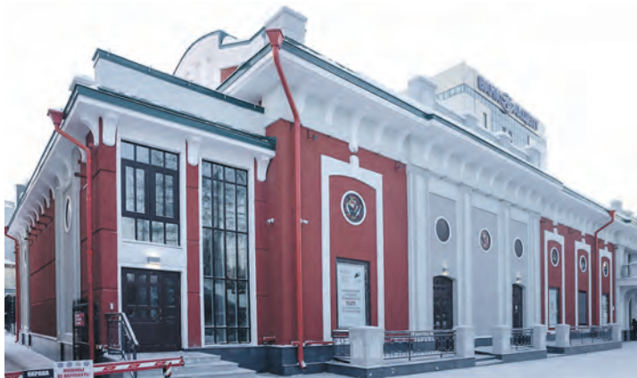
Здание «Пионера» реконструировали под театр в течение трёх лет.