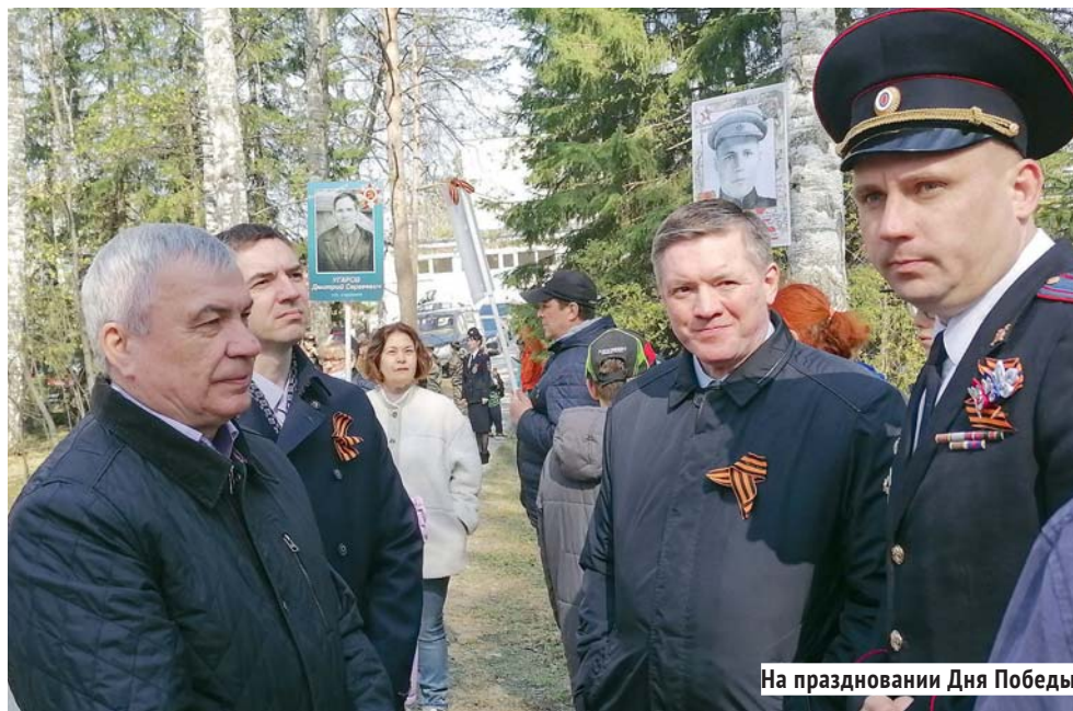
На праздновании Дня Победы.

Мы являемся активными участниками всех крупных программ, которые проводит Министерство науки и высшего образования РФ. В частности, вошли в число 18 университетов, которые стали участниками программы «Приоритет-2030».