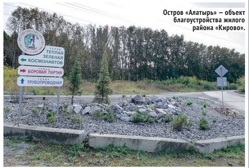
Остров «Алатырь» — объект благоустройства жилого района «Кирово».