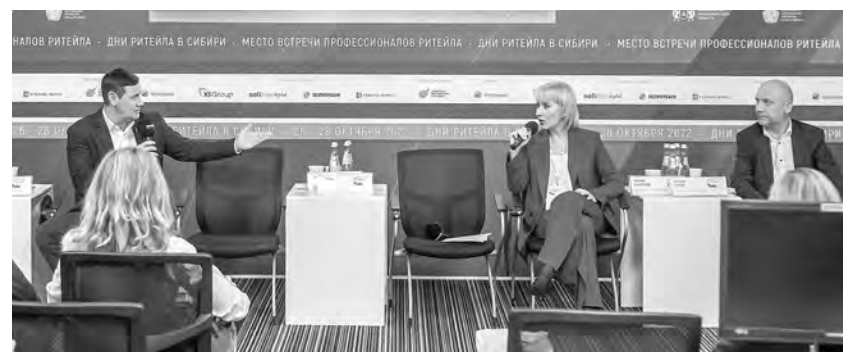
Лучшие решения рождаются в диалоге, уверены участники экспертной сессии.