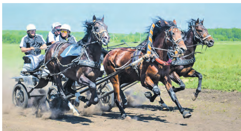
Конные бега на ипподроме Черепаново, 2022 год.

Обязательно загляните в Черепановский краеведческий музей имени И. Г. Фоломеева в здании Дома культуры. Познакомьтесь с историей рай-