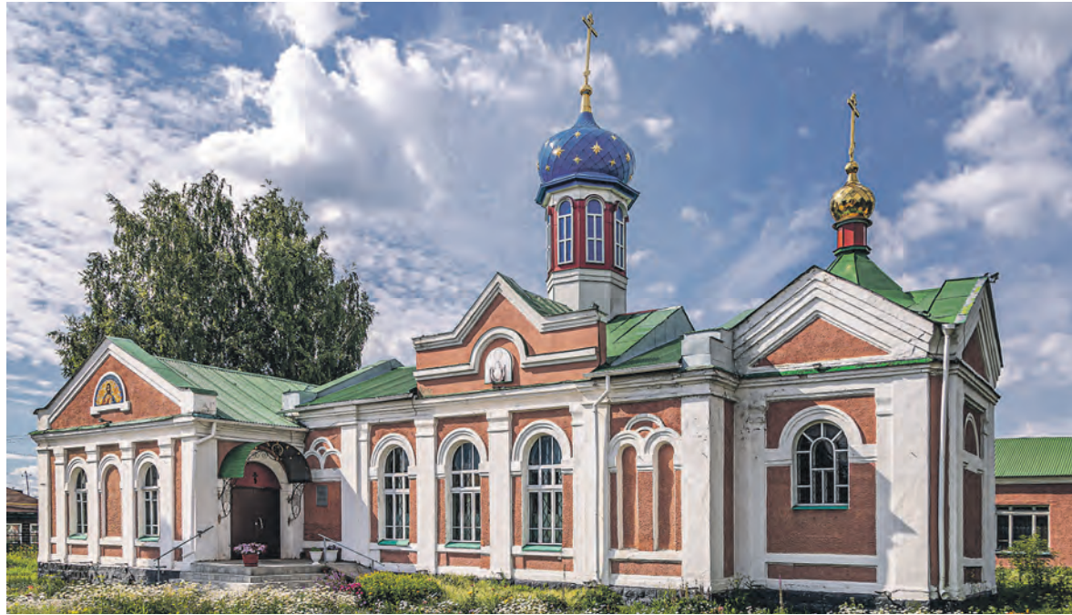
Храм святителя Алексия, митрополита Московского, был построен в 1914 году.

Поезда сменили конную тягловую силу в стране, где главной связующей нитью