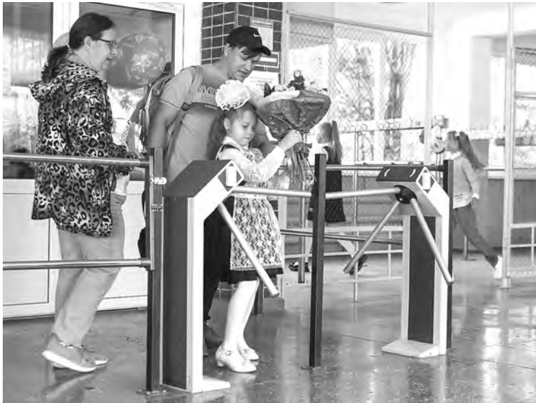
Сегодня проход в школу учителей и учеников осуществляется через специальный пропускной пункт.

На случай нештатной ситуации существуют алгорит-