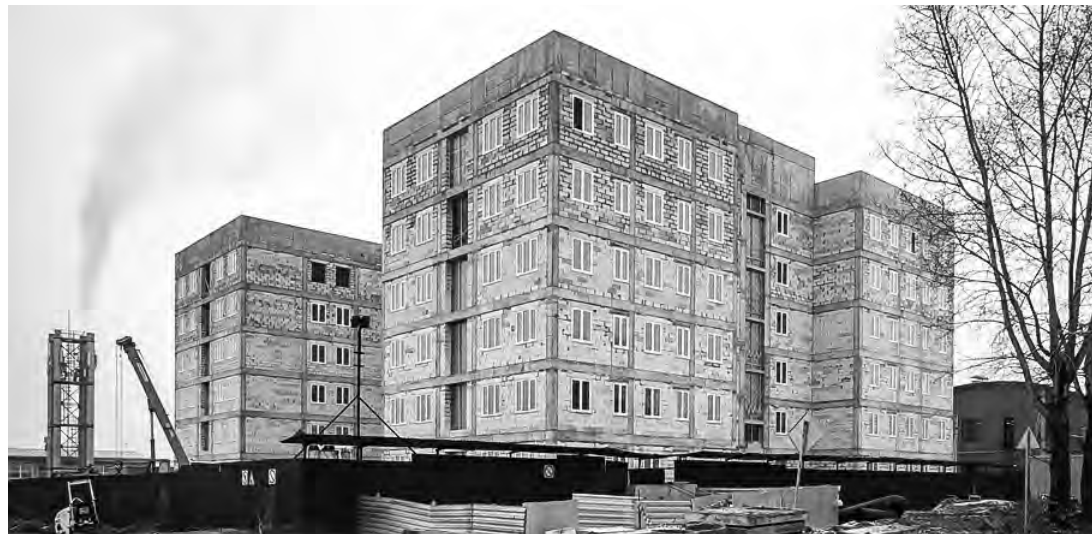
Одна из семи поликлиник в Новосибирске, строящихся по концессии, на улице Ереванская, будет сдана в 2023 году.

В 2022 году в Новосибирской области будет построено более двух миллионов квадратных метров жилья.