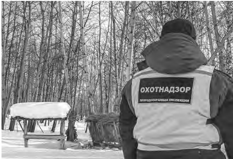
С начала 2022 года госинспекторы составили 496 протоколов об административных правонарушениях.

— Раньше использование тепловизоров и ПНВ было отдано на откуп регионам, и у нас в области на эти спецсредства был введён запрет, — отмечает и. о. начальника управления по охране животного мира