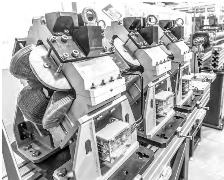
Магниты линейного ускорителя, собранного на площадке Института ядерной физики СО РАН.

Разумеется, на первых порах после запуска СКИФа международное сотрудничество на этой установке поколения 4+ будет осуществляться только с представителями стран, считающихся «дружественными», но создатели источника фотонов верят, что эта ситуация рано или поздно изменится. В конце концов, даже сейчас, как рассказал директор ИЯФ, новосибирские специалисты продолжают выезжать в командировки на европейскую установку ЦЕРН и коллайдер в японском городе Цукуба, поскольку только они могут управлять установленным там российским оборудованием и обслуживать его. А СКИФ, по словам Павла Логачёва, — «национальная история на 99 процентов, мы делали его для России, и участие зарубежных учёных может быть здесь только некой вишенкой на торте, чтобы мы могли привлекать на лучшую в мире машину лучшие мировые идеи наших коллег».