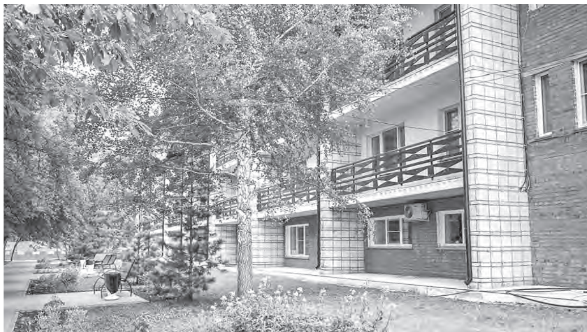
Санаторий «Доволенский» — курорт регионального значения на берегу живописного озера.

Первые жители селились на левом берегу реки Баган неподалёку от нынешнего Доволенского озера. Сначала тут насчитывалось около 40 дворов, крыши домов были земляными или соломенными, полы — глиняными. Некоторые жили в землянках. Люди охотились, ловили рыбу, возделывали землю. Не обошлось без стихийных бедствий — то сильный пожар