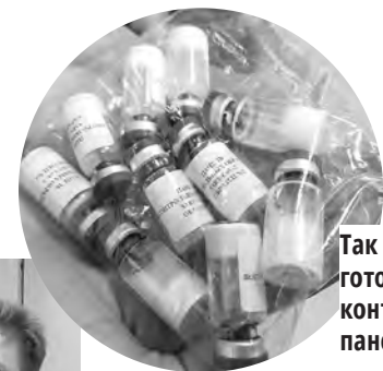
Так выглядят готовые контрольные панели.

Кроме разработок по диагностике ковида, учёные работают над такими же панелями по диагностике вирусов животных. Это будет сеть стандартных препаратов для нужд Минздрава, Роспотребнадзора и других ведомств, следящих