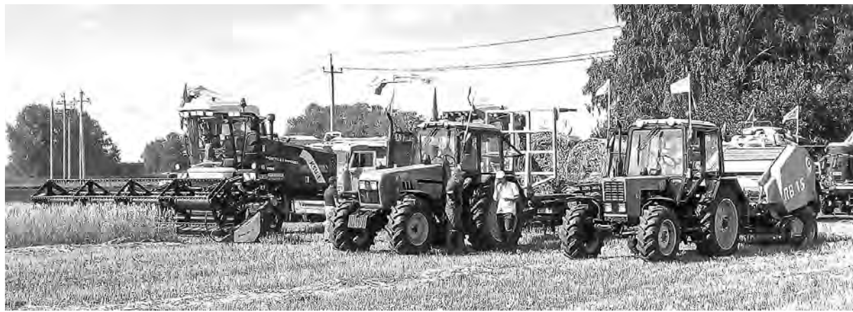
Показательные «выступления» новой техники — одна из традиций Дня поля.