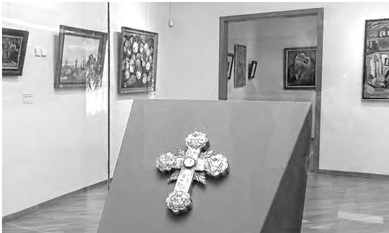
Крест с частицей Креста Господня в защищённой витрине.

По словам архиепископа Езраса Нерсисяна, наши народы связывает прочный фундамент духовного братства. «Хочу выразить признательность правительству Новосибирской области, властям города и особую благодарность сотрудникам музея, которые день и ночь трудились, чтобы