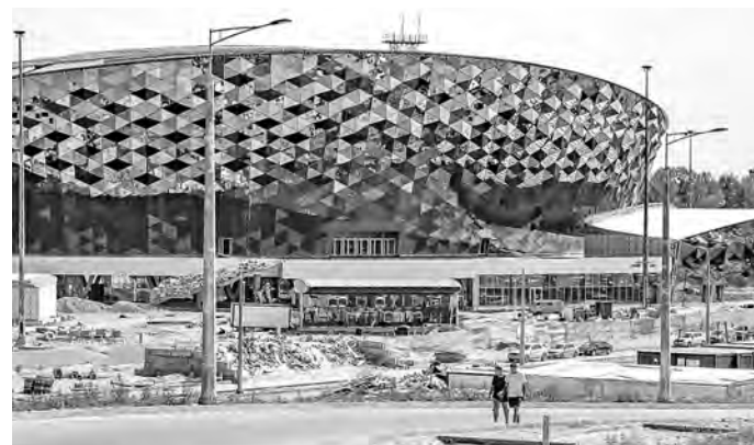
2,5 млрд рублей в первом полугодии направлено на строительство нового ледового дворца.

На 26% выросли налоговые поступления от торговых организаций, на 15% — от обрабатывающих производств, а добыча полезных ископаемых дала превышение цифры 2021 года в 5,3 раза, обеспечив поступление в бюджет 11,5 млрд рублей. Отрицательный показатель отмечен лишь в сфере финансовой и страховой деятельности, где поступления составили 73% от объёма 2021 года.