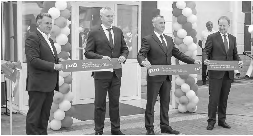
Два губернатора, спикер заксобрания и начальник дороги: редко на каком празднике в районе увидишь столько почётных гостей.