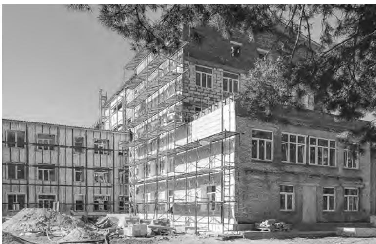
После ремонта Сузунская ЦРБ станет одной из лучших больниц области.