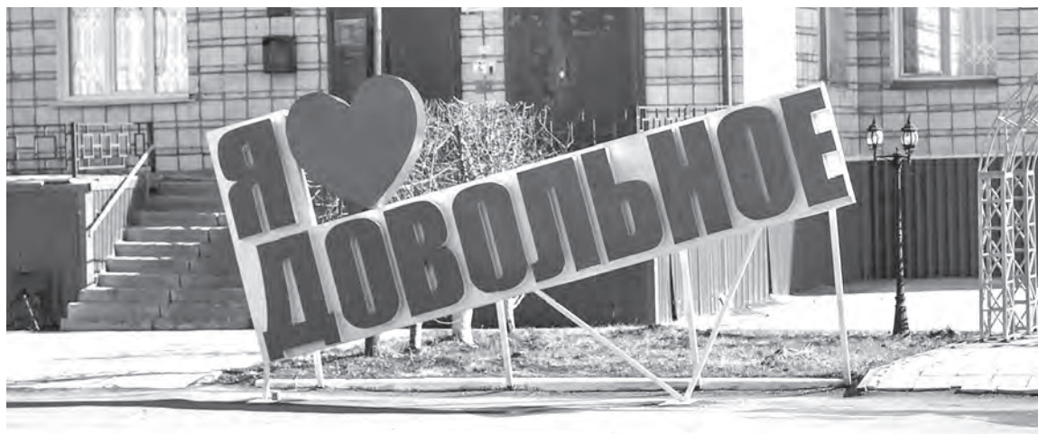
Довольное — лучше места не найти!