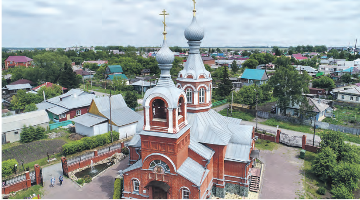
Храм Архистратига Михаила в Коченёво.

Современная история района поднялась так высоко, что выше некуда. Три года назад в Коченёво был открыт уникальный для нашей области Музей истории авиации и космонавтики имени Германа Титова . Во время войны и до 1961 года в Коченёво работал военный аэродром, который подготовил 1 107 боевых летчиков. В музее есть залы, посвященные реактивной авиации и Сибирскому военному авиационному училищу летчиков (СВАУЛ), в котором учились космонавты Герман Титов, Павел Попович и Борис Воинов . Залы второго этажа рассказывают о покорении космоса. В 1980-е филиал завода «Восток», корпуса которого расположены на въезде в р. п. Коченёво, выпускал