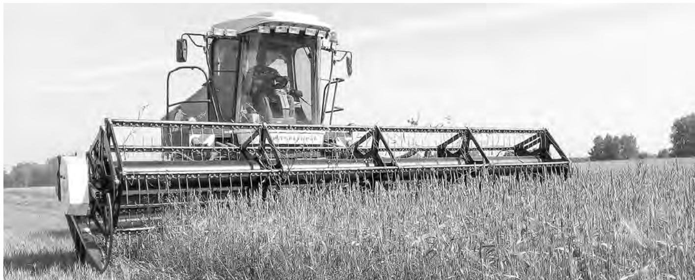
Заготовка четырёхкомпонентного сенажа в АО «Зерно Сибири».