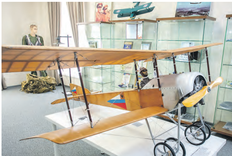
Модель первого отечественного самолѳта-истребителя С-16 Игоря Сикорского в Музее истории авиации и космонавтики.

Сам райцентр ведёт свою историю от села Камышинка, основанного в 1650 году. Развитие своё получил со строительством Московского тракта, в конце XIX века через село прошла Транссибирская магистраль, а в 1896 году появилась станция Коченёво. Одна из достопримечательностей посёлка — водонапорная башня на станции 1897 года . За рассказом о том, как происходило заселение, чем занимались первопоселенцы, какими инструментами добывали хлеб насущный, что составляло их духовную жизнь, стоит отправиться в местный краеведческий музей . Создан он был относительно недавно — в 2004 году — и собирался с той большой любовью, когда каждый экспонат имеет свою уникальную судьбу и достоин внимания. Коченёвская земля богата своими творцами — резчиками по дереву, художниками по ткани и ткачами, кружевницами и вышивальщицами, мастерами по бересте и солодке.