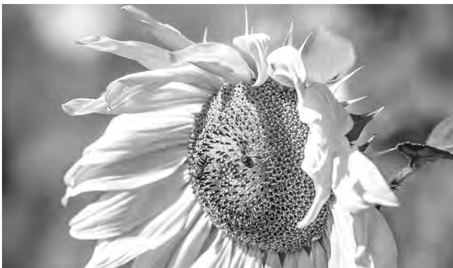
В сохранении популяции насекомых-опылителей должны быть заинтересованы и сами аграрии, ведь при снижении популяции пчёл они попросту недополучат урожай.

Жалобы на мор медоносных насекомых стали поступать из разных районов области ещё в июне. В июле Управление Россельхознадзора по Новосибирской области получило почти два десятка сообщений. Среди районов, где отмечена массовая гибель пчёл, — Новосибирский, Ордынский, Искитимский, Доволенский, Колыванский, Коченёвский и Куйбышевский. 27 июля ведомство разместило информацию о том, что специалисты определяют организацию, осуществляющую деятельность по обработке полей вблизи пасек, а также отбирают образцы погибших пчёл и зелёной массы растений для исследований на определение остаточного количества препаратов, которые проводятся в Новосибирской испытательной лаборатории ФГБУ «ЦНМВЛ». Предварительные проверки начаты в отношении АО «Зерно Сибири» и ООО «Агроферма «Иньские просторы», им направлены запросы о порядке и перечне используемых пестицидов и агрохимикатов. По требованию про-