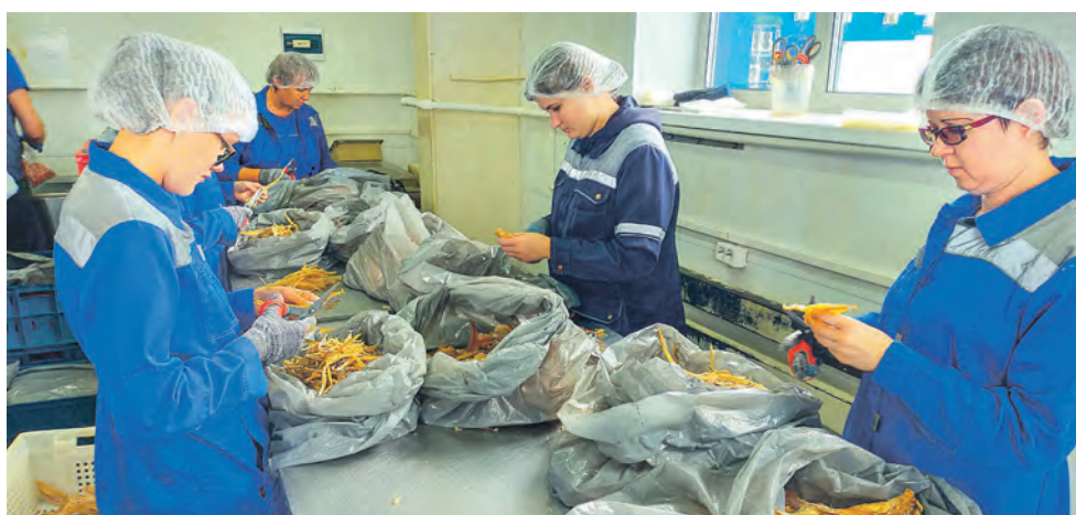
В одном из цехов «Сибирского рыбного дома».

Долгое время за Куйбышевым действовал госпромхоз «Северный», где выращивали пушнину. Когда Советского Союза не стало, приказало долго жить и это хозяйство, однако его промышленная база осталась, а близость к озеру Чаны привлекла внимание новых предпринимателей. Теперь здесь находится производственная площадка компании «Сибирский рыбный дом», где занимаются производством вяленой рыбы холодного и горячего копчения. В год здесь перерабатывается порядка 1 500 тонн рыбы. Как рассказал дирек-