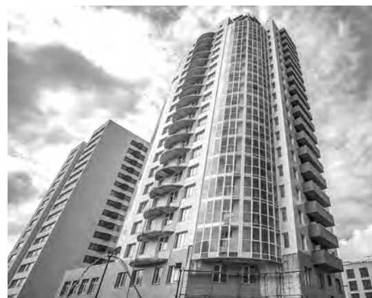
Долгострой на Декабристов, 10 был сдан в 2021 году после 14-летней строительной эпопеи.