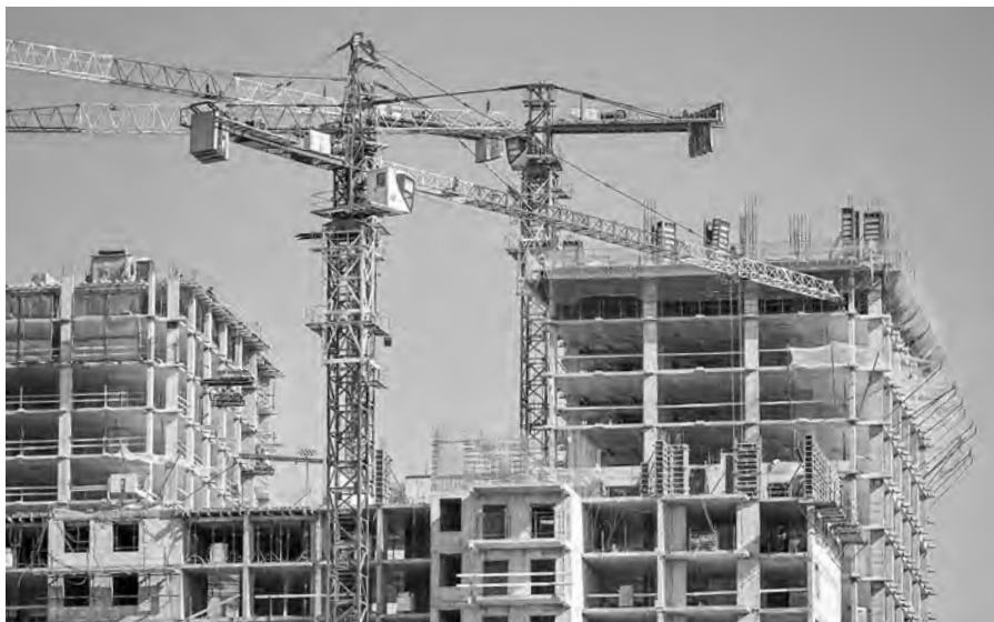
Вторичный рынок сейчас дешевле новостроек.