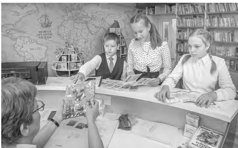
Модельная библиотека в Венгеро — место притяжения и детей, и взрослых.

— Поддержку на проведение капремонта получили восемь детских школ искусств, в том числе в Куйбышеве, Венгеро, Маслянино, Линёво. По другим направлениям мы работаем на обновление материально-технической базы. Стараемся синхронизировать свою работу с капремонтом в учреждениях культуры. Когда средства выделяются по нацпроекту «Культура», подключаемся и мы, чтобы дополнить оборудованием