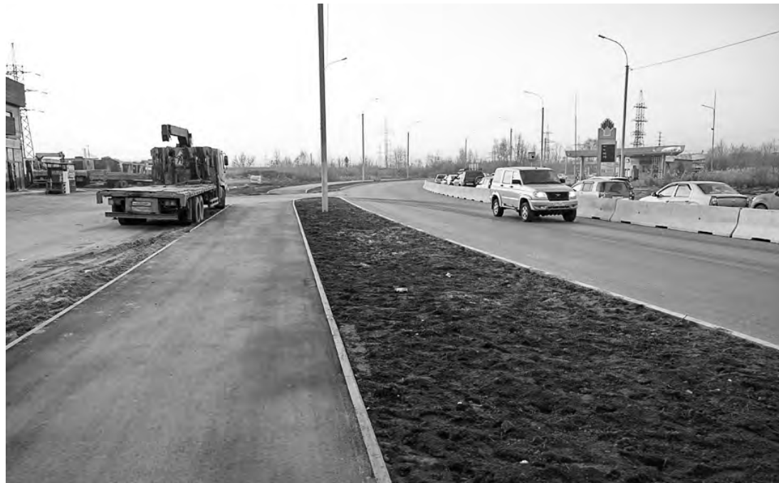
Улица 2-я Станционная — одна из «вылетных» магистралей, отремонтированных по БКД.

За пять лет реализации нацпроекта БКД в Новосибирской области отремонтировано и построено около 1 000 километров автодорог.