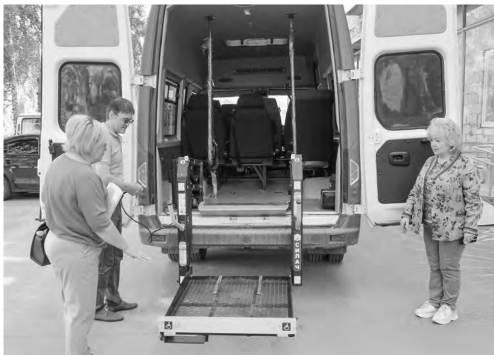
Стоимость услуги при использовании специализированного автотранспорта — 360 руб./час.