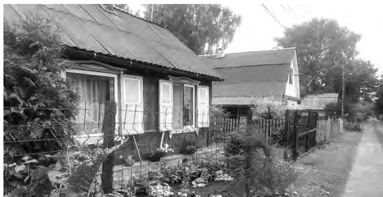
Самый действенный способ уговорить дачных нарушителей — вызвать наряд полиции.