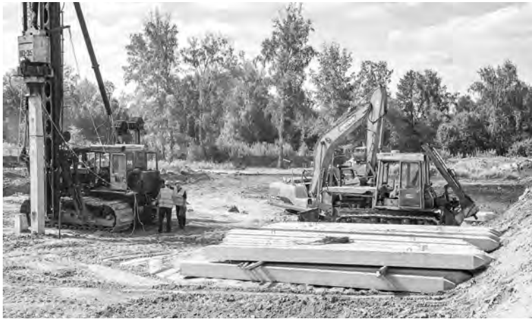
На этом месте через полтора года появится первый корпус нового производственного кампуса.

— Когда 15 лет назад мы начинали строительство Академпарка, было много сомнений, нужен ли нам этот проект. И мы сумели ответить скептикам результатами его экономической деятельности. Сейчас Академпарк — один из главных налогоплательщиков региона, он обеспечивает 1,5 млрд рублей в областном бюджете. А главная заслуга резидентов Академпарка — то, что Новосибирская область стала лидером инновационного развития России, занимая второе место после Москвы. У нас сегодня 334 резидента, они уже выросли из тех 120 тысяч квадратных метров площадей, какие есть в Академгородке, и поэтому мы начали строить вторую очередь производственных площадок, — рассказала вице-губернатор Новосибирской области