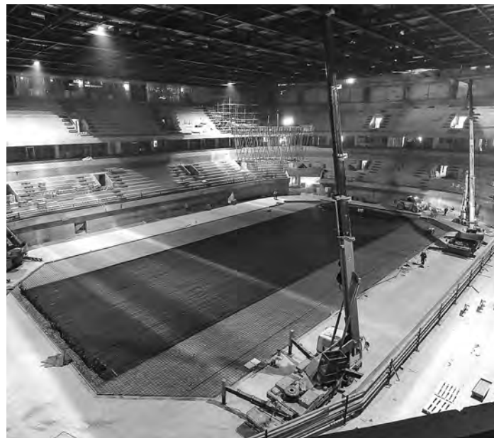
Строительство ЛДС идёт по федеральному проекту «Спорт — норма жизни» нацпроекта «Демография».

На объекте продолжается устройство ледового поля, строители ведут утепление и монтаж системы хладоснабжения. Полностью завершена заливка полов, продолжается монтаж перегородок, систем отопления, дымоудаления, вентиляции. В полном разгаре отделочные работы, остекление отдельно стоящих зданий входных групп, монтаж кабин лифтов.