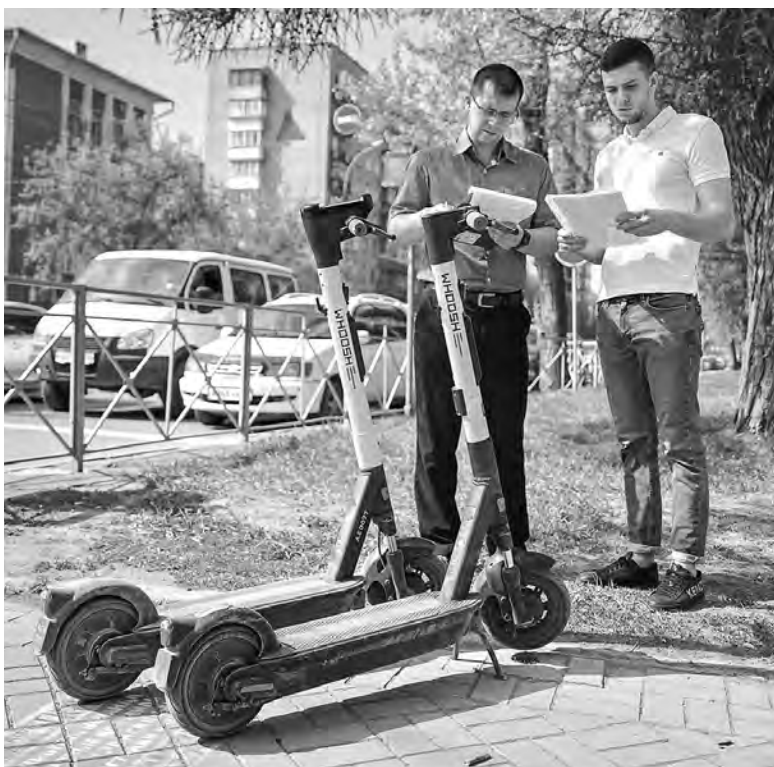
13 мая в новосибирске начали изымать незаконно припаркованные электросамокаты.

Согласно этим правилам, в жилой зоне (имеются в виду дворы многоквартирных домов) электросамокатчики приравниваются к пешеходам: имеют право ездить везде, а водители машин обязаны