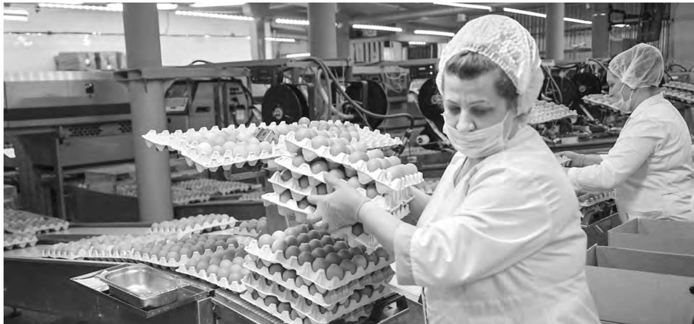
В 2021 году в Новосибирской области произвели 1,1 миллиарда куриных яиц.