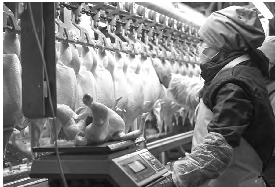
Обеспеченность мясом птицы в регионе превышает 90%.

Птицефабрик в нашей области не так уж много — всего семь: три мясные, три — яичные и одна смешанная, выпускающая оба продукта. Но каждое из этих предприятий — это мощь и огромные объёмы производства. К примеру, только птицефабрика «Ново-Барышевская», входящая в группу компаний «Птицефабрика «Октябрьская», производит 350 миллионов штук яиц, почти по миллиону в день. А на другой производственной площадке производится до 25 тысяч тонн куриного мяса в год. Масштабы впечатляющие, но ещё больше впечатляет строгое соблюдение всех норм без-