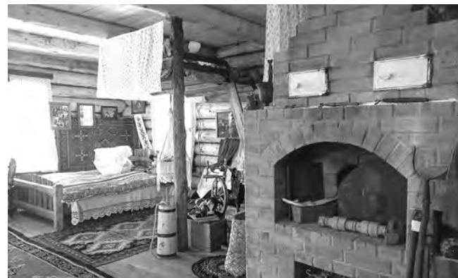
Музей «Усадьба старателя» в селе Егорьевском Маслянинского района привлекает туристов из нашего региона и соседних.

На субсидию по госпрограмме в Черепановском районе на границе с Алтайским краем будет установлена выездная стела «Новосибирская область». Кроме того, здесь обустроят подъездные пути, парковочные места и пешеходные дорожки, проведут освещение и озеленение территории, установят санитарные кабины. В Карасукском районе продолжатся работы на очень интересном объекте — оздоровительном природном комплексе «Савка»: для орнитологического и молодёжного центров приобретут оборудование, установят арт-объекты и плавающие фонтаны. В Чановском районе приступят к созданию проекта благоустройства набережной у озера Карачи «Сибирский берег здоровья», здесь будут амфитеатр со сценой, летнее кафе, пешие и велосипедные дорожки. А в селе Егорьевском Маслянинского района создадут сквер и памятник основателю золотодобычи графу Егору Францевичу Канкрину.