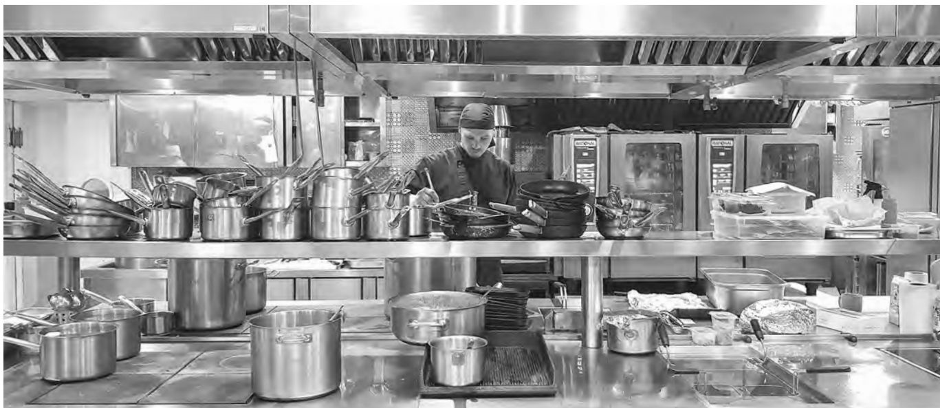
Сегодня около 30% продуктов, которые поставляются в заведения общепита, — местного производства.