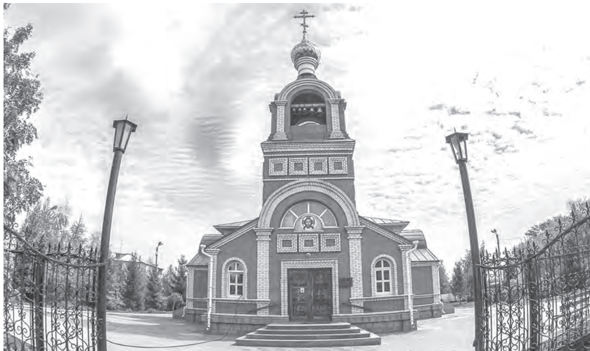
Храм во имя Святого апостола Андрея Первозванного является кафедральным собором Карасукской и Ордынской епархии.

Очевидно, что такие сложные географические «приключения» связаны с пограничностью карасукской земли. Здесь находится самая южная точка и самый южный райцентр НСО. Небольшая территория площадью чуть более 4 000 квадратных километров граничит с Баганским, Здвинским и Краснозёрскими районами, Алтайским краем и Казахстаном на западе. В нашем регионе сразу четыре пограничных с Казах-