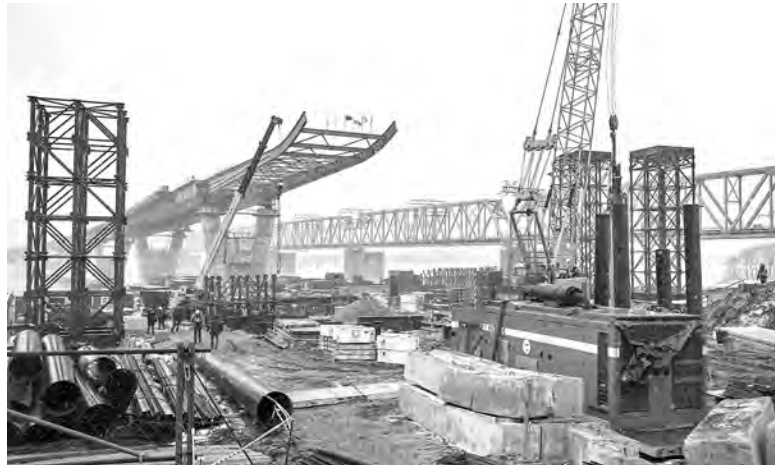
Средств на продолжение строительства четвёртого моста сегодня достаточно, заверил губернатор.

Губернатор также рассказал, как идёт реализация проектов в рамках ГЧП и концессионных соглашений. Из семи запланированных «концессионных» поликлиник реально будут построены три, работа над которыми уже идёт. Стоимость остальных четырёх после актуализации цен заметно увеличилась, плюс сильно подорожали кредиты, так что эти проекты стали невыгодными, поэтому решено все бюджетные ресурсы, запланированные для них, направить на строительство первых трёх поликлиник, пояс-