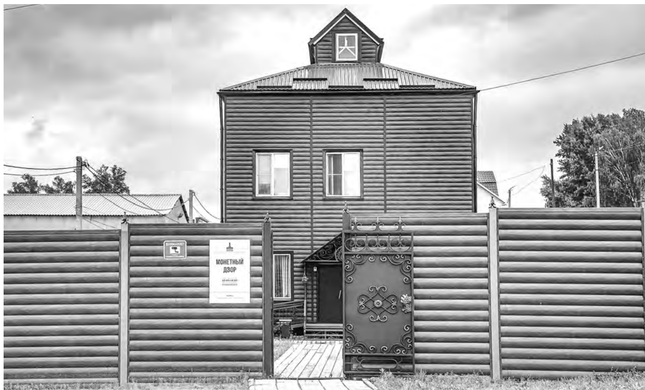
Музейно-туристический комплекс «Сузун-завод. Монетный двор» работает уже пять лет и пользуется большой популярностью у жителей и гостей региона.