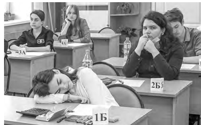
В этом году выпускников на ЕГЭ рассадят по одному в классах до 20 человек.

Самым популярным экзаменом по выбору вновь стало обществознание — его будут сдавать более 50% выпускников. Эксперты считают, что такая популярность обществознания формируется по двум причинам. Первая — детям кажется, что ЕГЭ по обществознанию легче остальных, но главное слово здесь, уверены педагоги, — «кажется». И второй пункт: обществознание входит в перечень предметов, которые необходимы для поступления на самые разные специальности — от юриспруденции до политологии.