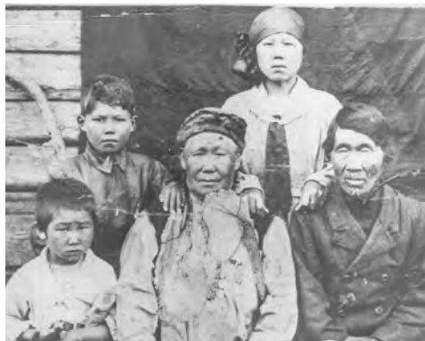
В бурятских семьях бережно хранят память о своих предках.