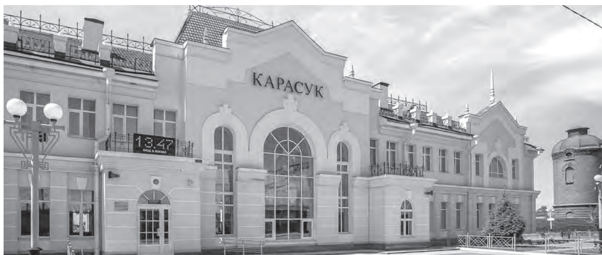
Построенный в 1939 году и отреставрированный в 2005-м, карасукский железнодорожный вокзал — один из самых красивых в области.